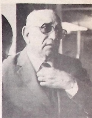
Deputado Ernani Sátyro

Feitas estas considerações, Sr. Presidente, quero aproveitar a oportunidade para manifestar a confiança, que não é somente minha, mas, de toda a Nação, na pessoa do Vice-Presidente Aureliano Chaves. A sua conduta de homem público constitui uma referência para todos nós. Seja como professor, como deputado estadual ou federal, seja como governador do Estado de Minas Gerais, em todos os postos que tem ocupado. Aureliano Chaves tem demonstrado estar à altura das elevadas funções de Presidente da República. Ele será, portanto, o melhor que vier a abraçar do Governo, um fil à continua dor da obra do Presidente João Figueiredo, o qual se sente ligado por compromissos naturais e morais com o destino da Nação e do mundo nos mesmos ideais. Fiquem, pois, tranqüilos Com Aureliano Chaves, o Brasil proseguirá na mesma marcha, até que Figueiredo, por vontade de Deus, volte ao seu posto e a sua missão.