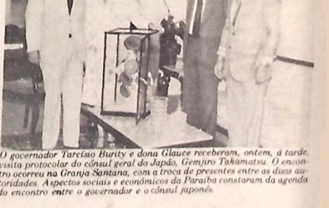
O governador Tarcísio Burty e dona Glávea receberam, ontem, a tarde, visita protocolar do cônsul geral do Japão, Genshiro Takamatsu. O encontro ocorreu na Granja Santana, com a troca de presentes entre as duas autoridades. Aspectos sociais e econômicos da Paraíba constaram da agenda do encontro entre o governador e o cônsul japonês.