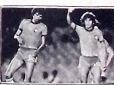
Zico, Sócrates e os abraços

O presidente da Associação Central de Futebol do Chile, Abel Alonso, criticou a atitude, dizendo "não conceber um equipe de jogadores que não comemore um gol que lhes signifique um título mundial".