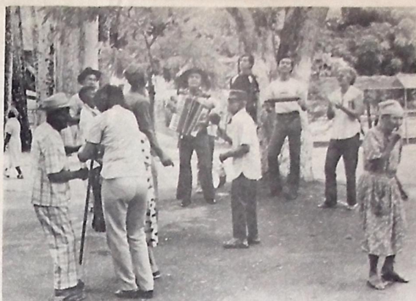
Os internos do Lar da Providência na Bica, comemorando a Semana do Anício

JOÃO PESSOA, 01 de outubro de 1981. RENATO WEBER BARROSO DIRETOR REGIONAL DR/PB