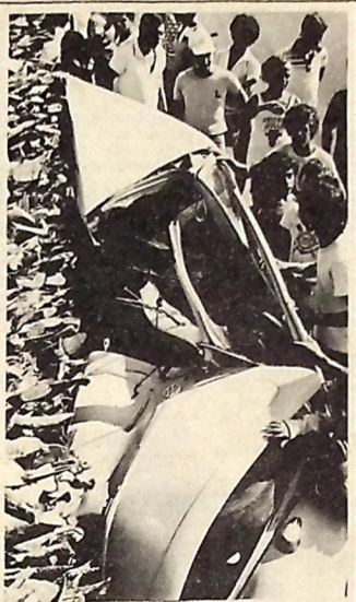
Em se no fmeo local do desastre com a Pick-Up, o Volks, visto de três ângulos, espantou-se na traseira do caminhão