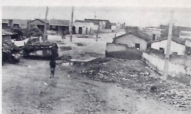
O bairro do Catolé receberá benefícios com a instalação do programa Promorar

Por outro lado, na próxima semana, todos os avicultores do país participarão em Recife, de um Congresso de Avicultores. Na oportunidade, dentre os problemas a serem debatidos no conclave, consta o levantamento da situação decorrente da escassez de milho no mercado brasileiro.