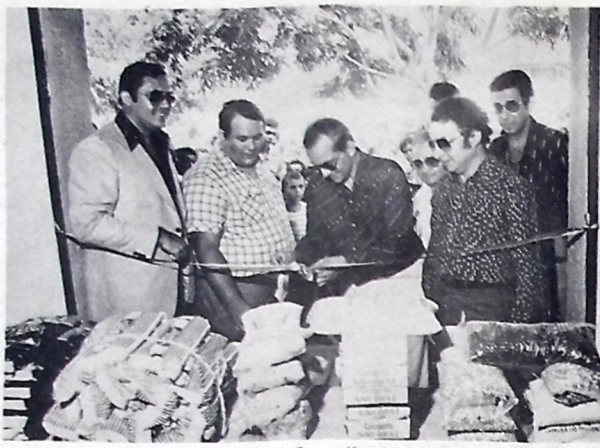
O 5º posto do Balcão, no Mercado de Jaguaribe, foi inaugurado ontem