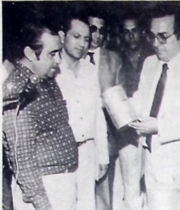
Burty foi a Emater agradecer o empenho na execução do programa de silos

Uma série de cosméticos, entre eles, Elmo, Flamingo, POK, Bão Coco, Perfumaria e Balck Cream Super Star, foram retirados de todo o comércio do Estado, segundo informou ontem o coordenador de Vigilância Sanitária Adelson Sorrentino. Ele afirmou que os produtos foram recolhidos em atendimento a determinação da Secretaria Nacional de Vigilância Sanitária que informou a existência de irregularidades em alguns produtos no Capital. Segundo o coordenador, os produtos foram recolhidos em atendimento a determinação da Secretaria Nacional de Vigilância Sanitária que informou a existência de irregularidades em alguns produtos no Capital. Segundo o coordenador, os produtos foram recolhidos em atendimento a determinação da Secretaria Nacional de Vigilância Sanitária que informou a existência de irregularidades em alguns produtos no Capital.