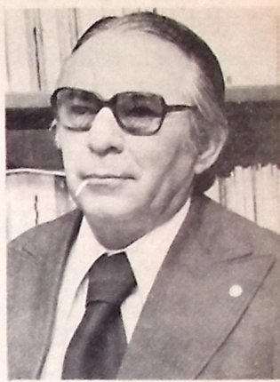
Projeto de Alvaro recebe solidariedade

O Presidente do IBDF comunicou ainda que, examinando pleitos da região Norte e Nordeste com relação a alguns aspectos da Portaria nº 510/81 de 09/09/81, decidiu introduzir algumas modificações, mediante a Portaria nº 553/81, com ampliação do prazo para integralização do capital até 30.12.81; alteração do limite máximo na área de plantio de árvores: caju de 500 para 1.500 hectares, algaroba de 500 para 1.000 hectares e coco de 500 para 500 hectares.