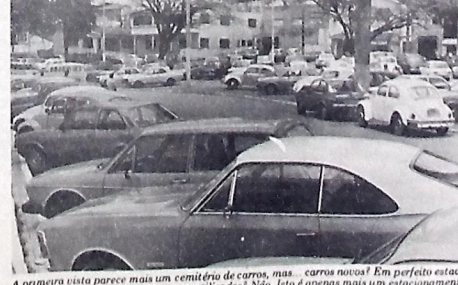
A primeira vista parece mais um cemitério de carros, mas... carros novos! Em perfeito estado de conservação! Prontos para serem utilizados! Não falo apenas mais um estacionamento clandestino - criado pelos próprios motoristas para se livrarem do pagamento em estacionamento - mas sim um estacionamento recém criado Zona Azul. Enquanto o Detran não decidir se permite ou não que veículos ali estacionem, os motoristas presentes, com seus carros de vários tamanhos e marcas, vão ocupando boa parte do espaço interno e externo do lotão de vários tamanhos e marcas, indo ocupando o estacionamento - entretanto dificulta o escoamento de veículos e seus condutores - neste estacionamento - entretanto dificulta o escoamento de veículos e seus condutores - neste estacionamento - entretanto dificulta o escoamento de veículos e seus condutores - neste estacionamento. (Página 5)