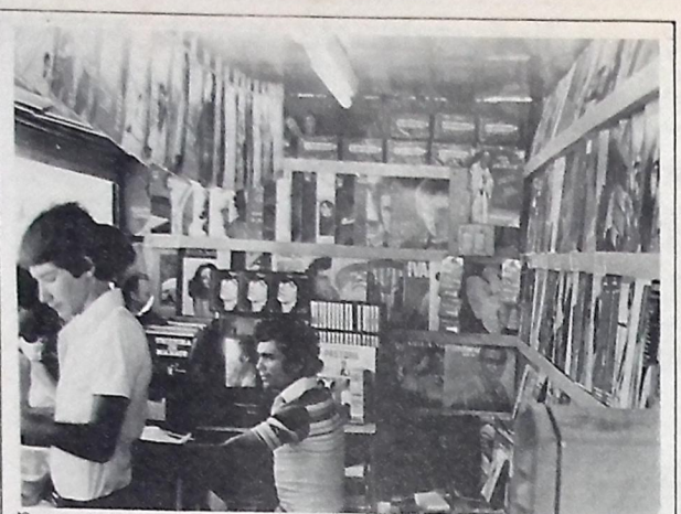
Os revendedores, das grandes e pequenas lojas, estão todos otimistas