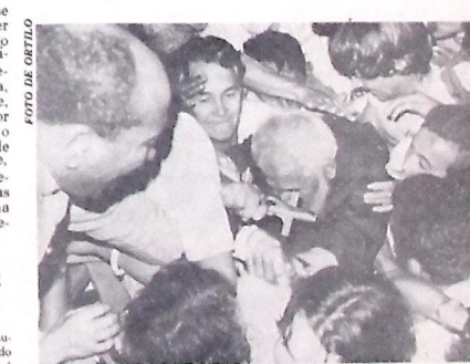
Todos os fiéis queriam tocar em Frei Damião