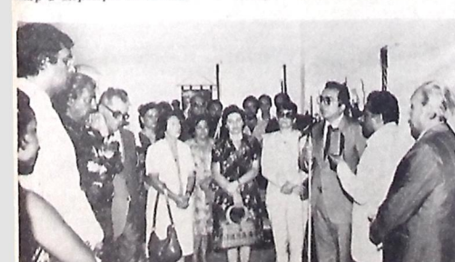
Recebeu desta vez importância da fundação para artesanato

O governador Tarcísio Burty disse na ocasião que o artesanato é a expressão única de milhares de famílias que vivem dos trabalhos executados pelos artistas e que o Governo do Estado, através da Secretaria do Trabalho, tem o prazer de colocar a Fundação à disposição do artesão.