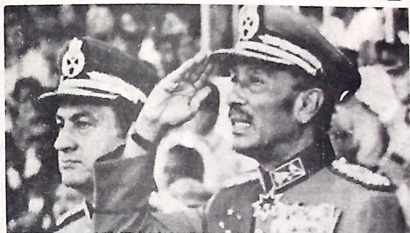
O pavor apoderou-se das pessoas que assistiram ao assassinato do presidente Anuar Sadat durante um desfile militar no Cairo

Cairo. - O presidente do Egito Anuar Sadat foi assassinado ontem por soldados rebeldes que o atacaram com granadas e rajadas de metralhadoras durante um desfile militar.