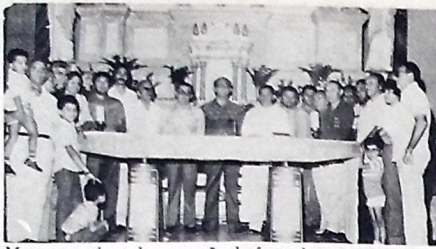
Momento solene de apuração da festa da padroeira