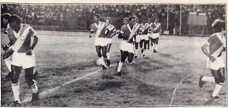
Jogadores do Auto e do Nacional estavam prontos para a partida de hoje, mas os "cartolas" entraram em ação e acabaram ganhando destaque em todos os meios de comunicação.