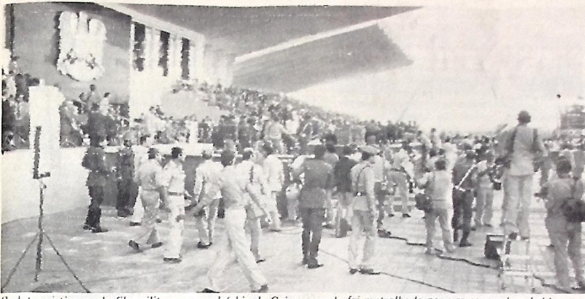
Sadat assistia um desfile militar, num subúrbio de Cairo, quando foi metralhado por um comando rebelde

Soldados rebeldes assassinaram ontem o presidente do Egito, Anwar Sadat, quando o dirigente político participou de um desfile militar num subúrbio de Cairo.