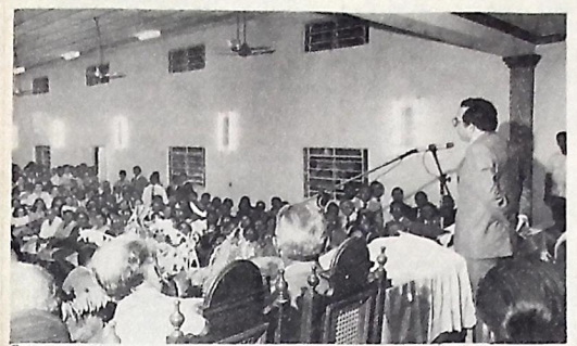
O governador destacou, o trabalho desempenhado pela igreja

"Na função de governador é da minha obrigação ouvir todos os setores da comunidade que dirijo e, especialmente, os evangélicos que tem desempenhado ação das mais profundas em todo Estado na formação da nossa juventude".