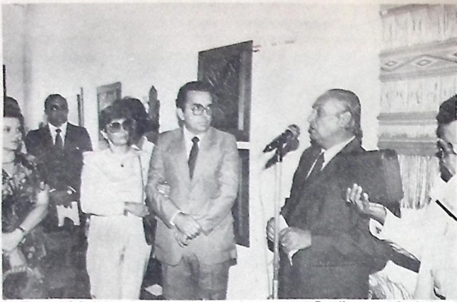
Burity prestigia inauguração da Fundação do Artesanato Paraibano, na Capital

A Paraíba será o terceiro Estado do Nordeste a ter todos os municípios atendidos por telefonia. Até agora apenas Alagoas e Rio Grande do Norte, que têm um pequeno número de municípios atendidos por telefonia em todo o território. No fim do próximo semestre a Paraíba também será o terceiro município integrante da Rede Nacional de Telecomunicações, uma vez que todos os equipamentos para instalação dos 51 Pontos de Serviço Telefônico restantes já estão contratados.