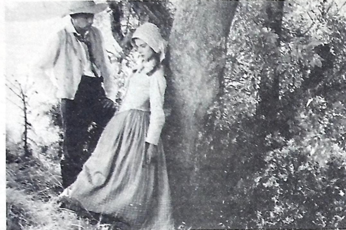
Em "Tess", há paisagens lindas e reconstituída da época. Hoje, em última exibição no Cine Municipal

dando uma oportunidade a compositores novos, pois ele pretende apresentá-los a colegas seus que possam como ele vir a gravar algumas dessas músicas num futuro próximo. Para isso, é só enviar a sua música gravada numa fita cassette, acompanhada da letra, com seu nome e endereço para a Caixa Postal 33106 - Leblon - Rio de Janeiro, RJ - 20.000.