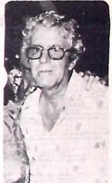
GUIMARÃES, O PREFERIDO

Quase mais nenhuma mesa o departamento social do Cabo Branco tem disponível para a festa de sábado em Miramar quando a divertida alvibruna irá realizar a buste com a presença, para "show" do Quinteto Violado.