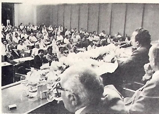
Burty presidiu o encerramento do Encontro de Prefeitos e Vereadores

O processo, em seguida, tanto poderá ser encaminhado ao PMDB para manifestar-se sobre as alegações do ex-Presidente como remetido à Procuradoria Geral Eleitoral para parecer.