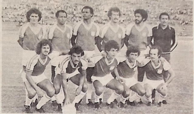
Auto está pronto para jogar, mas o Nacional recorrerá novamente à Justiça Comum