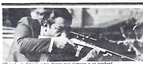
"Estado de Sítio": uma época que começa a se acabar?