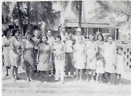
Comissão de seguros entrega abaixo-assinado