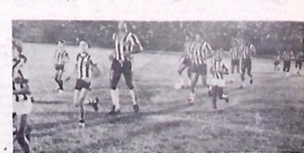
Botafogo faz amistoso na Ilha contra o time do Sport

A delegação botafoguense retornará hoje mesmo a Recife, iniciando os treinamentos amanhã à tarde para o primeiro jogo no terceiro turno do certame promovido pela Federação Paraibana de Futebol.