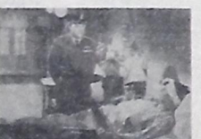
Ray Milland em "Audiência a Jato"

O GOLPE DA VIRGEM (*) - Produção italiana. Direção de Fernando Di Leo. Com Ursula Andress e Woody Strode. A cores. 18 anos. No Tambor. 14h30m e 20h30m.