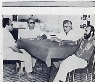
Prefeito de Brejo do Cruz em Sousa