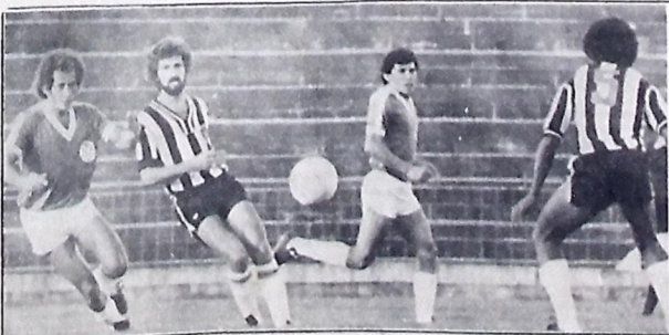
O Botafogo só joga quarta-feira, pelo campeonato, contra o Guarabira

Em paralelo às comemora-ções de aniversário do clube, a equipe do Botafogo prossegue seus treinamentos com vistas ao próximo compromisso pelo Campeonato Paraibano, em seu terceiro turno, quarta-feira, contra o Guarabira, no estádio Almeida.