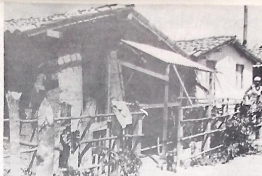
Um morador denunciou venda de casebres em favela perto do Conjunto Ernani Sátiro