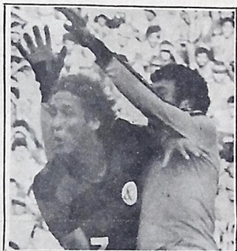
Campinense faz amistoso hoje em Natal

Campina Grande (Sucursal). - O Campinense se apresenta hoje a noite no Estado Castelão, em Natal, contra a equi-pe do ABC, num jogo amistoso, aguarda-do com muita expectativa pelo torcedores natalenses. Para o time paraibano, além de promover a estréia do treinador Acosta, recém-contratado, servirá para entrosar os novos atletas, já que o time não atua pelo campeonato neste meio de semana.