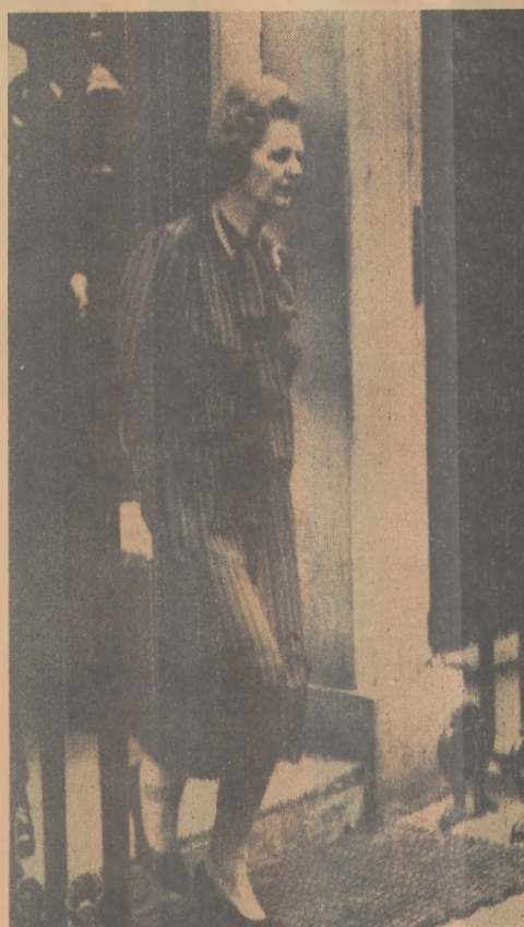
Thatcher vai a reunião de emergência depois da invasão das ilhas (Falkland Islands)

Acetate-se automóveis como parte do pagamento. Tratar pelo fone: 224-5304 - Valor: Cr$ 2.600.000,00.