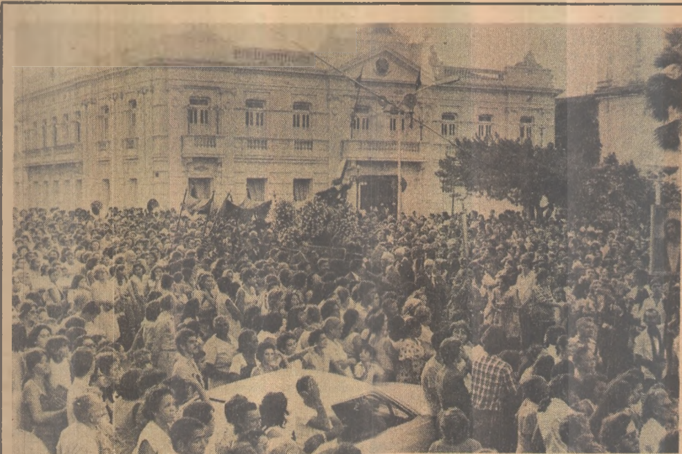
Acompanhando a procissão, a multidão lotou a praça João Pessoa

Na oportunidade, o arquiteto fez uma explanação de todo funcionamento da obra, desde os locais onde serão instalados cinema, teatros, restaurante, museus, se demorando no subsolo, onde estão biblioteca - com seus 5 quilômetros e 400 metros de estantes -, e no planetário, que terá "pela primeira vez, na história do plástico, espelhos especiais para a cobertura do planetário e espelhos deformativos para o deleite das pessoas", afirmou Bernardes.