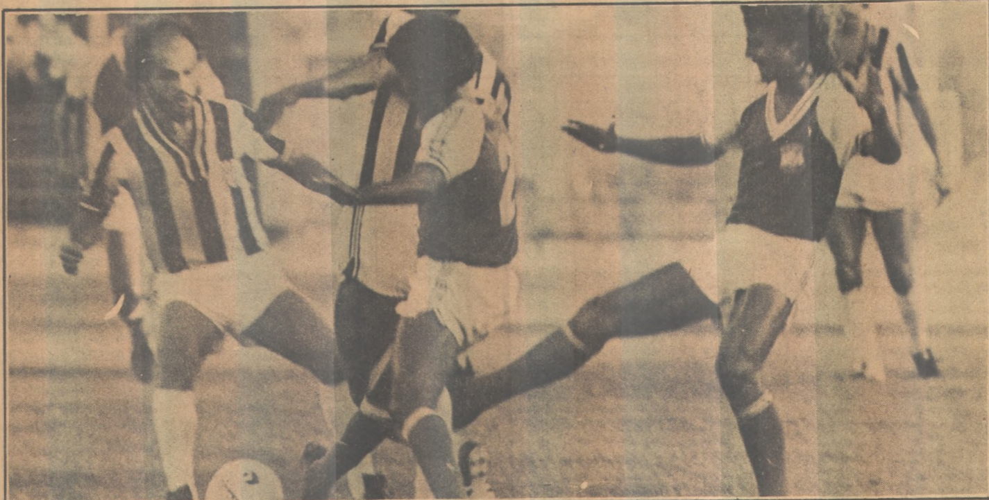
Em Campina, o campo do Treze será uma opção para jogos do Campeonato Paraibano

E o Nacional de Patos? Será que as contratações feitas atenderam as pretensões dos torcedores e dirigentes?