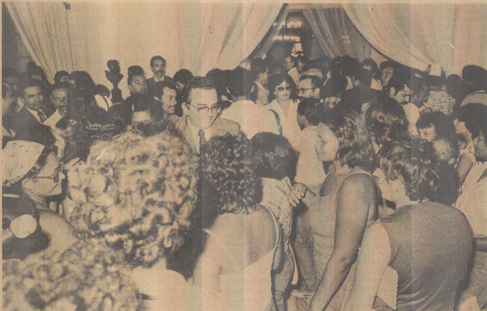
Centenas de operários compareceram à solenidade de assinatura, além de políticos, e outras autoridades

O Governador assinou ontem a mensagem que foi recebida em sessão extraordinária pela Assembléia Legislativa