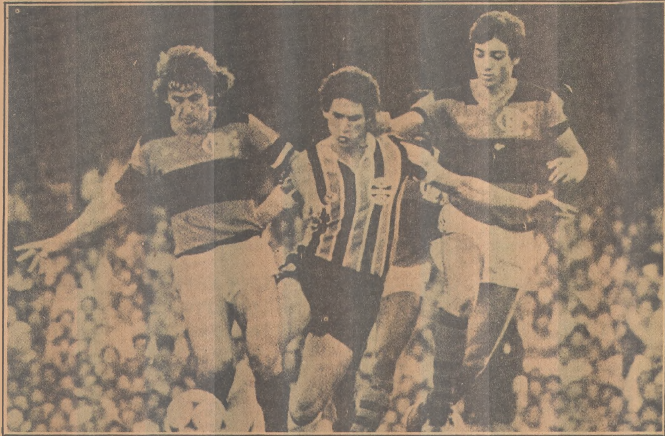
Zico, o astro do Flamengo, na decisão com o Grêmio, hoje, no Olímpico