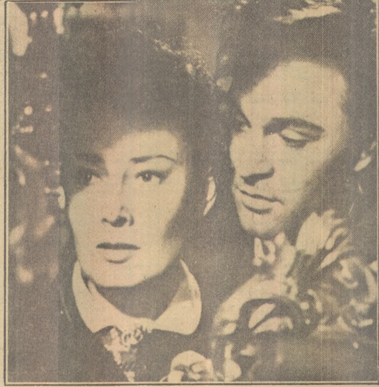
"Espírito Indômito", de Zinnemann, é um filme sobre a readaptação dos inválidos de guerra; e "Os Boas-Vidas", de Fellini, é semi-autobiográfico