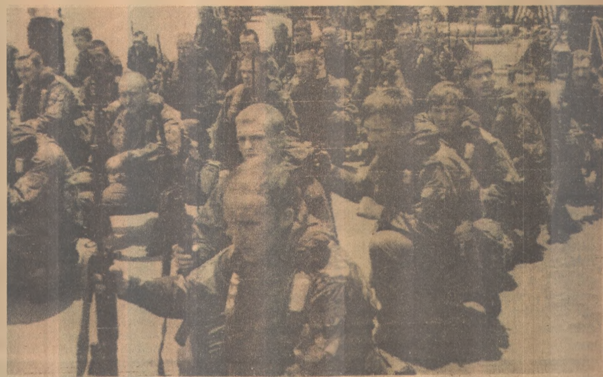
Os fuzileiros navais ingleses a caminho da luta no porta-aviões Invincible

O presidente Ronald Reagan pediu à Grã-Bretanha e à Argentina que moderem suas atitudes a fim de evitar um conflito armado e busquem um acordo pacífico. - (Página 7).