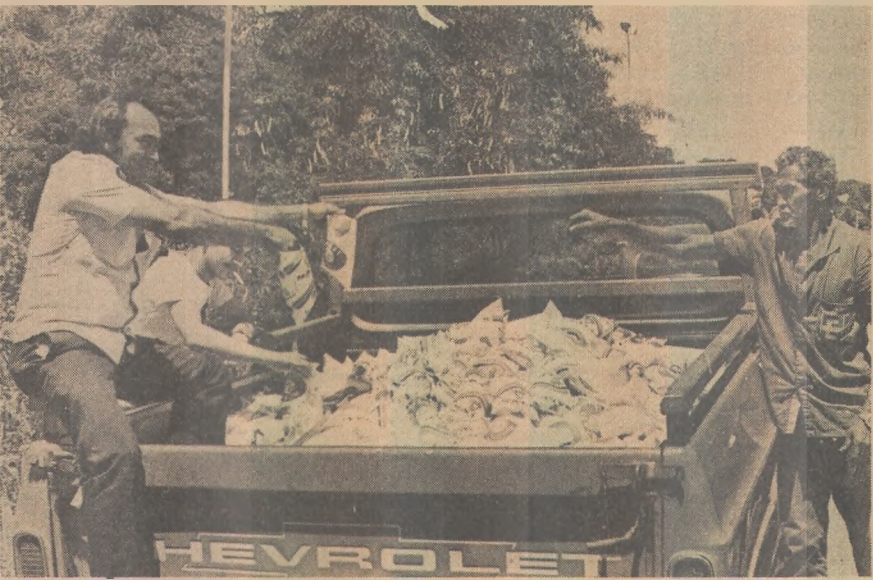
Mais de mil litros de leite foram apreendidos ontem

Na opinião do deputado Nícias Ribeiro, do Pará, "o resultado prático do Congresso foi a troca de idéias existentes, o conhecimento recíproco dos problemas de cada região e dessa vez, a redação do telegrama para que não seja mais permitido o desvio de verbas de uma para outras regiões "como aconteceu recentemente com a quantia de Cr$ 30 milhões de cruzeiros que viriam para o Nordeste e acabaram ficando no Amazonas", conforme assegurou o deputado Galdino Leite.