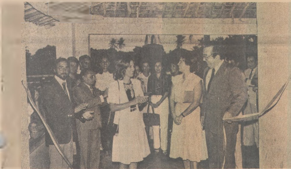
O governador e outras autoridades compareceram à inauguração