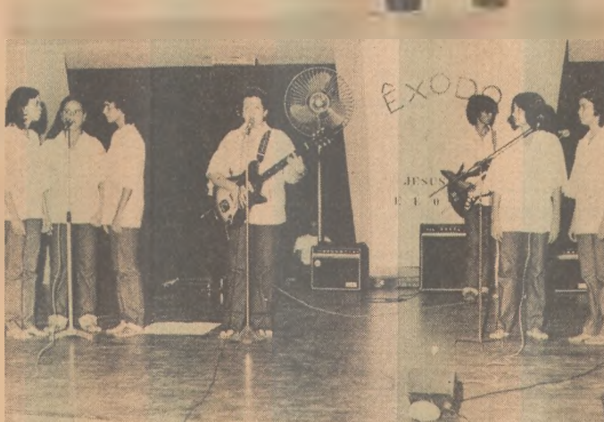
Possível desencontro em termos sentimentais. Saúde delicada. Evite se automedicar.