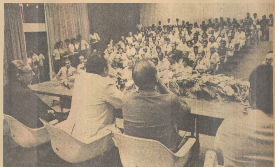
Burity falou da contribuição do Escotismo na Educação

A partir de hoje os líderes do escotismo se reúnem no Hotel Nazareno, para início das sessões de discussões. O encontro se encerra amanhã. O ministro Guido Mondim, na abertura do encontro, no auditório do Centro Administrativo, fez um relato sobre a origem do escotismo e sua prática no mundo inteiro. Revelou, por exemplo, que no Brasil existem 16 milhões de jovens engajados no escotismo.