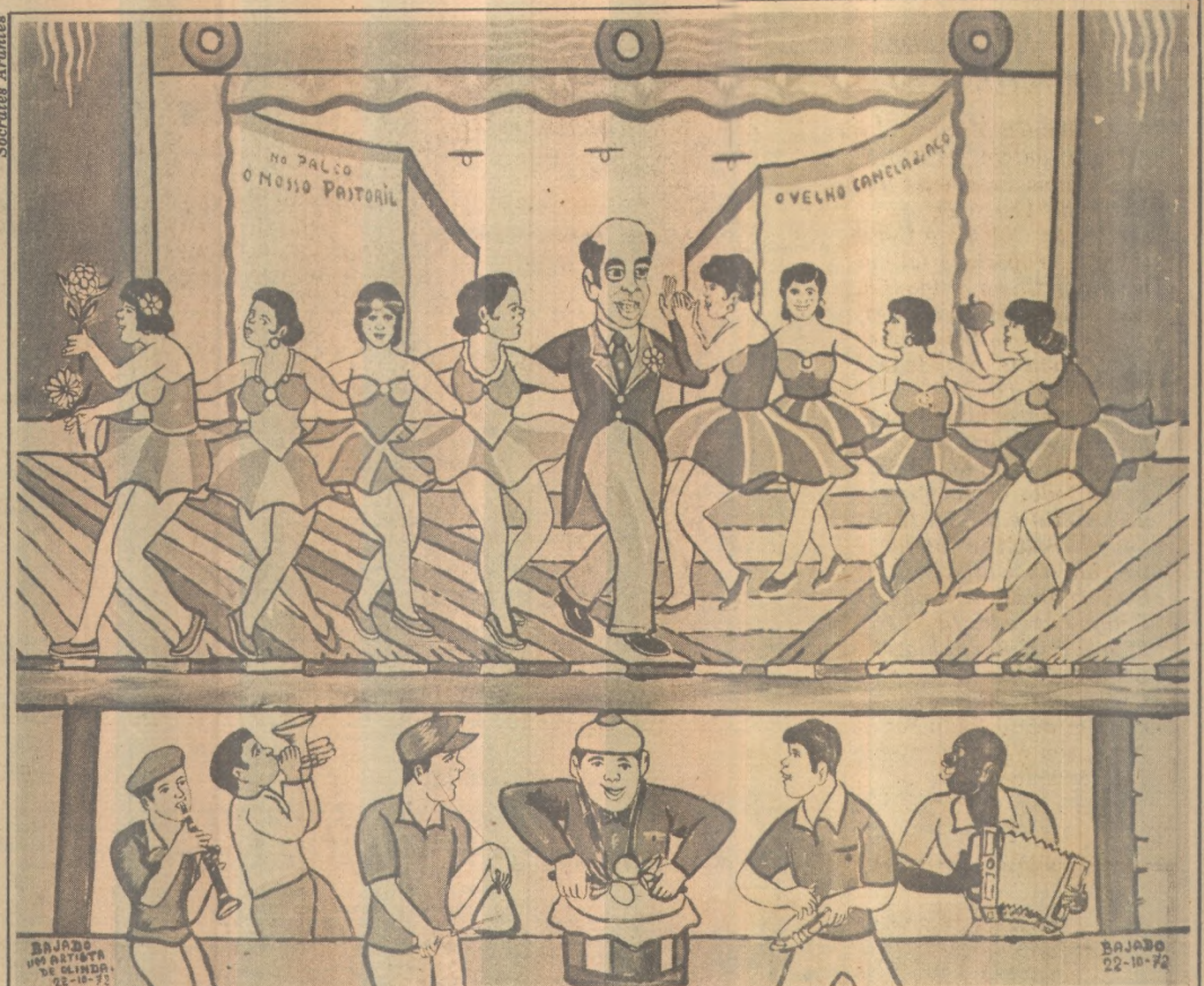
Um dos quadros de Bajado - "um artista de Olinda" - em exposição no Núcleo de Arte Contemporânea

ÁRIES 21 de março a 20 de abril - Hoje o ariano deve dedicar-se mais às compras e atividades domésticas, em atitude de recolhimento e introspecção. Favorecidas as construções e decorações. Não assine documentos importantes ou questione com autoridades. Busque usufruir plenamente do convívio dos que lhe são caros. Aconselhada maior aproximação com a natureza. Negligência no amor. Sua saúde continua regular. TOURO 21 de abril a 20 de maio - Você hoje pode, de forma altamente positiva, dedicar-se a assuntos que digam respeito a modificações em seu lar ou ambiente de trabalho. Excepcional oportunidade de aprimoramento de suas condições pessoais poderá lhe ser oferecida de forma inesperada e como grande surpresa. Harmonia doméstica. Procure analisar calmamente seus reais sentimentos. Saúde boa. Grande vitalidade. GÊMEOS 21 de maio a 20 de junho - Aproveite este sábado para ordenar, corretamente, seus planos e projetos mais imediatos, relacionados a sua vida pessoal e profissional. Controle de forma mais efetiva uma tendência acentuada a compra de impulso e fundadas em repentinas decisões. Surpresas agradáveis com parentes ou amigos próximos.