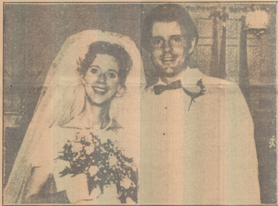
Blythe Danner e Michael Moriarty: "É Tarde Demais Para Voltar"

É TARDE DEMAIS PARA VOLTAR (***) - Um dos mais belos e originais filmes já produzidos diretamente para a TV - destacando sua estrutura narrativa absolutamente singular, bastante avançada com relação aos padrões convencionais dos telefilmes - É Tarde Demais Para Voltar