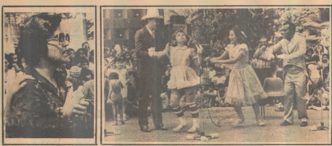
Secretária Giselda Navarro - Personagens do Sítio do Pica Pau Amarelo na comemoração a Lobato

Para um melhor e mais rápido atendimento, neste novo posto de atendimento, a gerência regional da CEF vai colocar à disposição três funcionários que avaliarão as jóias, e dois caixas, tendo em vista que a movimentação tende a aumentar.