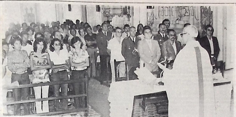
Jornalistas, autoridades, funcionários e leitores foram à missa em Ação de Graças por A UNIÃO