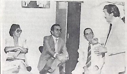
Depois da missa, o governador veio à redação