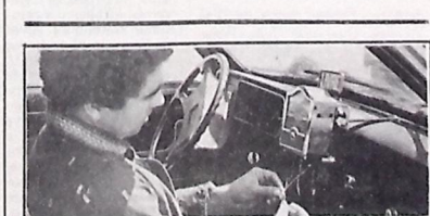
Os técnicos do IPM realizam a aferição dos táxis que têm placas terminadas em 9 a partir desta quarta