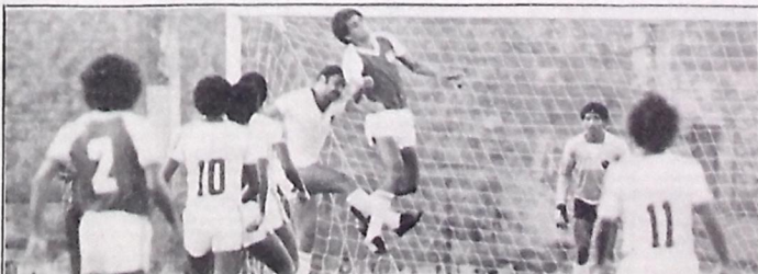
Botafogo ameaça romper novamente com a Federação e pode não disputar o campeonato