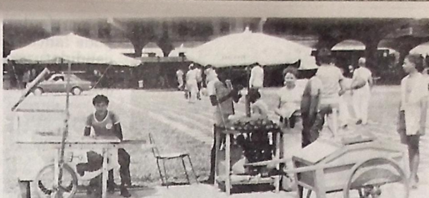
Os ambulantes não estão autorizados a utilizar o espaço do terminal rodoviário

A coordenadora das Inspeção Técnica de Ensino informa que os 374 candidatos inscritos deverão cartear de identidade, provas mudadas do cartão de inscrição e obter o certificado de habilitação, expedido pelo Centro de Educação do UFPB, com o registro permanente da Delegação Regional do Ministério da Educação e Cultura nesta capital.