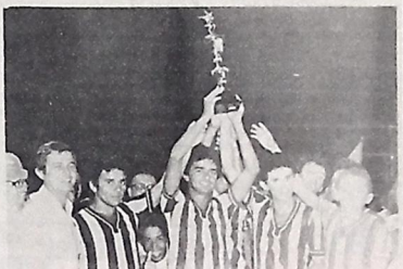
À noite, A UNIÃO vence o quadrangular