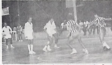
A União envolveu o adversário e meteu 6 a 2