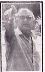
Os segurados reclamam