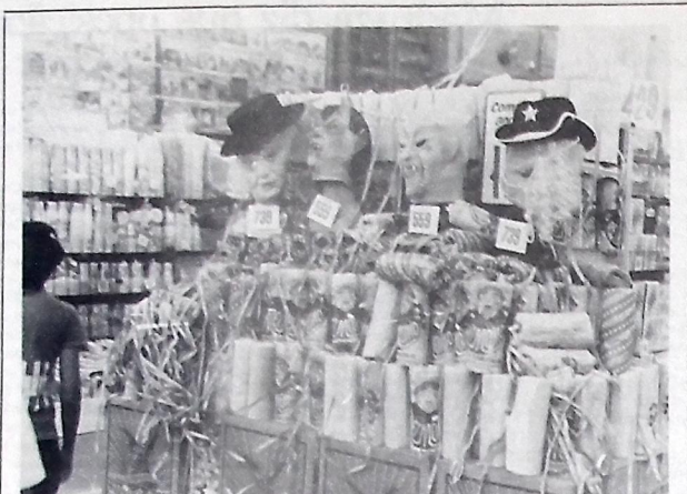
O comércio da cidade já está vendendo os artigos destinados ao carnaval

Todas essas agremiações já foram contempladas com a verba da Prefeitura, para a realização dos seus preparativos para o Carnaval de 82.