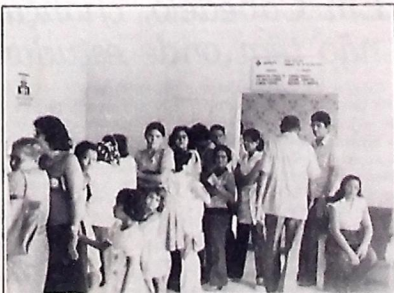
As grandes filas terminaram provocando tumultos

Apesar de iniciado o atendimento às primeiras horas da manhã, às 9 horas ainda era intensa a movimentação na unidade, com pessoas tentando a todo custo marcar uma consulta, estando os setores, inclusive, sem funcionários suficientes para o fornecimento das fichas.