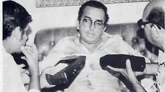
O governador foi entrevistado durante a inauguração do Balcão em Campina