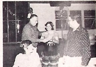
O Capitão dos Portos recebe homenagem

O Conselho Estadual de Educação autorizou, na semana passada, o funcionamento de colégios oficiais pertencentes aos municípios de Campina Grande, Conde e Belém de Calça. De acordo com a resolução publicada no Diário Oficial, receberam a devida autorização para o seu funcionamento as seguintes escolas: Colégio Municipal João da Cunha Vinagre, sediado no município de Conde; Educandário Nossa Senhora da Conceição, em Belém de Calça; e o colégio Fênice, em Campina Grande.