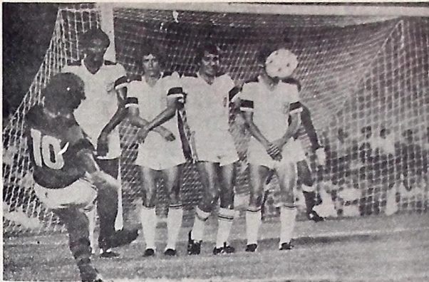
Treze joga sua sorte na Taça de Ouro, hoje à noite contra o Náutico

O Treze poderá conquistar a terceira vaga do Grupo C da Taça de Ouro, caso consiga empatar hoje à noite, no Aflitos, diante do Náutico. As duas equipes estão na terceira posição com 5 pontos ganhas, mas o representante paraibano leva vantagem no primeiro critério desempate que é o número de vitórias, pois tem duas contra uma do time pernambucoano.