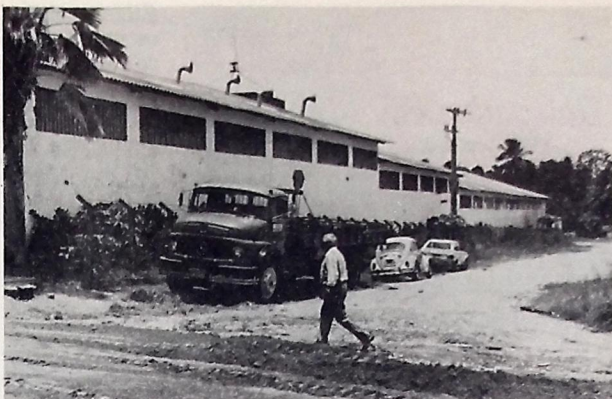
O controle da indústria ficará a cargo de uma cooperativa de trabalhadores têxteis

Rua Abdias Gomes de Almeida, 793 Tambauzinho