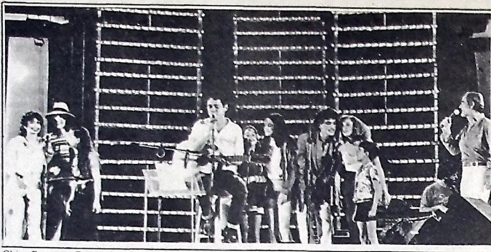
Chico Buarque, Renato Aragão e coro apresentando "Pruetas" para 100 mil pessoas em "Canta Brasil"

20 de fevereiro a 20 de março - Aspectos positivos ainda marcam o período astrológico do pisciano que se beneficia ainda mais da influência poderosa de Júpiter solar na proximidade de sua entrada em Peixes. Aspectos de ganhos e lucros, além de favorecimento em suas iniciativas ligadas a finanças e parentes mais próximos. Destaque para sua presença em família, hoje plenamente indicativa de realização e apreço. Saúde boa.