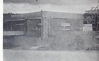
Obras de construção da agência da CEF