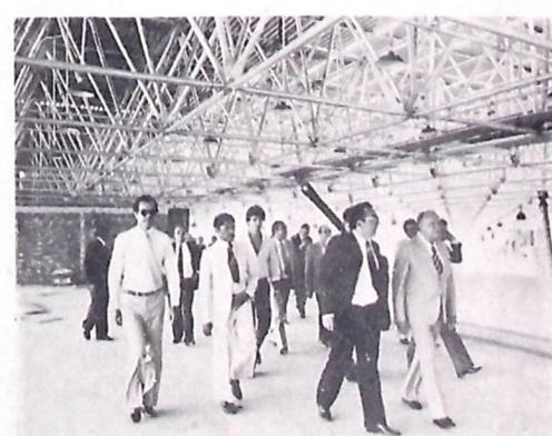
O governador mostrou o Espaço Cultural aos seus convidados