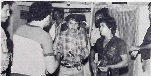
A operação da Secretaria de Segurança usa também o desarmamento na Capital