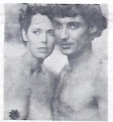
"O Leito Selvagem das Fêmeas"

PRISIONEIRO DA ILHA DO DIABO - A cores. 18 anos. No Rex, 14h30m, 16h30m, 18h30m e 20h30m.