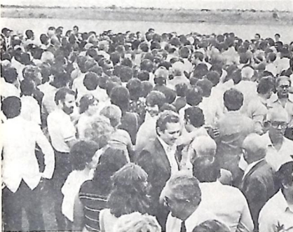
A multidão formou-se cedo para esperar os líderes