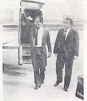
Na chegada, a saudação eufórica