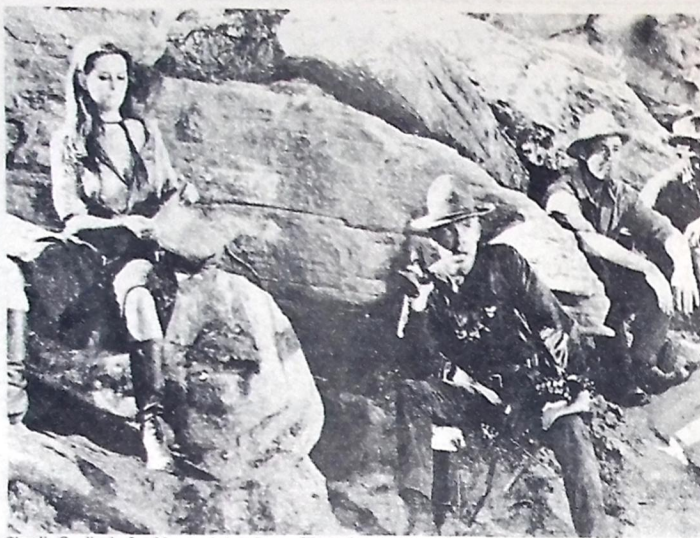
Claudia Cardinale, Lee Marvin, Robert Ryan e Woody Strode são os personagens em crise de "Os Profissionais"

20 de fevereiro a 20 de março - Hoje o peisciano deve tornar mais claros seus objetos, desejos e interesses, buscando assim solidificar um condicionamento astrológico altamente benéfico mas que depende essencialmente de seu comportamento para se materializar em resultados compensadores. Fase neutra para suas finanças. Bom entendimento pessoal e doméstico com acontecimentos de significação prática inevitável entre parentes e pessoas próximas.