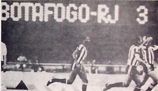
Botafogo carioca será adversário do Treze na 2ª fase da Taça