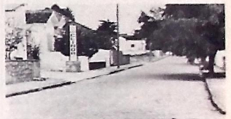
No centro, as ruas precisam de reparos