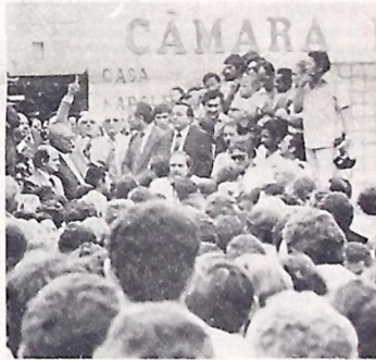
Na Câmara, o povo escuta os pronunciamentos