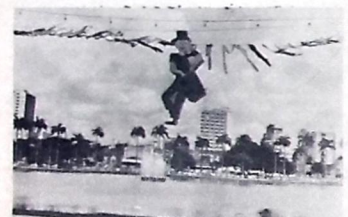
A decoração da lagoa ficou pronta ontem

Os foliões que participarão dos festejos carnavalescos no Parque Solon de Lucena estão reclamando a falta de um sanitário improvisado na área. Segundo eles, a Prefeitura Municipal poderia se preocupar com a questão, já que o desfile demora longas horas, necessitando que o público atenda as suas necessidades fisiológicas.