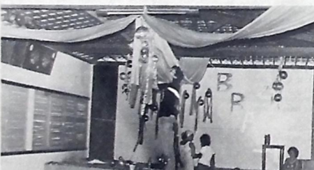
A decoração da AABE custou cerca de 200 mil cruzeiros