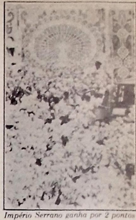
Império Serrano ganha por 2 pontos