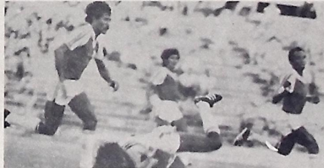
Auto Esporte apronta hoje para o jogo com o Santos na Graça