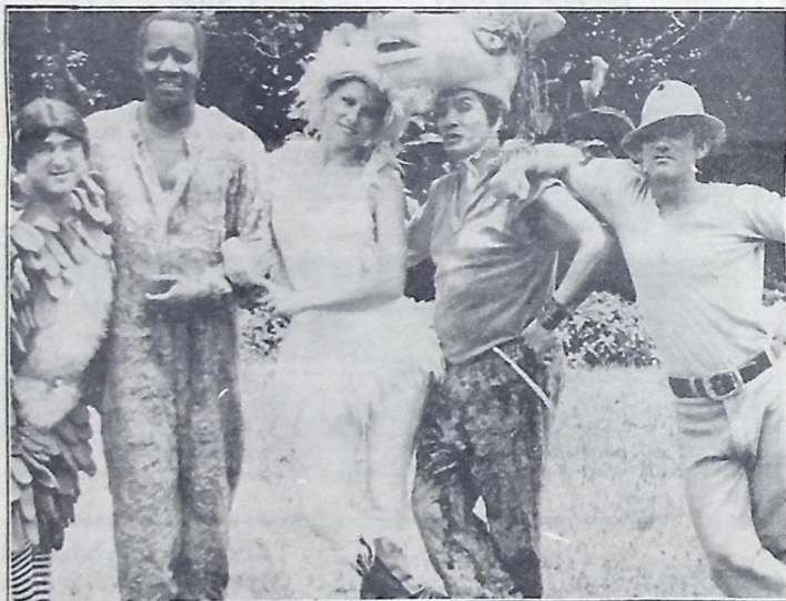
O elenco de Os Saltimbancos Trapalhães, em exibição no Plaza com grande sucesso de público

Ringo viveu os dois últimos anos na Califórnia, até que recentemente decidiu retornar a Grã-Bretanha com sua mulher, Barbara Bach.