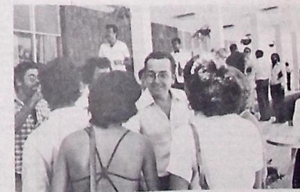
Burity: as críticas fundamentadas não constroem

O secretário de Comunicação Social do Governo, Gonzaga Rodrigues, por sua vez, disse, a propósito de uma indagação que lhe foi feita certa vez, que se antes, este e contra o Governo e a favor dos camponeses, e hoje está a favor do Governo, é porque o atual Governo não está contra os posseiros, ao contrário do que ocorria há alguns anos. (Página 12)