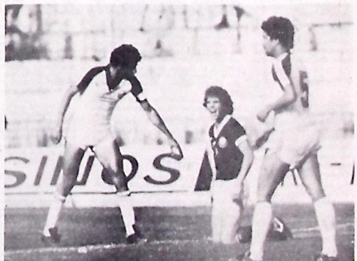
Futebol paulista em crise com a bagunça das eleições na FPF

— Sem nenhum exagero - diz ele - poder-se-ia dizer que havia risco de vida a todos os presentes, mesmo porque ameaças de morte eram feitas com constância. No local, protegido por forte policiamento, constatei, pessoalmente, que meu despacho estava sendo desobedecido. Sem hesitar suspendi os trabalhos e recolhi o material presente. Meu estado emocional é a indescrevível confusão reinante não me permitir, descair (sábado). Por isso fiz com maior serenidade".