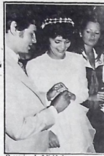
O sorriso de felicidade, no momento em que ambos se consideraram casados