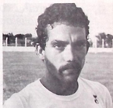
Fortaleza leva Nelson em definitivo

A propósito ainda do caso Normando, que envolveu Botafogo e o Barún de Mossoró, no qual, o tricolor perdeu o atleta para o time do Rio Grande do Norte, o jogador deverá permanecer mesmo no Barún, que nada pagará ao Botafogo. Segundo revelaram, o clube de Mossoró convidou o tricolor para atuar amistosamente na sua cidade, com a renda revertida em seu favor, mas os botafoguenses não aceitaram a proposta e acabaram perdendo o atleta.