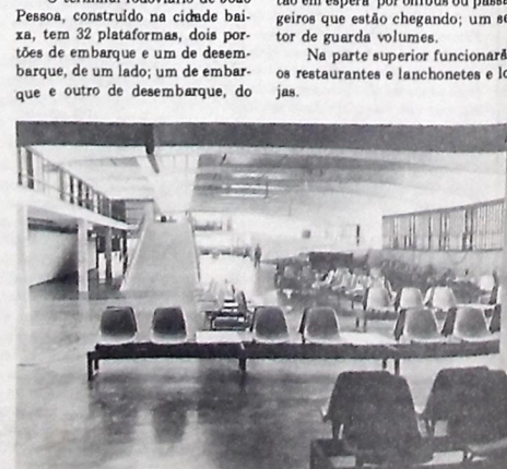
Rodoviária terá 12 bebedouros e 12 orlões internos