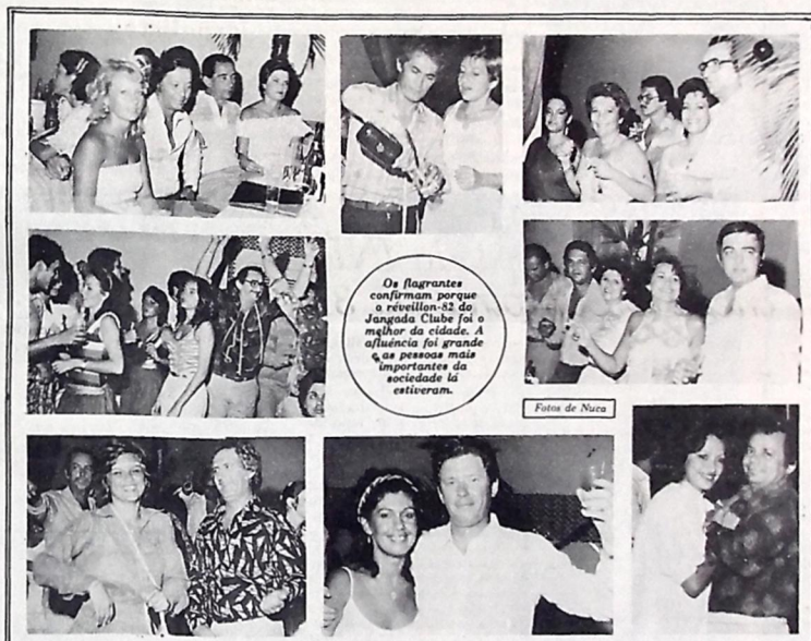
Os flagrantes confirmam porque o reவில்-32 do Jangada Clube foi o melhor da cidade. A afilância foi grande e as pessoas mais importantes da sociedade lá estiveram.

• Esse importante certame vai envolver geógrafos e cientistas sociais de todo o mundo, com a América Latina em posição de destaque.