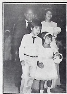
A entrada na igreja, levada pelo seu pai