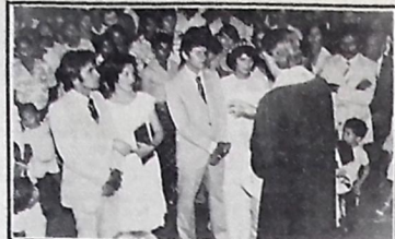
A cerimônia, realizada na matriz de Nossa Senhora do Bom Conselho, foi das mais concorridas