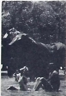
"Tarzan, o Filho da Selva"

*** A história de uma cantora de música caipira narrada com sobriedade e ilustrada com belas canções. Outros os desempenhos de Spacek e Levon Helm.