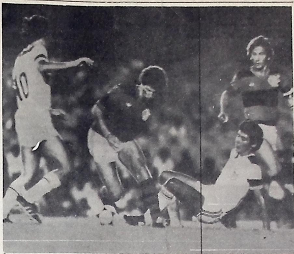
A defesa do Treze não suportou a carga do ataque do Flamengo ontem