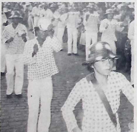
Escolas de samba guarabirenses receberam ajuda