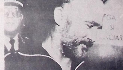
Comandos policiais resgataram o general americano

O general estava amarrado e amordaçado numa tenda de campanha armada num cômodo de um apartamento no bairro estudantil de Pádua.