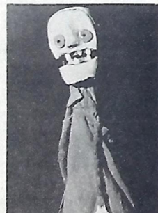
A "Alma da Defunta Sem Vergonha", mamulengo, do Carroça

VII MOSTRA DE TEATRO AMADOR - A noite começa com Estórias da Terra dos Mamulengos , pelo Grupo Carroça de Mamulengos, que há três anos percore o Nordeste convidando com mestres populares, buscando "massas raias culturais autênticas". O espetáculo é feito a base do improviso com o público, que tem uma participação direta e atuante em seu decorrer. Logo depois, a peça Sátira do Sistema , de Roldan, pelo Atelier de Arte de João Pessoa. Ingressos ao preço de Cr$ 100,00, com abatimento de 50% para amadores que apresentarem carteira. No Teatro Santa Rôza. 20h00m.