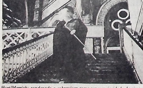
Hurt/Merrick: condenado a sobreviver como uma curiosidade de circo