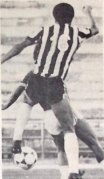
O Galo chega hoje e libera os seus atletas

Hoje, Pimentel realiza um coletivo apronto, no Sílvio Porto, ocasião em que será definida a equipe que vai enfrentar o Santos. Amanhã, os jogadores participarão de um treino recreativo e logo em seguida serão concentrados para a partida de domingo.