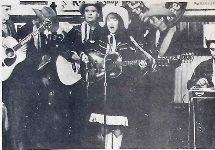
Sissy Spacek como a cantora Loretta Lynn em "O Destino Mudou sua Vida", cartaz do Cinema Tambau

20 de fevereiro a 20 de março. - Hoje serão tomadas decisões de grande significado para as atividades profissionais do peixiano. Na primeira metade do dia você conta com aspectos benéficos para negócios com pessoas e indústrias. Uma visita de parente distante se revelar bastante oportuna. Seja mais cordato e prestativo nas solicitações domésticas. Novas conquistas no plano amoroso. Motive-se com ternura e carinho. Saúde boa.