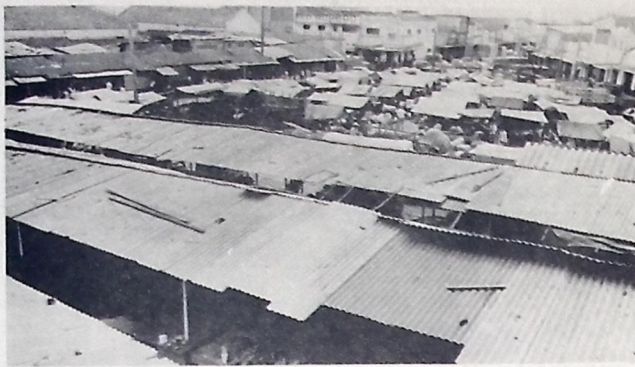
O projeto de reformas do mercado central já está em fase de conclusão

A confortadora presença é motivo de gratidão da família e um ato cristão para Deus.