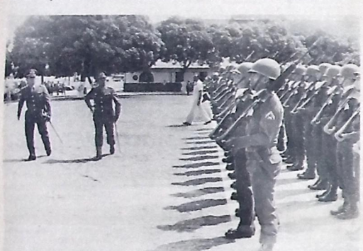
Durante a solenidade, a tropa foi passada em revista