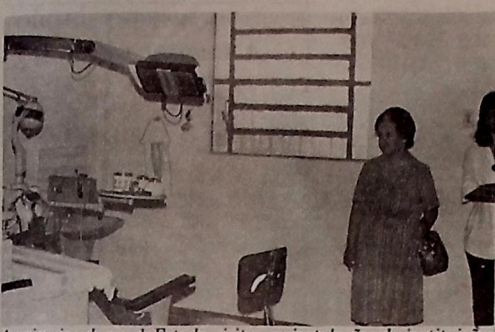
A primeira dama do Estado visitou as instalações de instituições