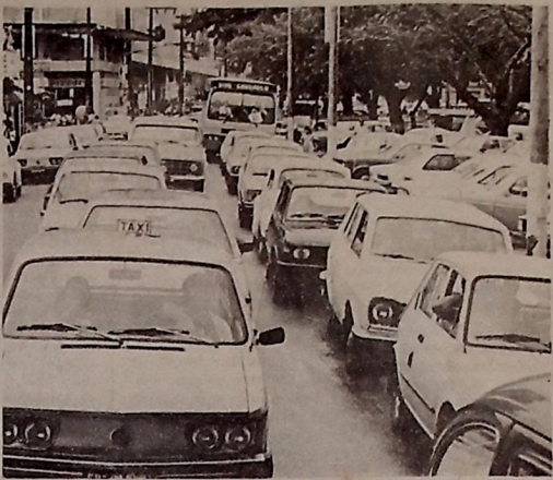
O trânsito ficou engarrafado por causa da Festa das Neves

Devido a interdição do trecho da Festa das Neves, na rua General Osório e nas imediações do Colégio Pio XII, o trânsito, no centro da cidade, ficou totalmente congestionado, ontem à tarde, principalmente nas ruas: Visconde de Pelotas, Barão do Aibahy, e Parque Solon de Lucena. Em consequência do congestionamento, ocorreram várias colisões, e as insistentes buzinas dos motoristas revelaram o quanto as pessoas ficaram irritadas. A situação se complicou ainda mais para os veículos que vinham da oita marítima, pela Getúlio Vargas, pois, estando o Parque Solon de Lucena, na rua da Mesbla, com o trânsito totalmente engarrafado, não era possível, o acesso a rua Miguel Couto. A falta de policiais de trânsito dificultou ainda mais a situação nas ruas.