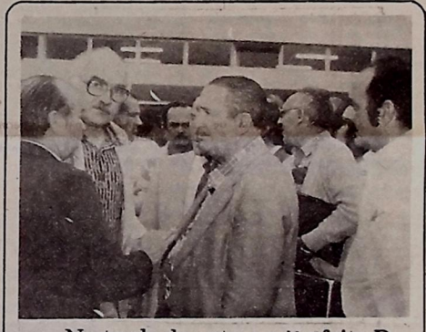
Na tarde de ontem o Prefeito Damásio Franca compareceu ao Aeroporto "Castro Pinto" acompanhado de todo o seu secretariado, e funcionários do município, oportunidade em que recebeu o Governador Clóvis Bezerra, e o futuro Governador, deputado Federal Wilson Braga, por ocasião da chegada de ambos procedentes de Brasília, onde foram tratar de assuntos ligados ao interesse do Estado.

Há vários anos que os dirigentes da Federação dos Trabalhadores nas Indústrias do Estado da Paraíba e do Sindicato da categoria vêm lutando para que a pesca da baleia não fosse acabada na Paraíba.