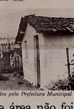
Os terrenos foram doados pela Prefeitura Municipal

O início das aulas para o período letivo 82.2 será no dia 10 de agosto, sendo o dia 1º de outubro, último prazo para o trancamento de matrícula. Segundo o calendário escolar, os jogos universitários serão no período de 9 a 16 de outubro. O encerramento das aulas está previsto para o dia 7 de dezembro, enquanto que o início dos exames finais será no dia 9 e seu último no dia 15 de agosto, assim, encerrado o período letivo da Universidade Federal da Paraíba.