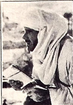
"Os Caçadores da Arca Perdida"