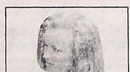
Honor Blackman em "Goldfinger"