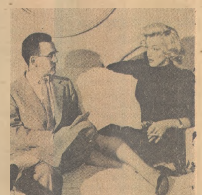
Correspondente da UPI em Hollywood, Vernon Scott, entrevistou as "estrelas" durante 30 anos. Aqui, com Marilyn Monroe, em 1953

A UPI (United Press International) inaugura hoje, no Rio de Janeiro, a exposição fotográfica comemorativa de seus 75 anos de existência. A mostra,