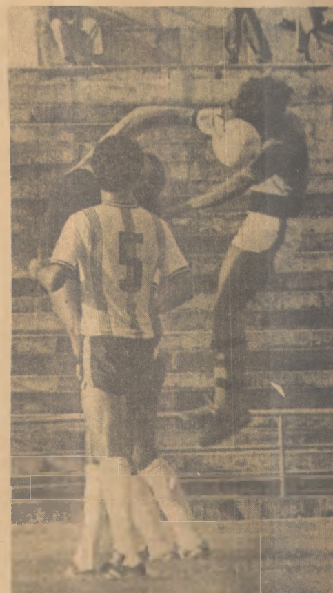
Campinense, garra e dedicação

O Campinense, por sua vez, contando com uma equipe cuja base é a mesma do ano passado, aproveitando jogadores das divisões inferiores, vem realizando uma boa campanha e se constitui como o favorito à conquista do turno, sobretudo pela garra e dedicação que seus jogadores têm demonstrado a cada jogo. O clássico promete ser dos mais movimentados.