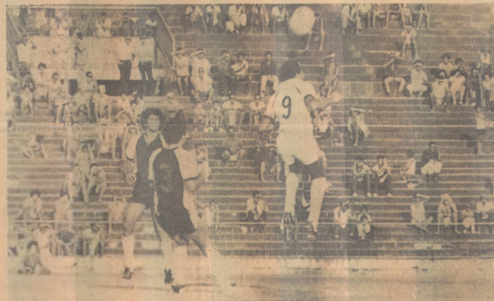
Botafogo se prepara para o clássico domingo, diante do Auto