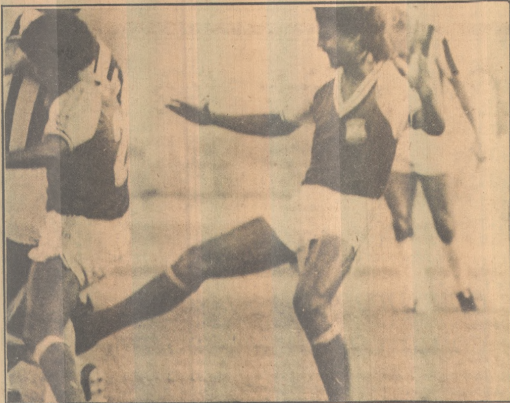
Somente a vitória interessa ao Auto, hoje contra o Esporte

Grupo A - Peru, Indonésia, Canadá e Nigéria (Lima); Grupo B - Argentina, Cuba, Holanda e Hungria (Trujillo); Grupo C - México, Bulgária, Japão e Espanha (Tacna); Grupo D - Chile, Alemanha Oriental, União Soviética e Austrália (Ica); Grupo E - Brasil, Alemanha Ocidental, Coréia do Sul e Paraguai (Arequipa) e Grupo F - Estados Unidos, Itália, República Dominicana e China (Chiclayo).