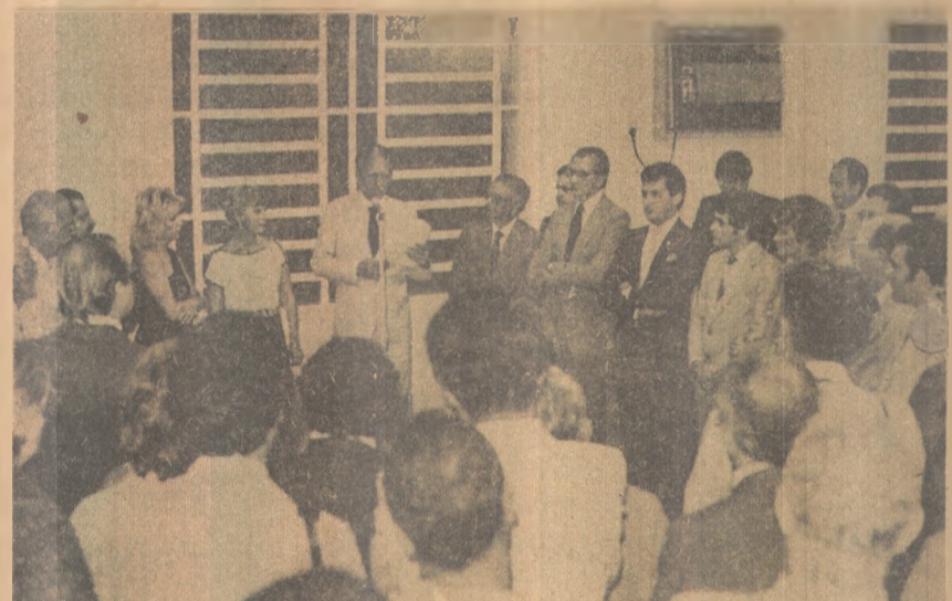
Vilhena anunciou mais 9 agências do banco na Paraíba

Durante seu pronunciamento na Sudene afirmou que, em 1981, a Paraíba colheu apenas 19% da quantidade de milho colhida em 78; 40% do feijão; 43% do algodão arbóreo; 48% da batata inglesa e 49% do algodão herbáceo. Pediu então para que fosse minorada a situação dramática de centenas de milhares de pessoas desempregadas no campo, além do que o custeio agrícola manteria o nível das atividades econômicas urbanas e trazer novo alento para as finanças estaduais.