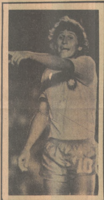
Zico na ponta direita

— Acho que todos nós temos que nos sacrificar em prol do que for o melhor para o Brasil. Aceito até mesmo jogar na ponta direita caso seja necessário. Também concordo que o nosso time se movimentou bem mais depois que passei