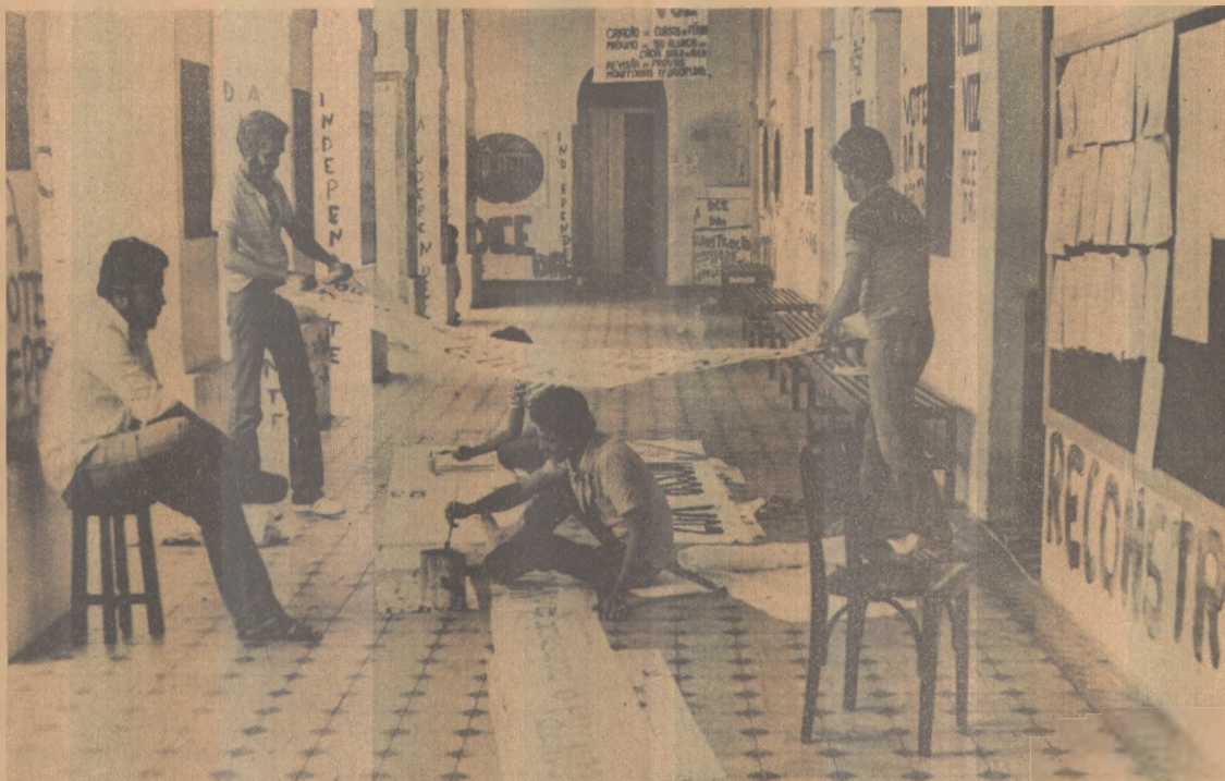
Três chapas concorreram às eleições do DCE que se realizaram ontem

• Em Moscou, os donos de cães têm que pagar um imposto anual equivalente a 21 dólares, segundo recente decreto governamental, para que tenham direito a criar os animais. As autoridades pretendem agora maior rigidez, criando um imposto proporcional ao tamanho do animal. Querem desalentar os moscovitas a ter cachorros em casa.