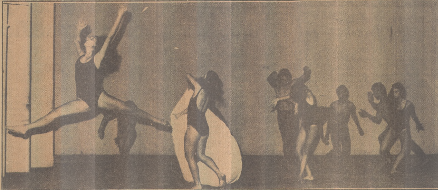
Toda a atmosfera da obra de Garcia Lorca está no espetáculo de Balet-teatro "Verde que te Quero Verde", às 21 horas de hoje, no Santa Rosa

Como única ressalva, o fato de o livro ser por demais restrito ao universo do Rio de Janeiro, o que, se por um lado possibilita um apanhado mais específico e concreto da realidade, importante para uma reportagem, limita o seu alcance, no que toca aos exemplos, enquanto ensaio que também é. Um lapso irrelevante, no entanto, frente à profundidade da discussão empreendida, que, longe de se esgotar na problemática homossexual, enfoca importantes questões a respeito dos mecanismos psicológicos e sociais do ser humano, de uma forma geral. A propósito, o título do livro - Descansa em Paz, Oscar Wilde, - como explica o autor, se deve à necessidade dos que, admitindo (quase sempre inconscientemente) o sentimento da própria inferioridade, precisam "justificar a própria condição apontando figuras famosas".