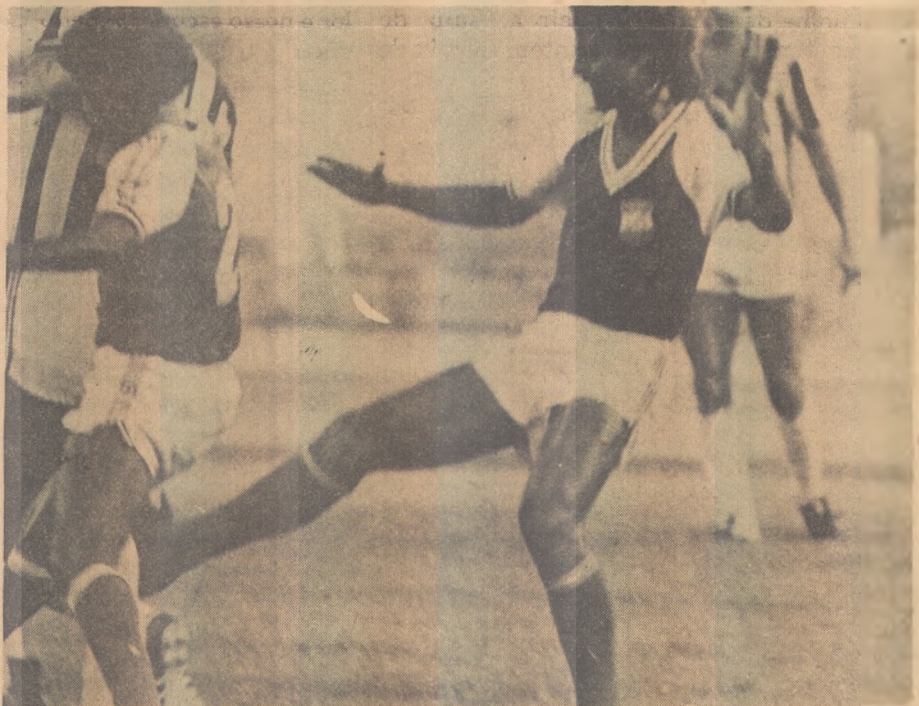
Somente a vitória interessa ao Auto Esporte