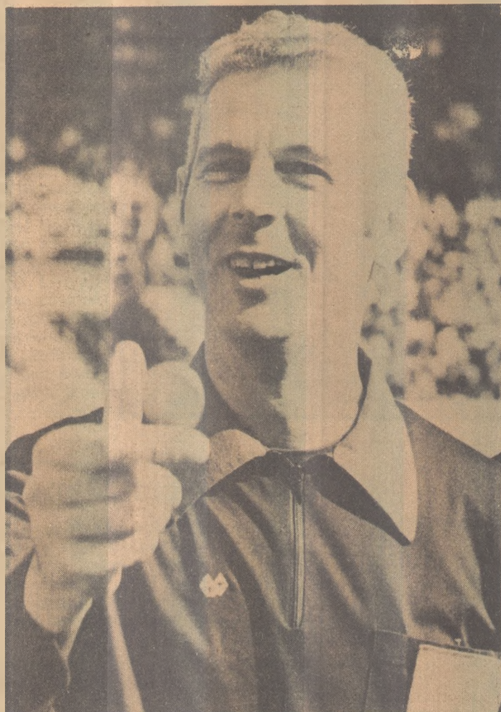
Eschweiler apita Argentina e Bélgica

A Espanha apresentará somente suas cores tradicionais: vermelha, azul e preta, enquanto a Alemanha vestirá branco, preto e branco. A Áustria terá uniformes branco, preto e branco e, Camarões verde, vermelho e amarelo.