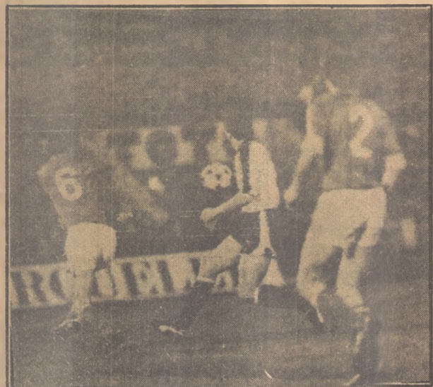
Hungria não esteve bem nos amistosos