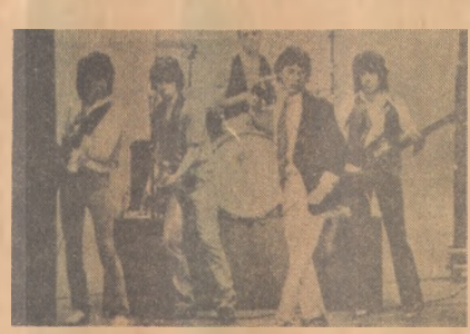
Depois de uma gigantesca excursão pelos Estados Unidos, os Rolling Stones começaram, no dia 27 de maio, pela Dinamarca, grandes

apresentações na Europa, que incluem dois shows na Espanha na época das finais da Copa do Mundo. Hoje os Stones estarão cantando e tocando, tendo à frente Mick Jagger, em Rotterdam, na Holanda.