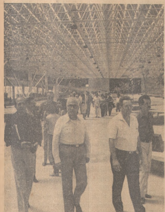
Adesguianos conheceram toda a obra

Foram informados, por exemplo, de que os alunos de escolas públicas não pagarão entrada para visitar o planetário doado pelo MEC ao Espaço Cultural. Os visitantes comuns pagarão uma taxa simbólica.