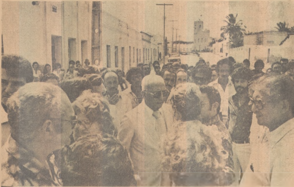
Clóvis foi a Cabaceiras participar da assinatura do convênio

Além da assinatura dos contratos para custeio agrícola e aquisição de bombas, o governador Clóvis Bezerra visitou em Cabaceiras escolas municipais e estaduais e prometeu enviar recursos para melhoria dos ambientes educacionais daquele município. O deputado Everaldo Gonçalves, que acompanhou o chefe do Executivo, solicitou para a região a construção de armazéns para abrigo de sementes e do alho, e chamou a atenção do governador para a eletrificação da cidade. (Página 12).