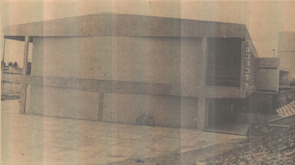
Fachada lateral do Cinema 1, inaugurado anteontem