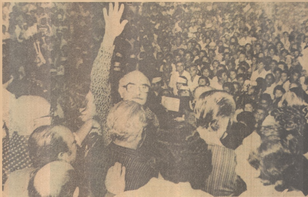
Ao lado do povo, Wilson Braga pretende fazer um bom Governo

Não creio que elas venham a nos causar qualquer prejuízo, pois o seu trabalho coincide com a nossa luta nos bairros e nas comunidades periféricas, no sentido de conscientização dessas populações sobre os seus problemas e as formas de reivindicação. Introduzimos na Paraíba, e particularmente em João Pessoa, uma organização popular onde o povo debate e participa de nossos programas e de nossas ações. Antes de qualquer decisão promovemos a consulta às bases populares,