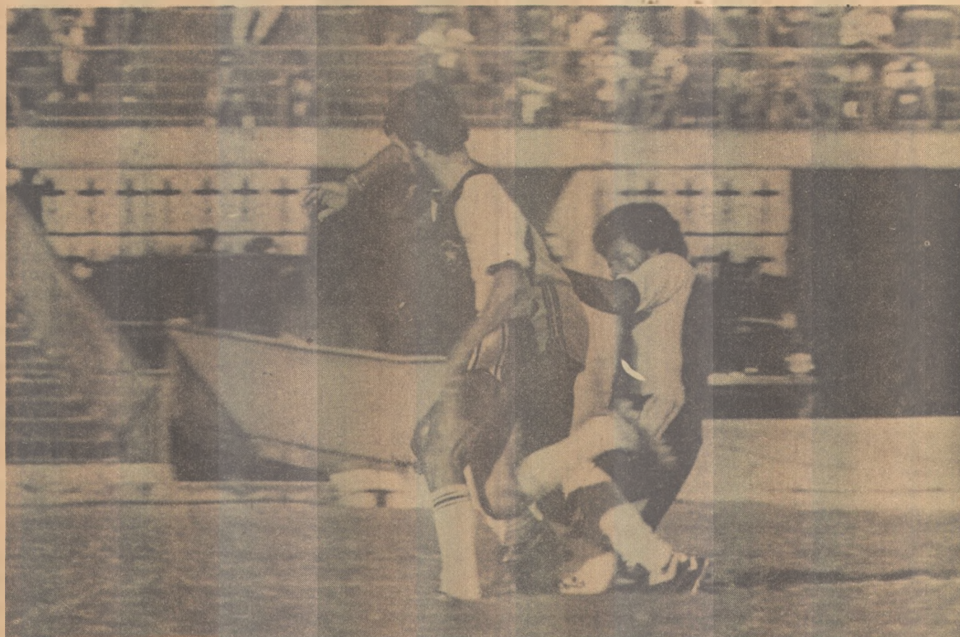
Apenas o empate amanhã, com o Auto, classificará a equipe do Botafogo