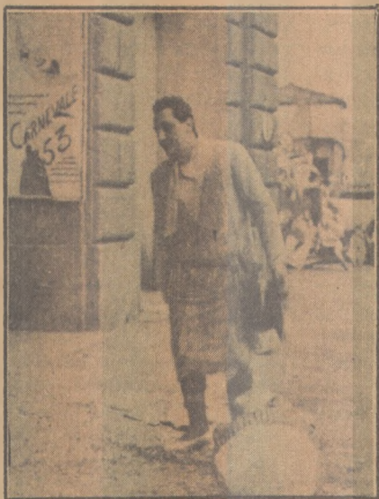
Alberto Sordi: "Os Boas-Vidas"