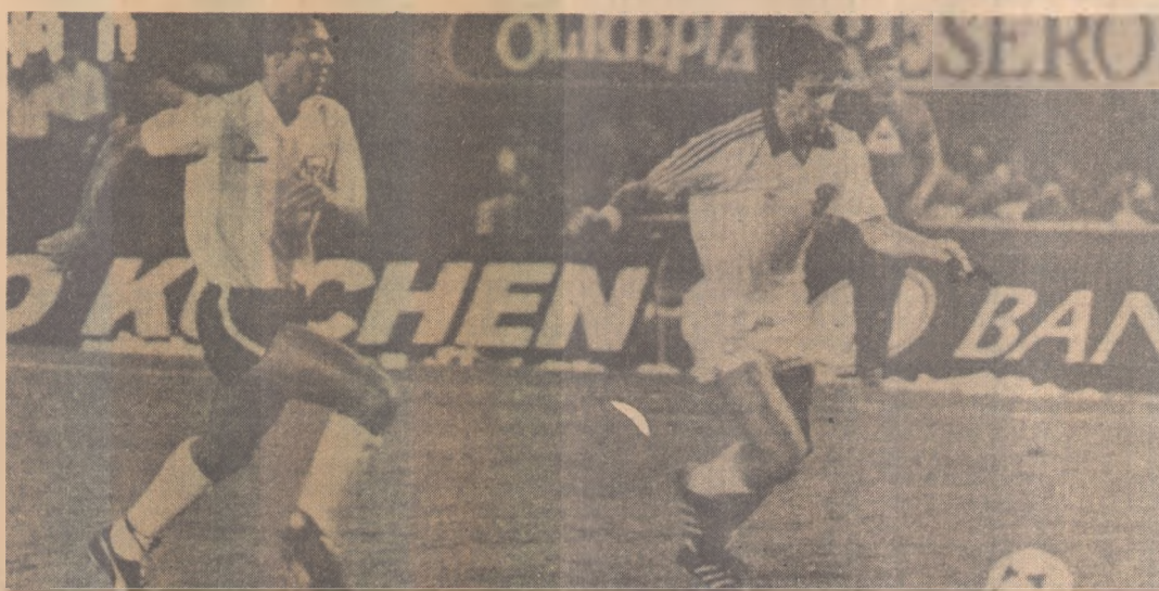
Seleção Argentina está pronta para estréia na Copa do Mundo

Valência tem uma lesão no tendão de aquiles do pé direito e Baley luxação no dedo da mão direita. Quando a Maradona, está se recuperando rapidamente e indica que não será problema para o jogo inaugural, sobretudo que ainda falta: uma semana.