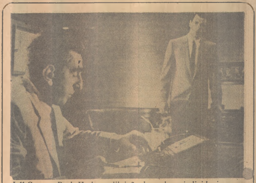
Jeff Corey e Rock Hudson: diluição dos valores individuais

O jornal Sueddeutsche Zeitung comentou em obituario: "O que ele fazia, fazia sempre 150 por cento. Trabalhando, amando, vivendo. E isto não era possível todo o tempo sem coisas que o estimulassem, o que ampliava o círculo vicioso. Ele não ligava. Trabalhava como um possessor".