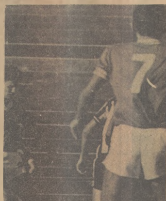
Naça defende sua vaga

O Nacional não começou bem o Campeonato, perdendo jogos inexpressivos, mais se recuperou em tempo e foi superando os