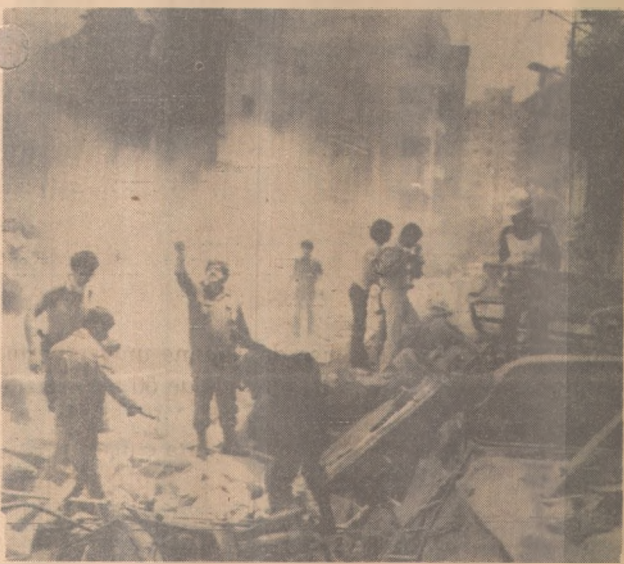
Em Beirute, equipes procuram os mortos

Segundo os palestinos, alguns grupos de esquerda que há somente algumas semanas lutavam contra os palestinos, estão agora combatendo como loucos ao seu lado, depois de uma hesitação inicial". Apesar de ter sofrido baixas consideráveis, o seu exército inflingiu perdas inesperadamente altas às tropas israelenses, acreditam os palestinos.