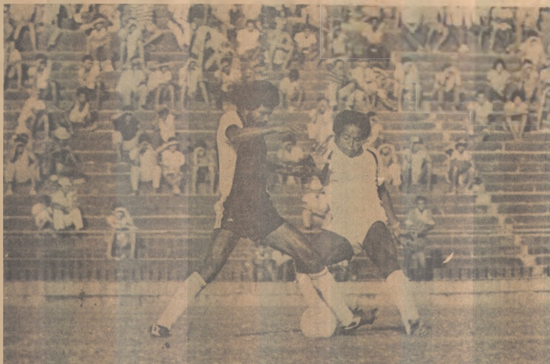
O Botafogo já tem dois reforços garantidos para o quadrangular