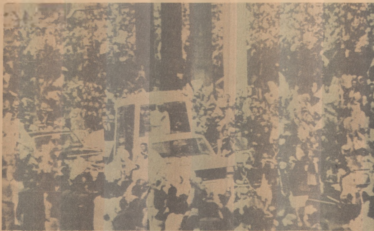
Uma multidão em Buenos Aires cumprimenta o Papa a caminho da Catedral

Perto do local onde o helicóptero presidencial decolou para levar Reagan de volta a Bonn, cerca de 400 manifestantes queimaram um boneco que o representava. A violência começou em Nollendorf Platz, no centro do setor americano, e se espalhou para as ruas e prédios ocupados. As vitrines das lojas em toda essa área foram quebradas e pelo menos 11 carros, incluindo um da polícia, incendiados. Na rua Winterfeld, uma barricada estava em chamas.