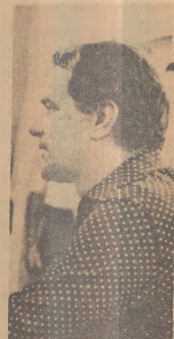
Telê define a ponta

— Estou acostumado com a luta e sou um jogador experimentado. Acho que cumpri as instruções do treinador e o esquema que pretende vem sendo conseguido. Agora e esperar até hoje e ver o que ele decide.