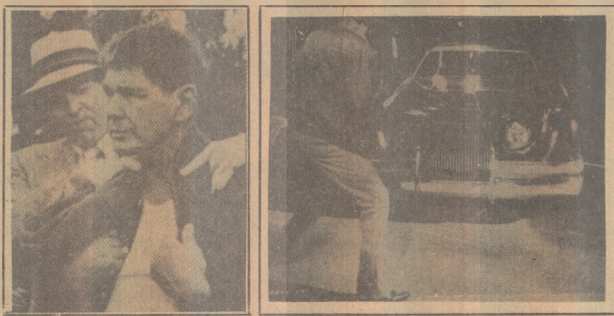
Os filmes na Globo: "Lutador de Rua" e "O Carro"