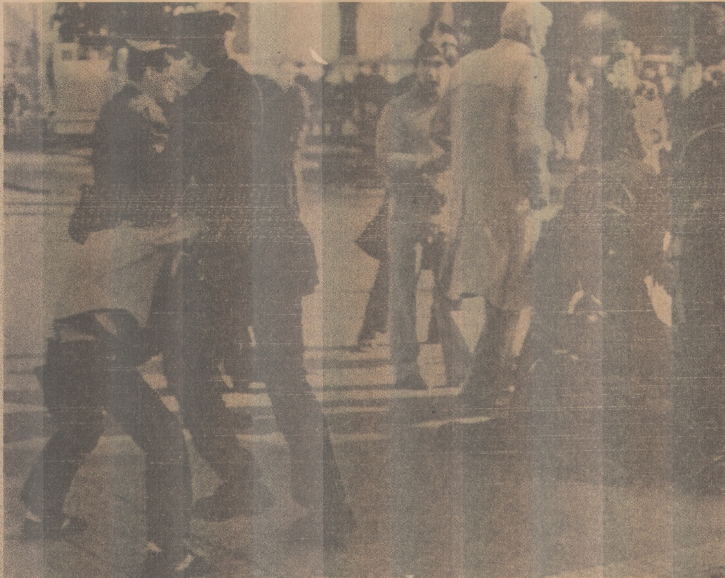
A polícia dispersou os manifestantes que protestavam contra a rendição com cassetetes e gás

Apesar das recomendações médicas para que mantenha repouso, o Sumo Pontífice, de 62 anos, pronunciou 12 discursos em igual número de horas passadas em solo suíço. Durante as suas atividades em Genebra, o Papa pediu o fim da tortura e reuniu-se com um representante da Organização Para a Libertação da Palestina. - (Página 7).