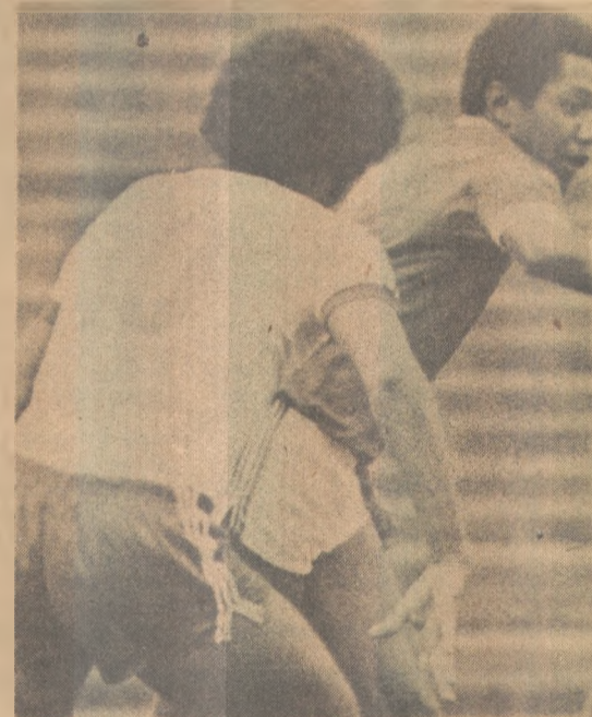
O Auto promete realizar modificação

O Colégio Lyceu Paraibano foi escolhido para ser a Cen-