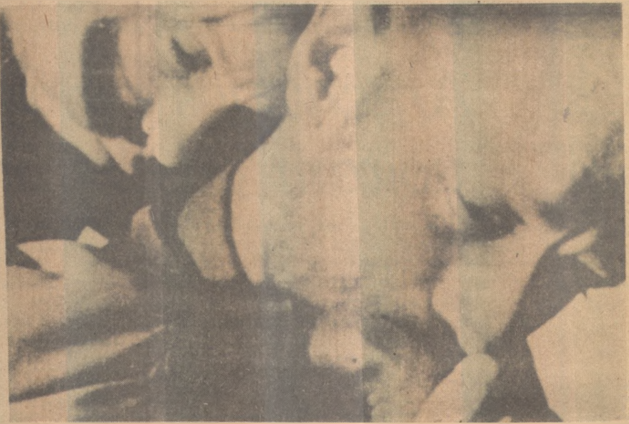
Bibi Anderson e Max von Sydow: "A Paixão de Ana", no Canal 10

21 de maio a 20 de junho - Trabalho: Esta quarta-feira marca a alteração, para pior, da influência astrológica sobre esta casa do gêmeiano. Resguardar-se diante de possí-