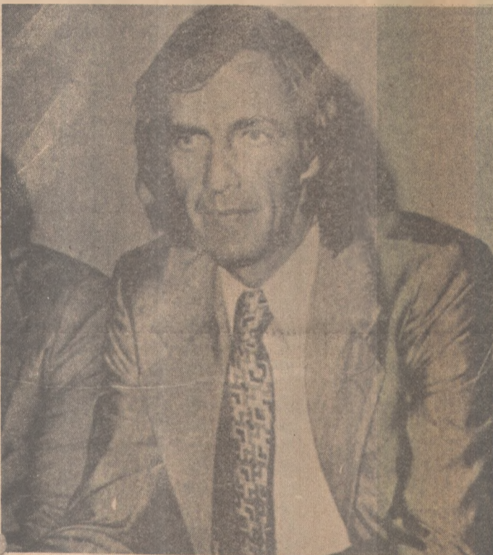
César Menotti está muito preocupado

- Eles marcam muito bem, que marcação firme, só mesmo se mechendo muito que a gente consegue enganar os russos. Engraçado é que não é marcação homem a homem. É por zona, mas que tipo de marcação difícil. Felizmente conseguimos fazer gols de fora da área porque lá dentro ia ser difícil. No primeiro tempo não fui muito lançado e no segundo a defesa e o goleiro cortavam todos os centros. Tinha que ser de longe mesmo.