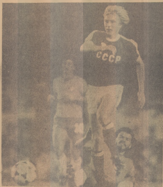
Contra a Rússia, Zico não esteve bem

Ô curioso é que até alguns jogadores soviéticos relutaram em trocar de camisas com os brasileiros, tão irritados que estavam com o resultado da partida. Foi uma reação incomum dos jogadores que ficaram revoltados com a arbitragem mas concordam em trocar suas camisas após as partidas num sinal de coleguismo entre eles, mostrando que tudo tinha acabado no apito final do árbitro. No entanto, talvez por sentirem escapar uma vitória importante e que parecia tão concreta, os russos simplesmente se desesperaram.