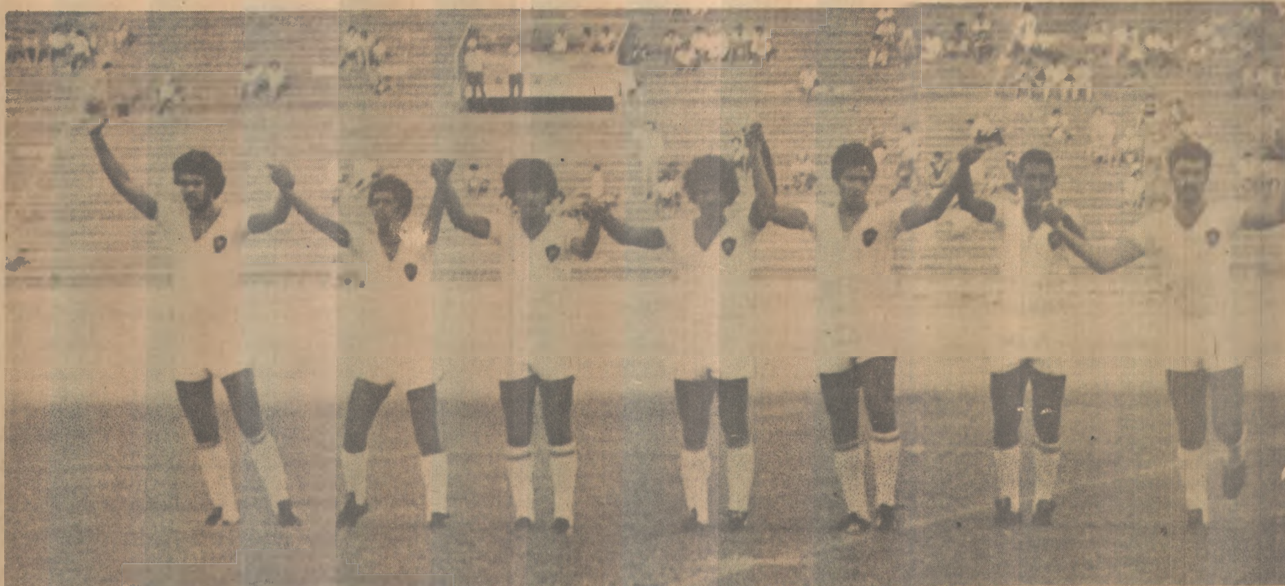
O Botafogo há dois anos não consegue um bom time. Por cima, está com sua vaga ameaçada. O Naça precisa marcar oito gols

Aquele era o momento que o torcedor brasileiro estava esperando. Ali, ele já esquecera que o nosso meio campo, formado por Falcão, Sócrates, Zico e Dirceu (no primeiro tempo) fora muito "camarada" com os russos, e em nenhum momento, apertara a marcação como fizeram os nossos oponentes. Ele já não se lembrava de que as jogadas sobre a área, para as cabeçadas de Serginho, resultaram infrutíferas. Para a nossa torcida só interessava a vitória por 2 x 1, o bom que a seleção fizera, passando a comemorar como se a própria conquista do Mundial tivesse acontecido.