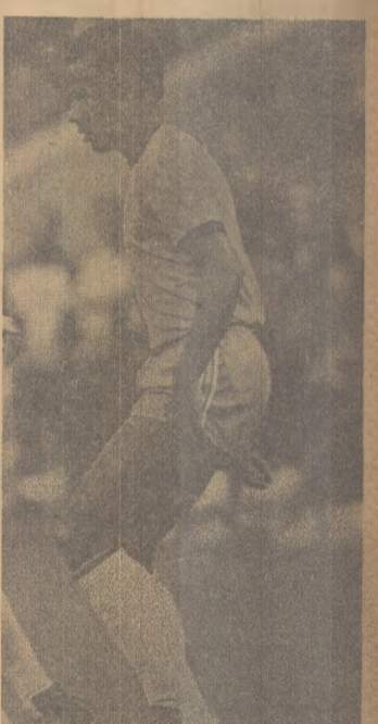
Luisinho nega penaltis

- O Isidoro esteve bem e deu equilíbrio ao setor direito.