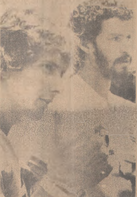
Eder e Sócrates

A Rede Globo de TV transmitirá os seguintes jogos hoje: 12h00m, Inglaterra x França (ao vivo); 16h00m, Espanha x Honduras (ao vivo); 23h00m, Alemanha x Argélia (compacto). - (Esportes, págs. 10 e 11).