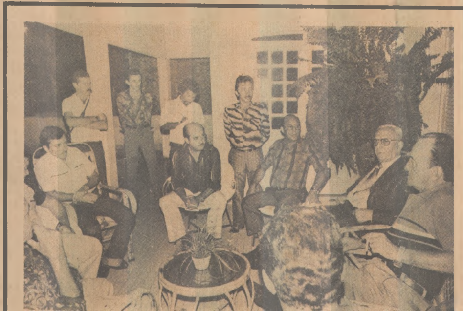
O governador anunciou que a Convenção estadual será dia 26

Telegrama urgente a ministros denuncia a situação no Nordeste