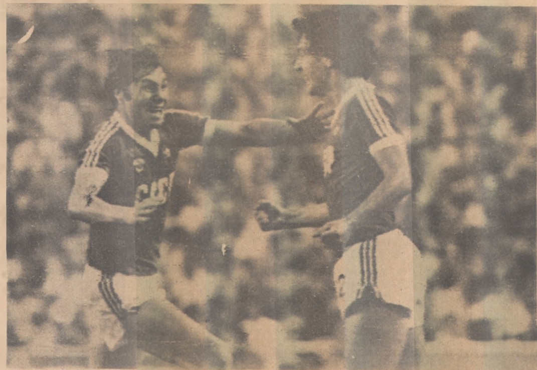
União Soviética chega à Barcelona para jogar com os belgas

Sábado a URSS enfrenta a Polónia no Nou Camp, numa partida que poderá ter um clima bastante político. Já ontem, em torno do estádio do Barcelona, ativistas poloneses vendiam escudos com o símbolo do Sindicato Solidariedade e havia cartazes e faixas.