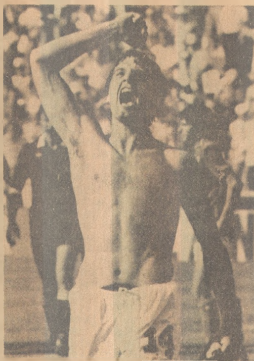
Alemanha e Inglaterra, um jogo sem gols; a euforia do italiano Tardelli ao vencer a Argentina

O técnico Telê Santana disse ontem que a Argentina será um rival ainda mais perigoso depois de sua derrota frente à Itália. "Agora os argentinos virão com tudo contra nós, porque só uma boa vitória permitirá que se classifiquem", disse Telê no Estádio Sarría, depois de assistir a vitória da Itália por 2 a 1.