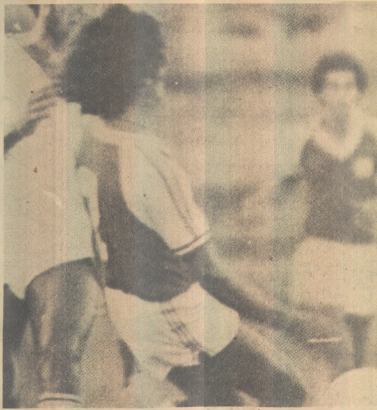
Alvi-rubro inaugura sua sede domingo