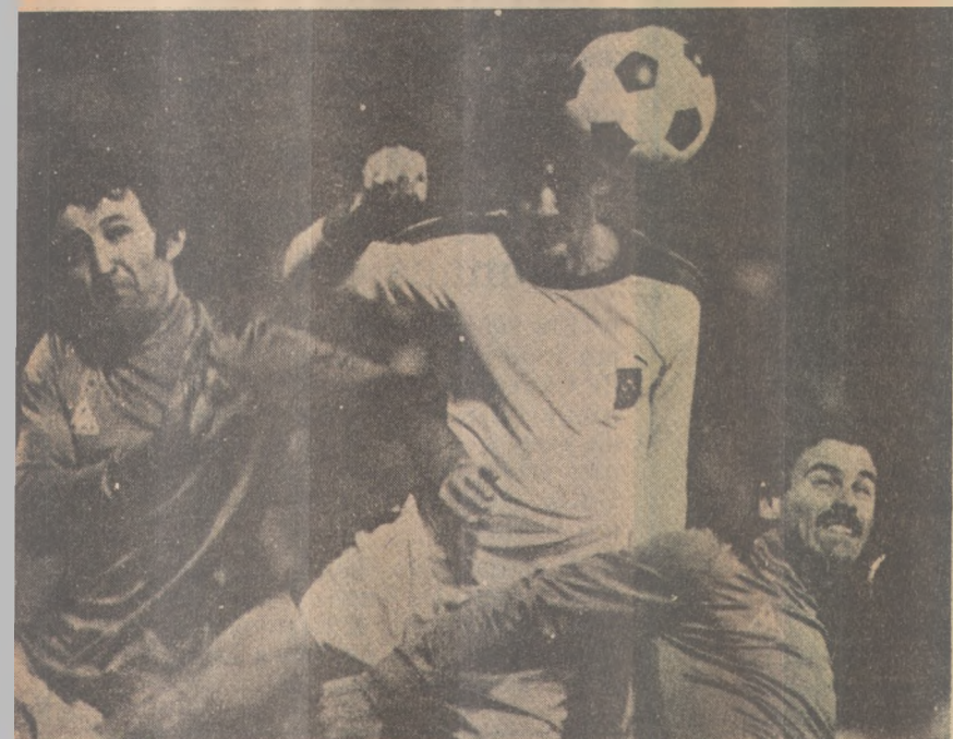
Espanhóis se preparam para a disputa da Copa do Mundo

O treinador Derwall ficou entusiasmado com a atuação desses novos jogadores e acredita que a Alemanha terá tudo para fazer uma boa campanha no Campeonato Mundial e lutar pelo título em condições de igualdade com Brasil, Argentina, União Soviética e Espanha, os principais favoritos à Copa do Mundo.