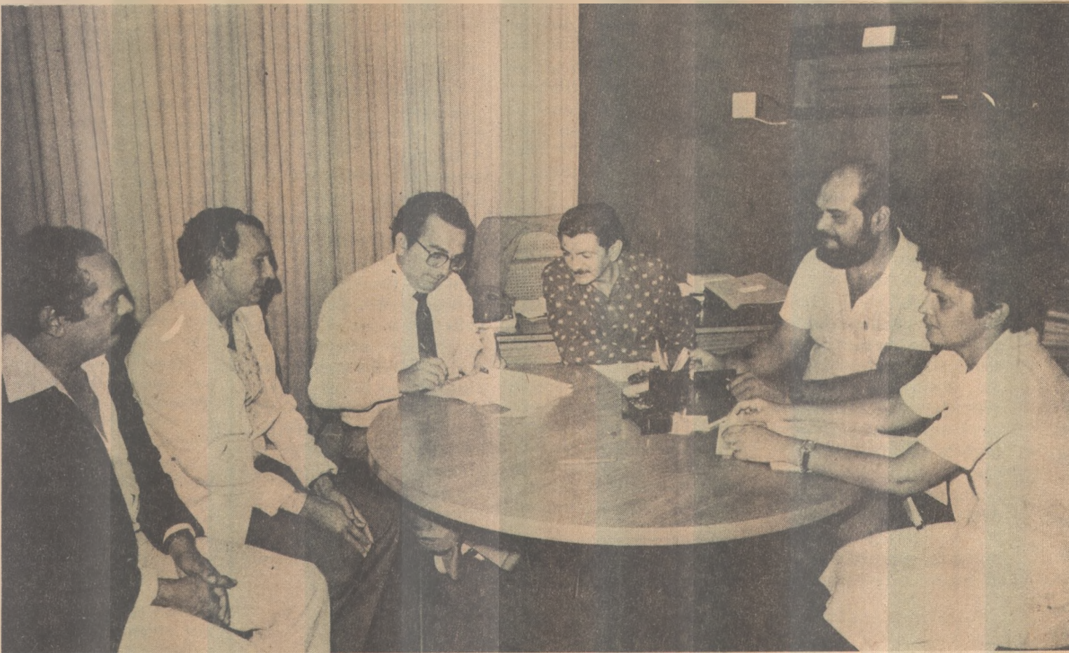
Vários secretários prestigiaram a assinatura da mensagem que cria o quadro especial de Divulgação

Foram 766 os apostadores que conseguiram fazer os 13 pontos no Teste 597 da Loteria Esportiva, cabendo para cada um o líquido de Cr$ 434.188,00. Na Paraíba, os ganhadores foram dois. Toda a renda líquida do Teste 597 foi destinada ao COB (Comitê Olímpico Brasileiro) num total de Cr$ 398.050.004,23, com ajuda da Loteria Esportiva ao esporte amador brasileiro. (Esportes, págs. 10 e 11)