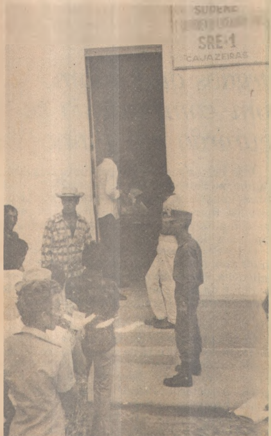
Portando suas carteiras de identidade fornecidas pela Emergência do 1ºGpt E, os trabalhadores, organizados em fila, recebem os seus salários. (Foto Bósco/Cajazeiras-PB).