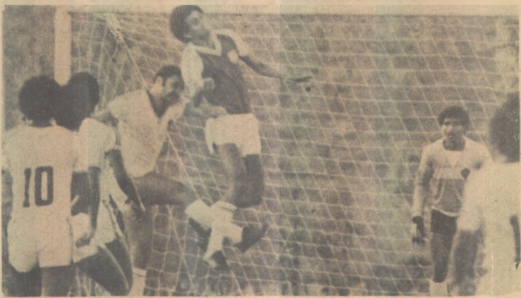
Botafogo faz uma fraca campanha no Certame

Sem apresentar nenhuma novidade para a torcida, o Botafogo voltará a intervir pelo Campeonato, nesta quinta-feira, contra o Nacional de Patos, em jogo previsto para o Estádio Almeidão, em cuja preliminar, jogarão Santos e Santa Cruz de Santa Rita. Hoje os jogadores do tricolor farão o primeiro treinamento com bola.