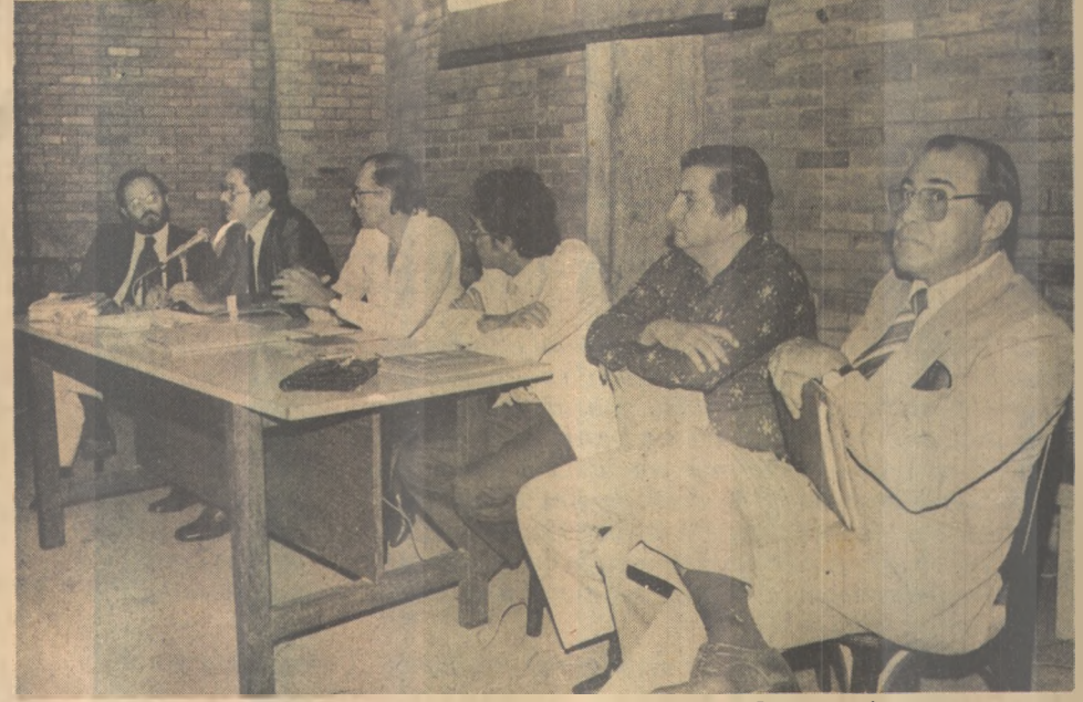
Mesa diretora dos trabalhos de abertura do Simpósio