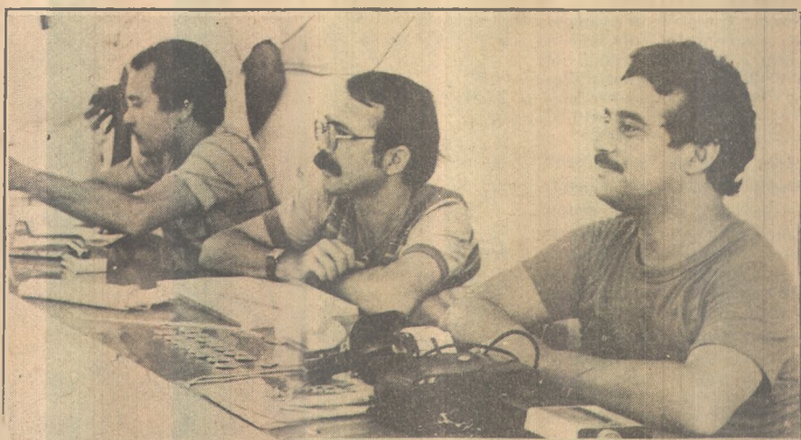
Eu, debaixo de meu bigode e óculos, não tenho de que rir

Os dirigentes do Auto Esporte confirmaram para o próximo domingo, a inauguração da sede concentração do clube, com um churrasco que será oferecido à imprensa e aos sócios, pela manhã, já que a tarde, a equipe alvi-rubra jogará contra o Campinense, no Almeidão, no segundo clássico do primeiro turno do Campeonato Estadual.