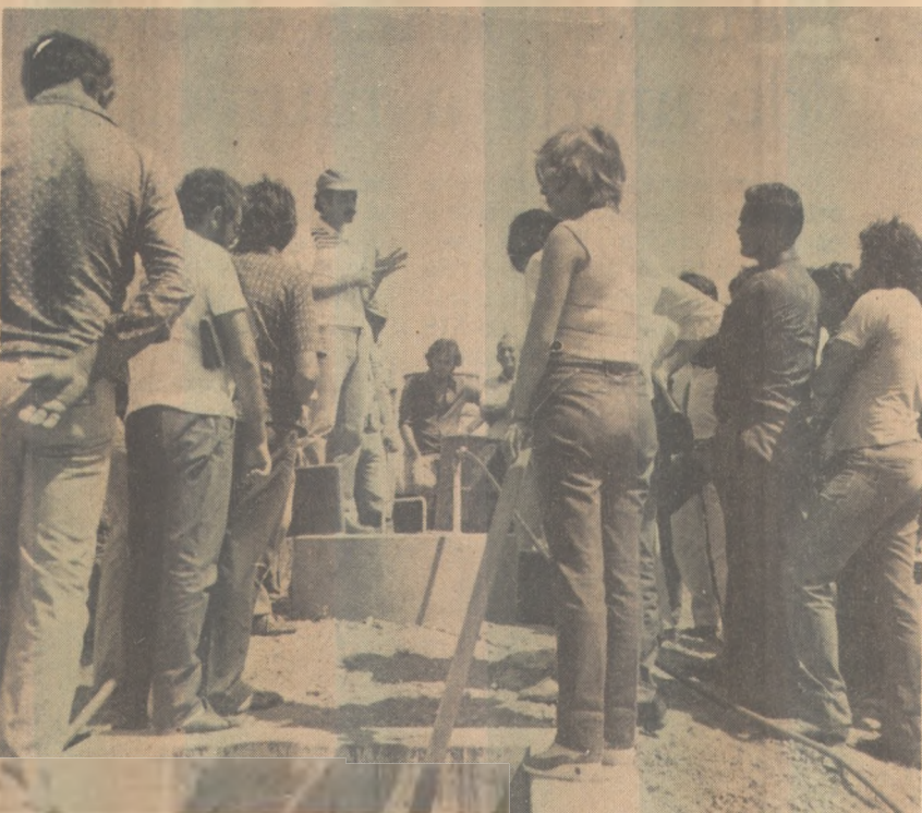
Excursão da Emater para visitar o biodigestor de Caititu