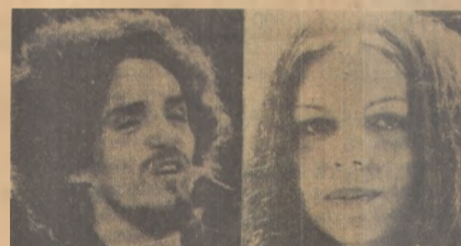
Zé Ramalho e Amelinha

Zé Ramalho não deixou ninguém quieto e fez todo mundo cantar e dançar ao som de sucessos como Admirável Gado Novo, A Terceira Lâmina e Kamikaze. Biafra repetiu o estouro de Leão Ferido, com todo o público cantando junto com ele a música Vinho Antigo.