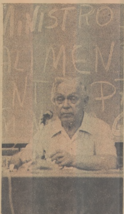
O cientista Adam Schaff

O professor Adam Schaff é conhecido mundialmente, pelas