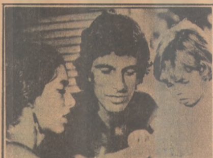
"Menino do Rio" em cartaz

DJANGO, O PISTOLEIRO IMPLACÁVEL - Produção italiana. A cores. 14 anos. No Rex. 14h30m, 16h30m, 18h30m e 20h30m.