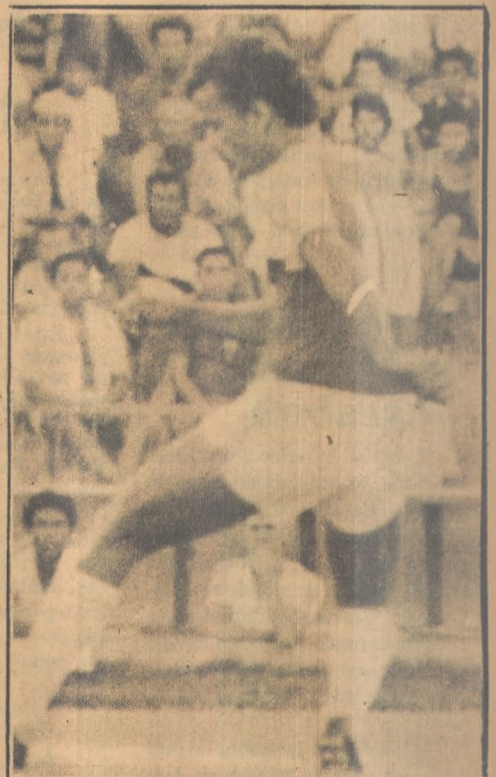
Neto ameaça deixar o Auto

O jogador deverá procurar os dirigentes do Auto esta semana, a fim de resolver a sua situação. A princípio, Neto deverá tentar novamente a sorte no Náutico, seu clube de origem. Se não for aproveitado deixará o futebol definitivamente.