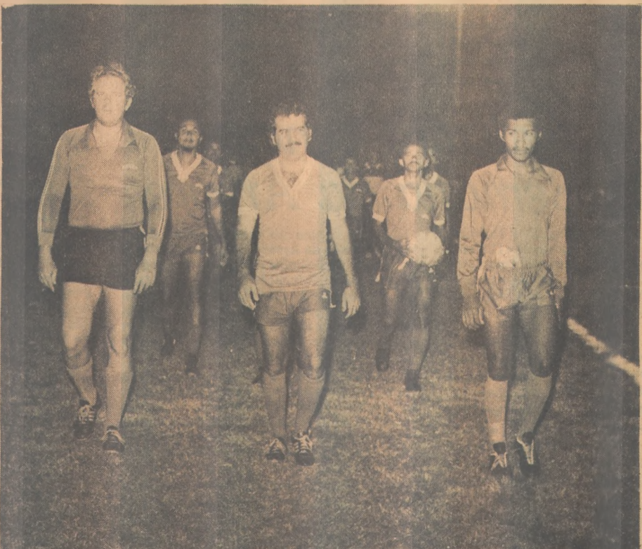
Sedec lidera o Campeonato promovido pela Prefeitura

Mais uma vez os árbitros serão da FPF e os auxiliares da Faculdade Autônoma.