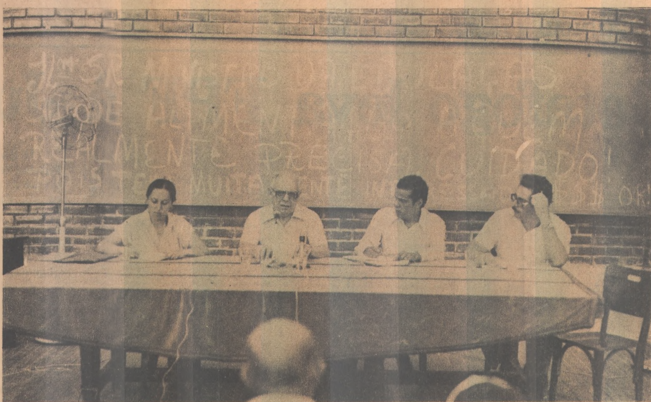
A presença de Adam Schaff no campus despertou o interesse de alunos e professores