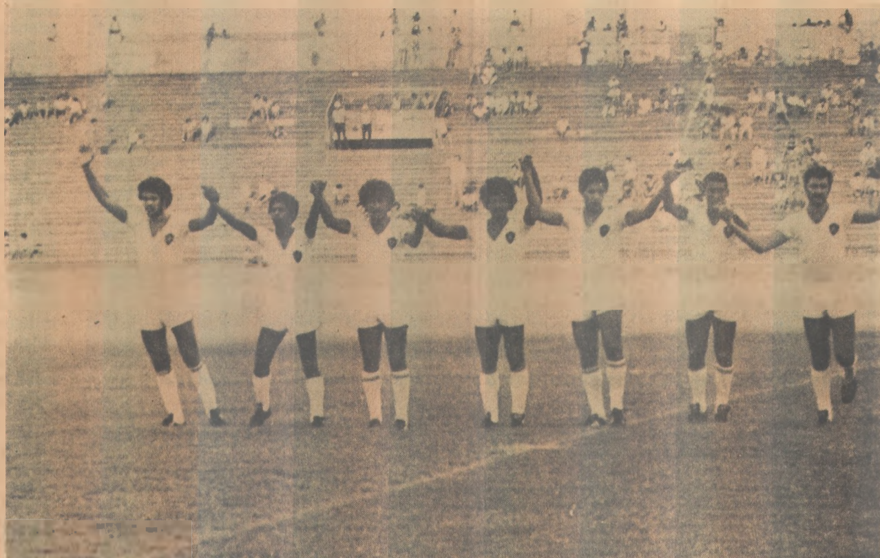
O tricolor foi prejudicado pela Federação, ficando de fora do Nacional.