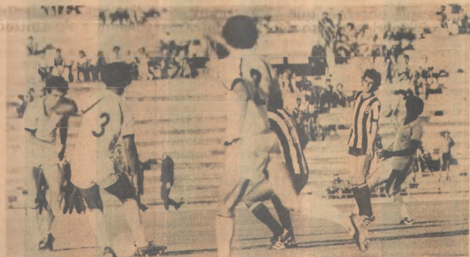
Treze se despede da Taça de Ouro, em Caio Martins