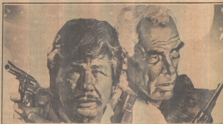
Charles Bronson e Lee Marvin em "Perseguição Mortal"