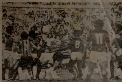
Rubro-negro contará com a sua força máxima diante do River