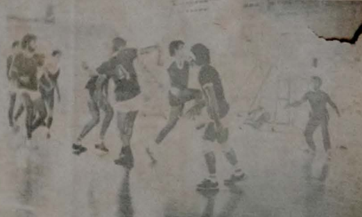
Jogos Escolares apresentaram índices superiores ao ano passado

Segundo os dirigentes do CIEF, este ano os jogos apresentaram índices técnicos superiores aos anos anteriores, correspondendo plenamente a expectativa daqueles que fazem esportes no Centro Integrado de Educação Física e Coordenadoria de Educação Física, Desportos e Recreação.