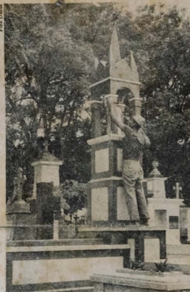
Ontem, os operários concluíram a limpeza

Mais de trinta mil pessoas deverão visitar hoje, Dia de Finados, o Cemitério Senhor da Boa Sentença, quando assistirão missa - que se realizará de hora em hora - rezarão e prestarão homenagem a seus entes queridos. Cento e vinte vendedores de flores estão mobilizados em toda a cidade para atender à procura por parte dos visitantes. O movimento no Cemitério Senhor da Boa Sentença já era tão intenso ontem à tarde, o quanto se presume ser hoje durante todo o dia. Os floristas já atendiam boa parte de fregueses, que compravam rosas, cravos, saudades, ou mesmo crisântemos. Tanto dentro como fora do cemitério era grande a movimentação, pois muitos aproveitaram o dia de ontem para reverenciar seus mortos ao invés de enfrentar a correria que se presume para hoje. Quase todos os túmulos, dos mais simples aos mais sofisticados, tinham alguém da família ou contratado por ela para fazer a limpeza da última morada do pai, mãe, filho, marido, ou mesmo de um parente mais afastado. O 13º Distrito Rodoviário Federal já montou todo esquema de segurança nas estradas, num trabalho que foi denominado de "Operação Finados". Em toda a Paraíba estão mobilizados 250 homens. (Página 5).