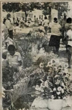
Ontem era grande o movimento, com muitos comprando flores