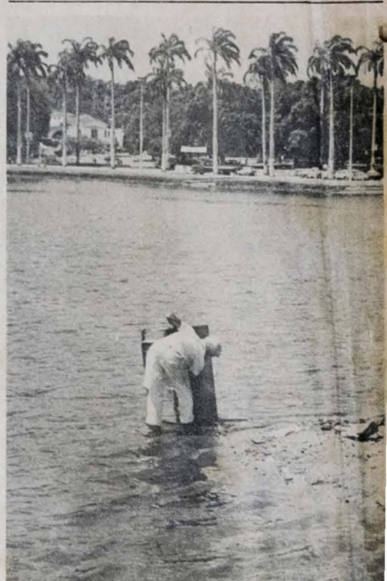
O vendedor não se intimou com sujeira da Lagoa