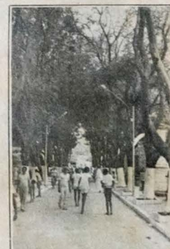
O som está em todo cemitério