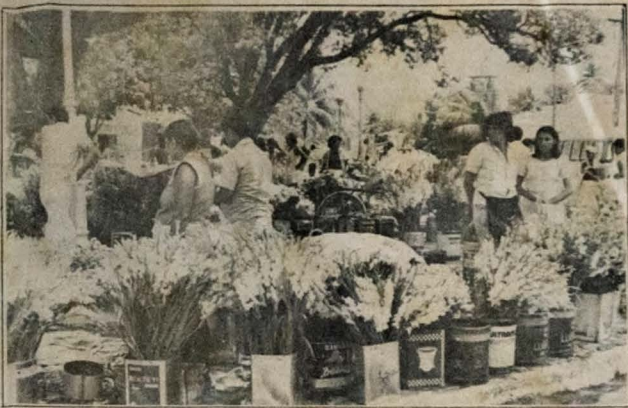
Mais de cento e vinte vendedores de flores estão espalhados pelos cemitérios da cidade à procura de fregueses. A maioria deles está localizada no Cemitério Senhor da Boa Sentença, onde é maior o movimento.