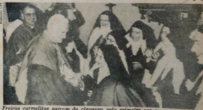
Freiras carmelitas saíram da clausura pela primeira vez para ver o papa