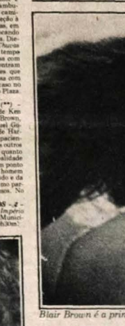
Blair Brown é a principal presença feminina em "Viagens Alucinantes", cartaz do Cinema Tumbão

• Ruim • Regular • Bom • Muito Bom • Excelente