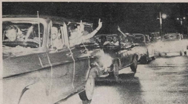
Uma grande passeata percorreu ontem, à noite, as ruas de João Pessoa

Computados até 23 horas de ontem os votos em 54 cidades, inclusive em Campina Grande e João Pessoa, o deputado Wilson Braga ampliou para 25.170 votos a diferença que impõe ao deputado Antônio Mariz, do PMDB, em busca do Governo do Estado. Até aquela hora, Braga dispunha de 42.759 votos e Antônio Mariz 17.589.