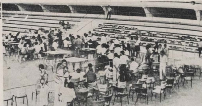
A apuração da 6ª zona, no Astréa, começou com hora e meia de atraso