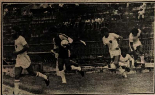
Botafogo deve ser confirmado hoje na Taça de Prata