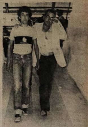
Burity: a certeza da vitória de Wilson

O vereador reconheceu, todavia, que a vitória de Wilson Braga na Paraíba foi proporcionada também pelo presidente Figueiredo, que, em sua opinião, entrará para a história como "o maior estadista, defensor da reconciliação e redemocratização nacionais".