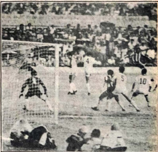
O Campeonato Carioca entra em sua reta final esta semana

OBS - 1) Se o Vasco ganhar o segundo turno, decidirá o título com o Flamengo com a vantagem de um ponto pois terá somado maior número de pontos em todo o campeonato, além de ser campeão do retorno. 2) - Se for o Botafogo ou o América, a decisão final será entre o Vasco, Flamengo e o vencedor do retorno.