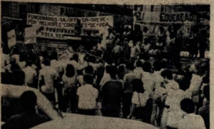
Professores e servidores leem textos e cartazes ao centro da cidade

Na última terça-feira, dia em que encerra-se as apostas da Loto, a movimentação não correspondia às expectativas dos proprietários das casas lotéricas. Também ontem, pela manhã, e começo da tarde, o número de apostas de loteria esportiva não era dos melhores, o que provavelmente fará com que o rateio diminua.