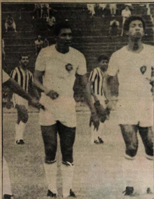
Botafogo realiza eleições no segundo domingo de dezembro