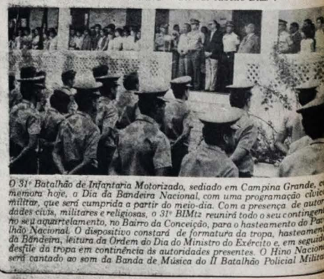
O 31º Batalhão de Infantaria Motorizado, sediado em Campina Grande, comemora hoje, o Dia da Bandeira Nacional, com uma programação cívico-militar, que será cumprida a partir do meio-dia. Com a presença de autoridades civis, militares e religiosas, o 31º BIMZ reunirá todo o seu contingente no seu acampamento, no Bairro da Conceição, para o hasteamento do Pavilhão Nacional. O dispositivo constará de formatura da tropa, hasteamento da Bandeira, leitura da Ordem do Dia do Ministro do Exército e, em seguida, desfile da tropa em continência às autoridades presentes. O Hino Nacional será cantado ao som da Banda de Música do II Batalhão de Polícia Militar.