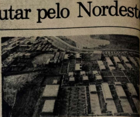
A partir de hoje não haverá movimentação no Campus II

- Acho mesmo que para se encontrar a solução dos grandes problemas do Nordeste, deve haver uma ação suprapartidária. Todos os partidos deverão se unir para atingir o objetivo comum. Nesta hora, as questões partidárias devem ser colocadas de lado. Por exemplo, vem aí a nova Constituição. O Presidente quer fazer uma nova Constituição, para o coramentor jurídico abertura política. É a oportunidade excelente de restaurar aquelas vantagens que o Nordeste vem sendo a Constituição de 1934, com o voto de 50 por cento de 2% da Receita Federal, em favor do Nordeste. Nesta hora, porque só o PDS deve trabalhar por essa conquista? Todos os partidos deverão trabalhar pela restauração daquelas prerrogativas do Nordeste.