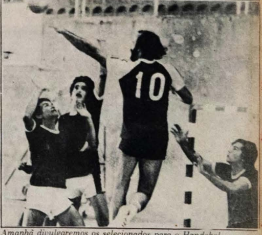
Amanhã divulgaremos os selecionados para o Handebol