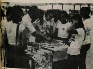
A Mostra de Cultura teve início ontem

Na abertura da Mostra estiveram presentes vice-reitor e o grupo folclórico "Mestre Ornilo", do bairro Ramagem, que executou músicas de forró e ciranda. O tempo estavam em exposição em diversas barracas trabalhos em vitral, pintura em pano e estopa, trabalhos em couro, tecelagem, crochê de puro algodão, trabalhos em madeira e em vime.