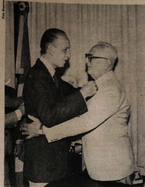
Milanez assumiu o Governo renovando confiança em Clóvis