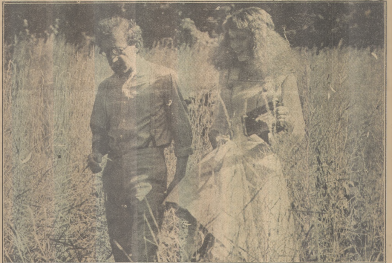
Woody Allen e Mia Farrow em "Sonhos Eróticos Numa Noite de Verão", em exibição no Tambau

"envenenados". A cores. 18 anos. No Plaza. 14h30m, 16h30m, 18h30m e 20h30m.