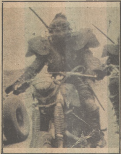
"Mad Max". no Plaza