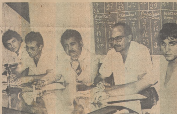
Reunião do Conselho Arbitral define a tabela do Certame

Além da divulgação da tabela, os clubes ainda pretendem alterar ou incluir alguns itens no regulamento, já que o mesmo está sujeito a correção. Esta será a última reunião do Conselho Arbitral e nela ficará definido tudo com relação a disputa do Certame Estadual.