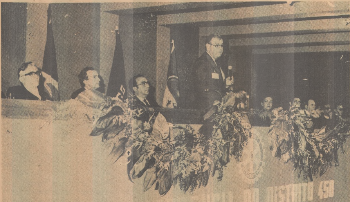
Autoridades prestigiaram a reunião rotária