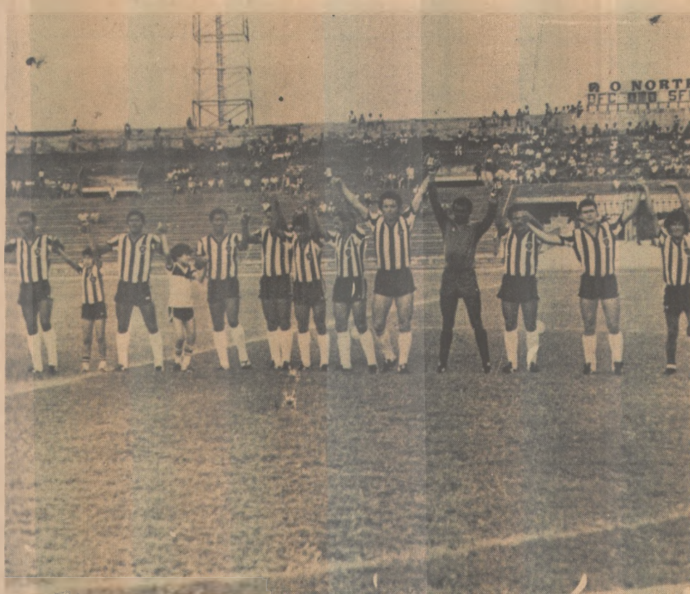
O empate com o Santa criou um mal-estar entre os dirigentes