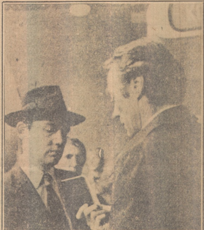
"Firefox - A Raposa de Fogo" continua em cartaz no Plaza