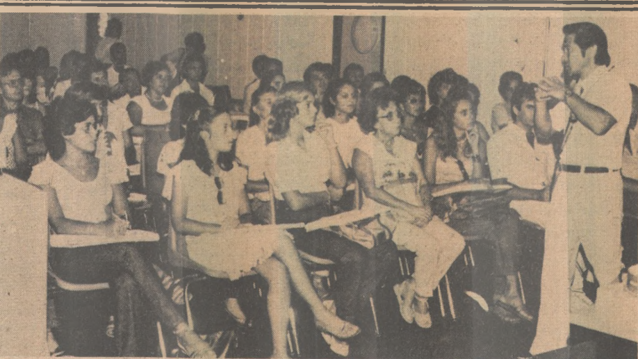
O encontro de odontopediatria termina hoje

Ao final, Délio Jardim de Mattos disse aos jornalistas que as armas que forem encontradas voltarão para a Líbia "através de transporte nosso, provavelmente por navios".