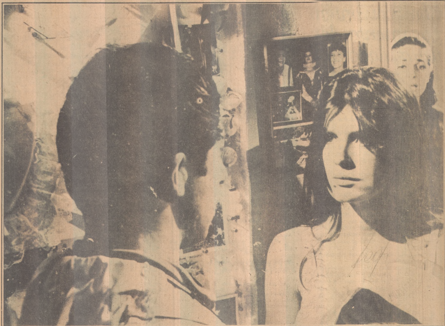
Dustin Hoffman e Katherine Ross em "A Primeira Noite de um Homem", de Dustin Hoffman, em último dia de exibição no Tambaú

A zoologia da África colonial também se encontra no volume com os seus espécimes tão admirados pela civilização. No tocante às ocorrências espaciais, elas são inúmeras e de indescritível intensidade. No ano de 1908, sobreveio arrasadora explosão em Tunguska, na Sibéria, ouvida a uma distância de oitocentos quilômetros.