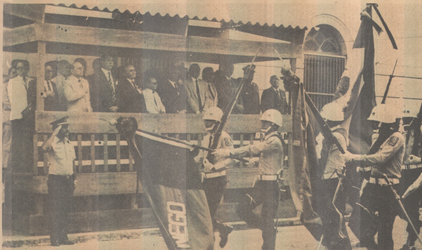
Autoridades do Estado prestigiaram as solenidades do Dia de Tiradentes

Até o meio-dia de ontem, foram solicitados pelos moradores do Conjunto de Mangabeira, cerca de 1.869 pedidos de ligação, dos quais foram atendidos aproximadamente 1.816. Para que o pedido do usuário seja atendido de imediato, a Cagepa exige uma declaração da Cehap, para que no dia da ligação não haja qualquer dúvida.