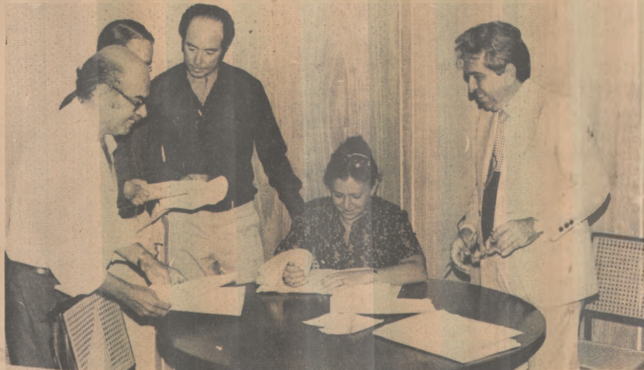
A Comissão de Desacumulação espera examinar todos os processos até quarta-feira