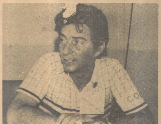
Valdemiro: "congresso tem êxito"

O I Congresso de Odontopediatria Preventiva do Nordeste foi aberto oficialmente às 20,30 horas, na última quarta-feira, com a presença do governador do Estado, sr. Wilson Braga, do prefeito da Capital, sr. Oswaldo Trigueiro, e da presidente da Fundação Espaço Cultural, sra. Giselda Navarro Dutra. Cerca de mil pessoas prestigiaram a abertura do congresso. Logo após houve apresentações de grupos folclóricos e de música erudita.