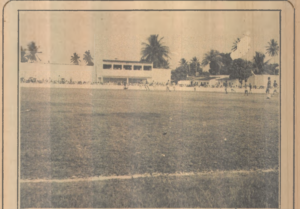
Além da iluminação, a Prefeitura está melhorando outros setores

A prova de júnior que será iniciada às 8 horas terá um percurso de 45 km, em 10 voltas, enquanto a de adultos terá um percurso de 60 km, em 15 voltas começará às 9,45 horas. A competição terá a cobertura total da Companhia de Trânsito da Polícia Militar do Estado, que fará a fiscalização nos pontos críticos da pista durante o desenrolar da prova.