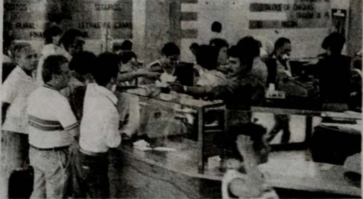
No outro dia, após o assalto, a agência funcionou normalmente