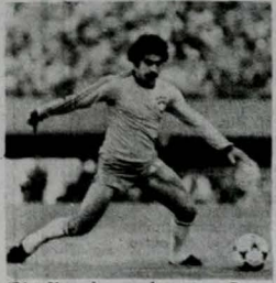
Rivelino é a maior atração