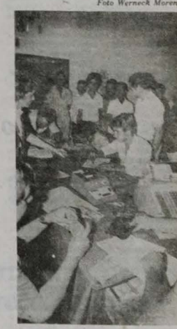
Benefícios para produtores