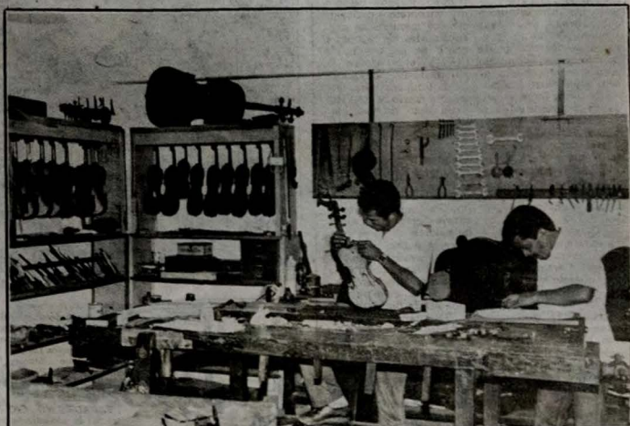
Com arte, paciência e capacidade, dando vida aos instrumentos

Em todos os Brasis foram realizadas buscas atrás