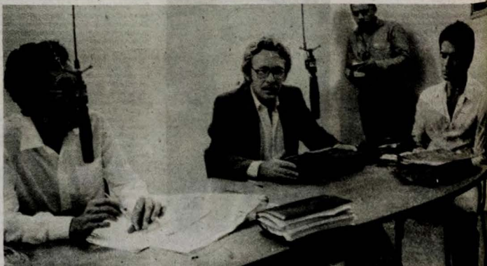
Yedo Andrade teve um dia muito movimentado, ontem, em Campina Grande.

Campina Grande (Da Sucursal) - Ao instalar ontem a diretoria do Departamento Estadual de Trânsito - Detran, por um período de dez dias, em Campina Grande, o diretor superintendente do órgão, Yedo Andrade, afirmou que, durante a sua permanência nesta cidade, será realizada toda a implantação do sistema de sinalização estabelecido pelo novo plano de tráfego local, onde serão empregados recursos da ordem de 80 milhões de cruzeiros.