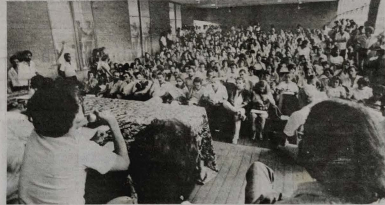
Em assembleia geral, os professores decidiram que a ANDES fará a negociação com o MEC

a participação de aproximadamente 700 funcionários. Os servidores aprovaram a proposta de retorno ao trabalho, com vista de que ocorre, num período de 30 dias, as negociações em torno de sua pauta de reivindicações. A propósito, ao contrário da colocação da ministra da Educação e Cultura, Esther Ferraz, onde o CRUB - Conselho de Reitores das Universidades Brasileiras - seja o negociador, o CNG concorda que fique a responsabilidade de uma comissão paritária, integrada por membros da ANDES e FASUBRA. (Página 5)