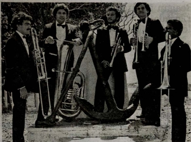
O Quinteto de Metais da UFPA se apresenta hoje, em recital ao ar livre, no Ponto de Cem Réis

O regulamento do concurso acha-se à disposição dos interessados nas sedes acima relacionadas do Projeto Rondon.