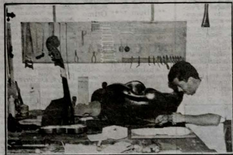
A sensibilidade e a alma, no trabalho artesanal de bom gosto