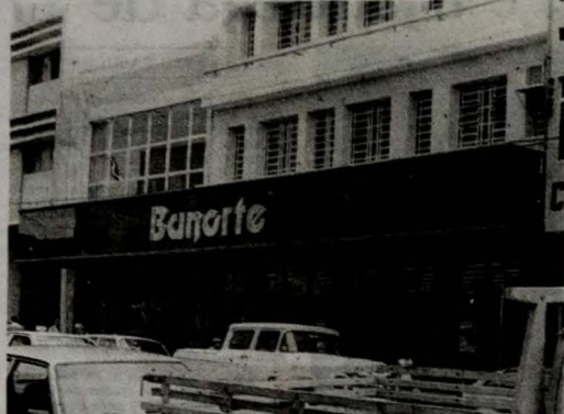
Os assaltantes levaram da agência do Banorte mais de 37 milhões

As matrículas para os alunos dos cursos de Administração, Direito, Pedagogia, Educação Física e Psicologia das Instituições Parahibenses de Educação, iniciadas a 25 de julho, prosseguem até o dia 8 de agosto. Desde então poderão ser matriculados os alunos do ensino médio. Os que não têm crédito educativo poderão também ser matriculados até o dia 8. Todas as secretarias estarão funcionando nos três turnos, havendo ainda expediente na manhã do sábado. As diversas unidades de ensino do IPE, tanto as que estão situadas nos Campús, como as que se localizam na cidade, registraram grande movimento e os alunos recebiam as instruções necessárias. Durante esses dias, todas as secretarias estarão funcionando nos três turnos, havendo ainda expediente na manhã do sábado. Um posto de Serviço bancário foi instalado no Campus, proporcionando melhor atendimento. As aulas terão início no dia 8 de agosto, como estabelece o calendário escolar. No decorrer da semana, os Diretores realizarão reuniões com os professores, discutindo propostas, inclusive, a realização do planejamento do semestre letivo.