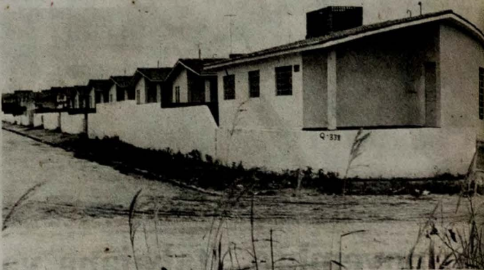
(1) moradores abandonam as casas no Bairro das Indústrias. Prestação alta e insegurança