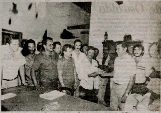
Agricultores de Camalau receberam os seus créditos