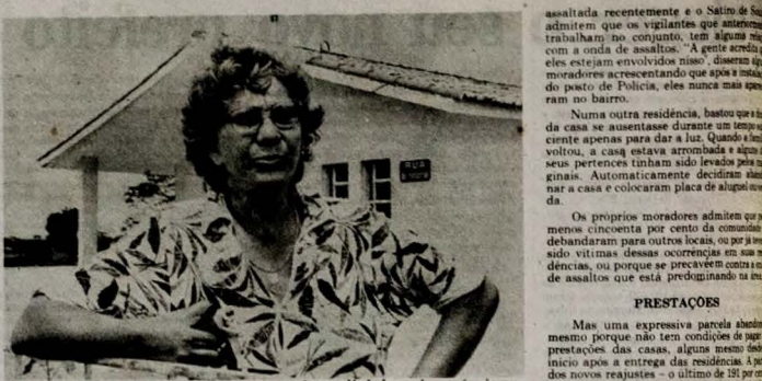
A moradora reclama e pede uma ação policial mais enérgica

uem em casa além de automóvel, televisores a cores e alguns objetos de relativo valor, tudo exposto a ação de marginais, pela falta de segurança e também por situar-se numa área praticamente deserta.