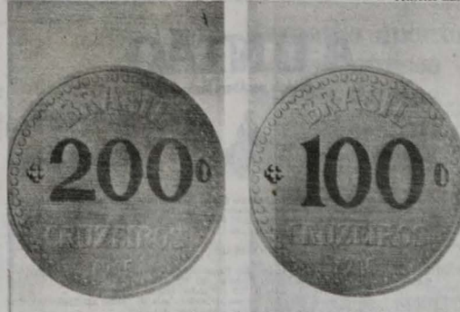
As moedas de Cr$ 200 e Cr$ 100 circularão já no próximo ano