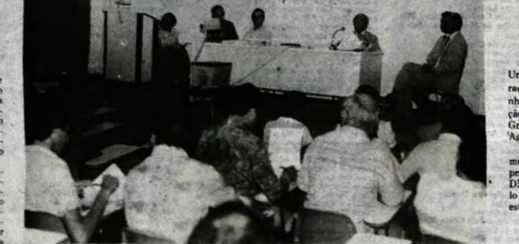
Os prefeitos receberam orientação sobre o salário educação