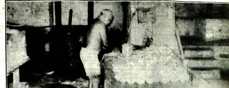
Saboardia fabrica até 40 toneladas de sabão em barra por mês

Falta investimento não seria, devesse, um gesto de saudosismo. No interior da Paraíba e de outros Estados nordestinos, muitas indústrias continuam, a empregar métodos artesanais de fabricação, por não poderem arcar com as altas despesas de combustível. A farinha, por exemplo, ainda é preparado como nos tempos do Brasil-Colônia, e embora a mecanização agrícola faça presenças nos campos, o feijão ainda é debulhado pela "batida", um sistema primitivo de beneficiamento de grãos.