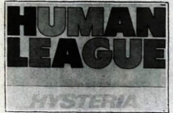
Capa do mais novo LP do Human League.

O Ballet Iris se apresenta amanhã no teatro Paulo Pontes com um belo espetáculo