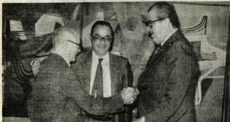
Do presidente do Senado, Moacyr Dalla, Maluf recebeu a confirmação de apoio ao seu nome