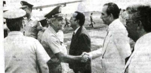
Estagiários da ESG foram recebidos pelas autoridades. Eles terão informações sobre o desenvolvimento do Estado. (Página 8)