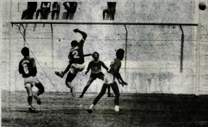
Em meio à crise administrativa, o Auto se prepara para enfrentar o Treze no domingo