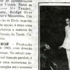
Elisavinda Prestley: documentário de turnê na Globo às 19h30m

Jovens talentosos na peça "O Conservador de Brinquedos"