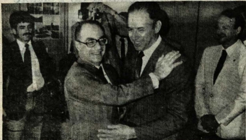
Maluf pediu o apoio do deputado Nelson Marchezan à sua candidatura à Presidência da República