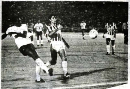
O alvi-negro só pensa na classificação do quadrangular