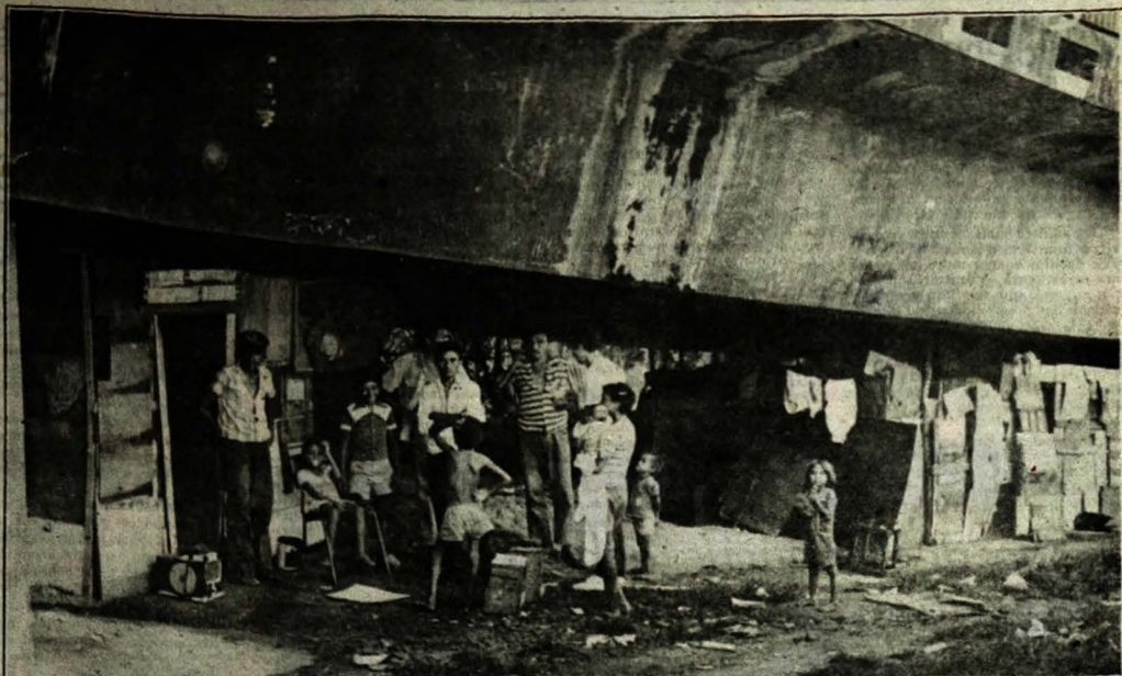
Sete famílias, oriundas de diferentes favelas de João Pessoa, construíram casebres de tábuas e papelão no "Terceirão"

Se alguém descer ao estudo minucioso do que a novela, tipo consumo público, representa de negativo para a cultura nacional, mais do que isto, do que traz de danoso à moral pública, à dignidade coletiva, ao próprio respeito do homem pelo homem, terá tão violenta decepção que não chegará ao término da especulação. Indaga-se, a propósito de tal evidência negativa: E não existe um Ministério de Educação e Cultura? Respondam os homens de letras deste País. A minha resposta? Ora, pátrio, santa ingenuidade... Pra que diabo serviria a resposta de um pobre de Cristo, no fim de uma jornada, sem eira nem beira de responsabilidade nas coisas deste País?