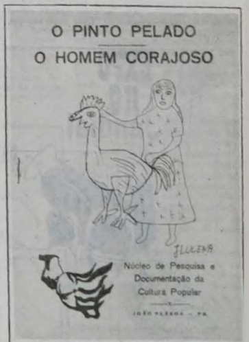
O Nuppo está publicando algumas dessas estórias