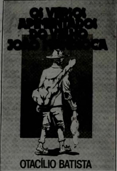
Capa do livro de Otacílio Batista