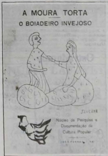
Em geral, os contadores preferem as estórias engraçadas