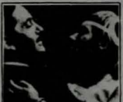
Paulo José e Marília Pêra: tango em "O Rei da Noite", no Bangue