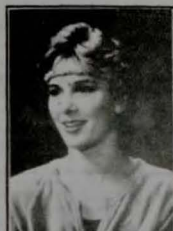
A bela Cynthia Rhodes contracenava com Travolta em "Os Embalos...", no Municipal