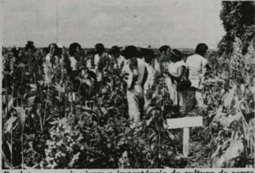
Produtores rurais viram a importância da cultura do sorgo