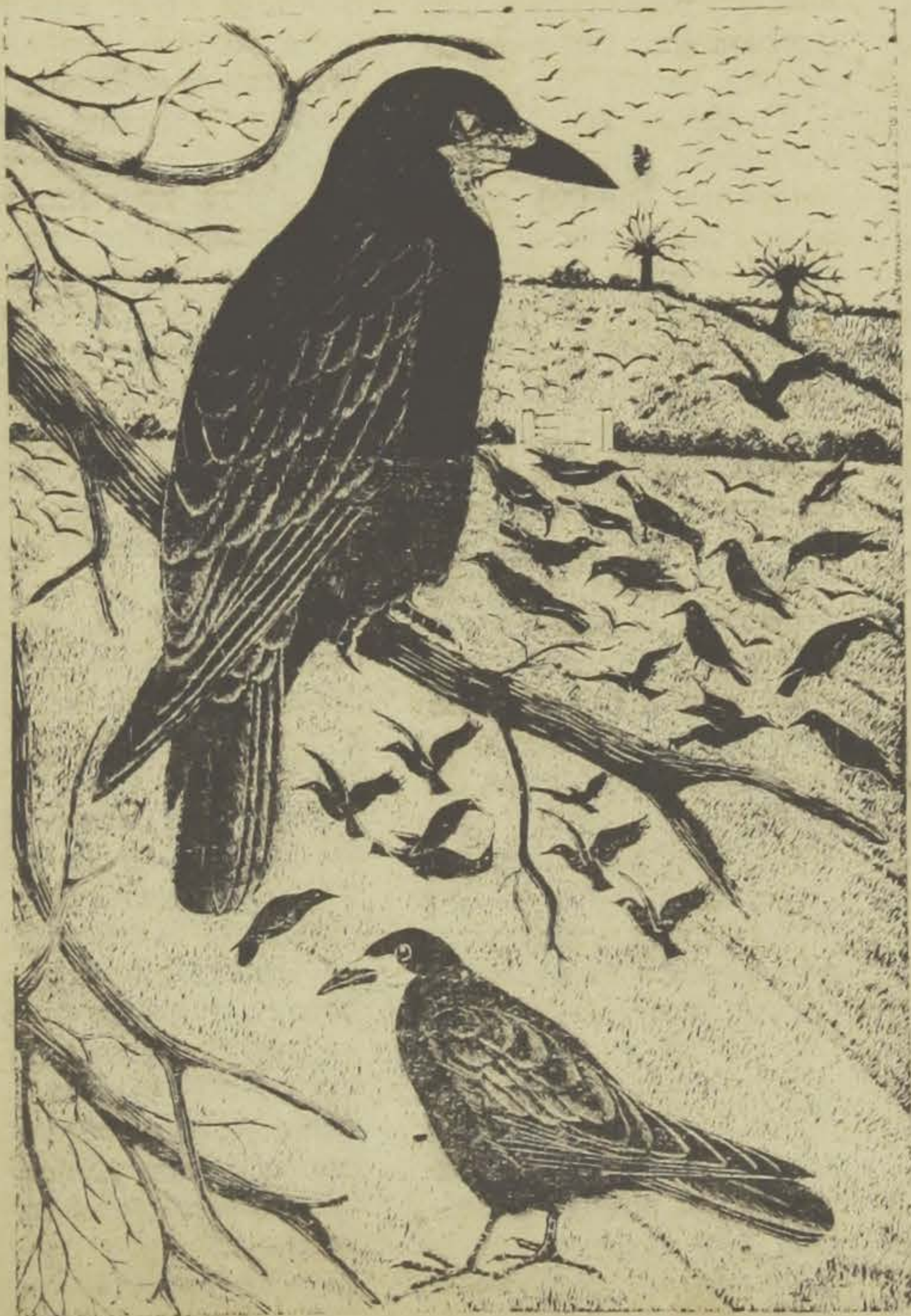
DAGLICH — DE "PÁSSAROS DAS ILHAS BRITANICAS"

Entretanto, ele, impassível atravessou a sala, atirou para longe o cigarro pela janela, para não sujar.