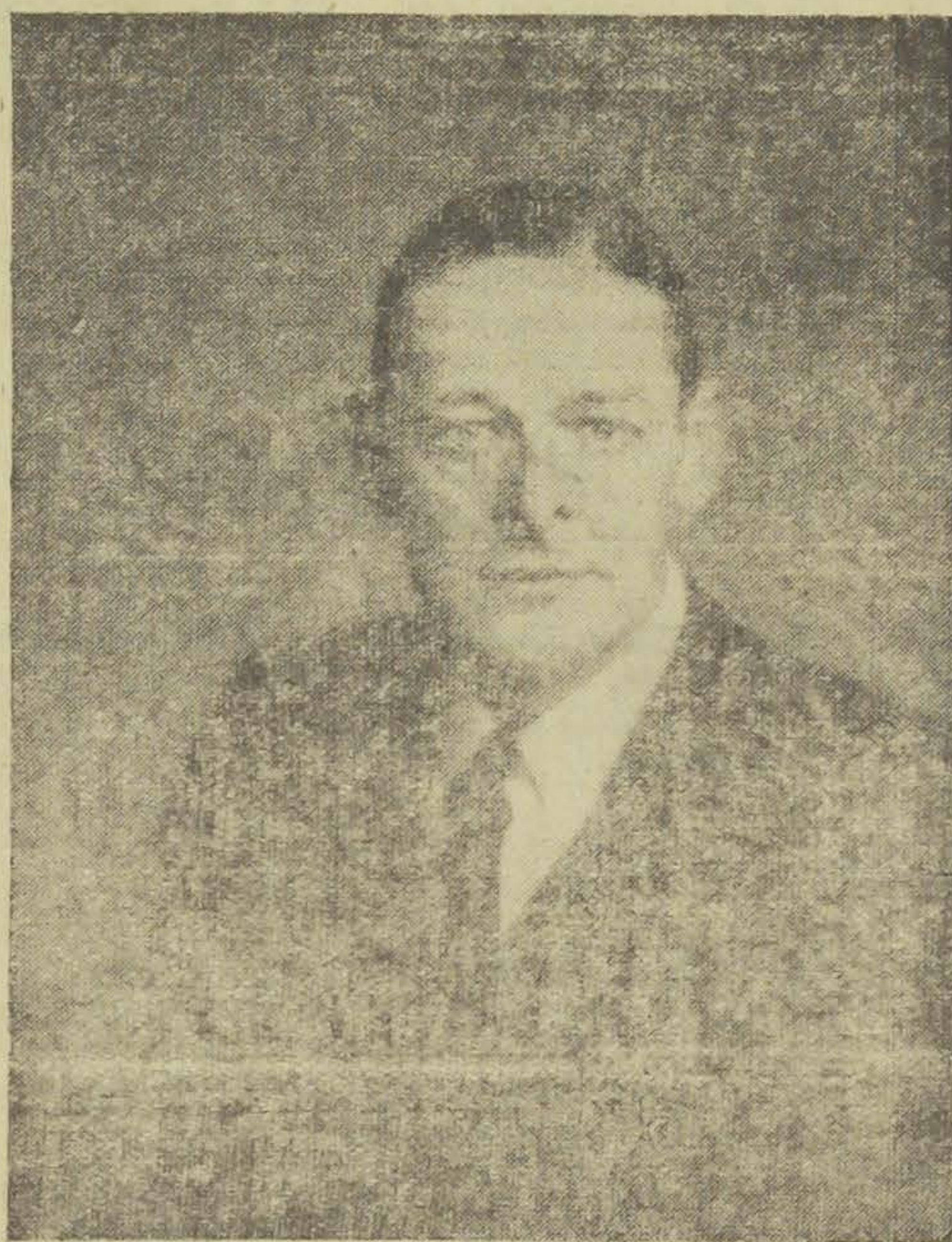
T. S. ELIOT

A convicção de que a sociedade já não constituía um ambiente satisfatório para o ser humano tradicional, tal como a religião e o humanismo o haviam moldado, foi igualmente demonstrado por escritores de outros países europeus. O austríaco Franz Kafka formulou, essa opinião em uma rápida alegoria. Referindo-se ao homem da sua geração, Kafka declarou: — "Outrora fez parte de um grupo monumental. Em redor de alguma personagem colocada numa posição de destaque havia, em ordem significativa, estigias da classe militar, das artes, das ciências, dos ofícios manuais. Outrora fez parte dessas inúmeras figuras. Mas o grupo de há muito que