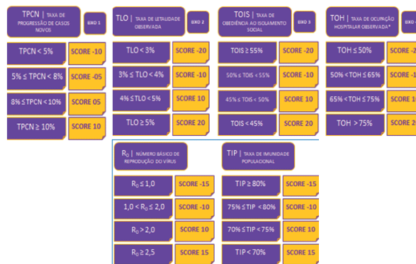
Figura 1: conjunto de indicadores dos eixos e da calibragem da Matriz Analítica do NOVO NORMAL PB

O 1º dos três componentes do NOVO NORMAL PB é o seu conjunto de indicadores formado por 4 (quatro) eixos e 2 (duas) calibragens, que compõem a Matriz Analítica, como se pode observar na figura 1 abaixo: