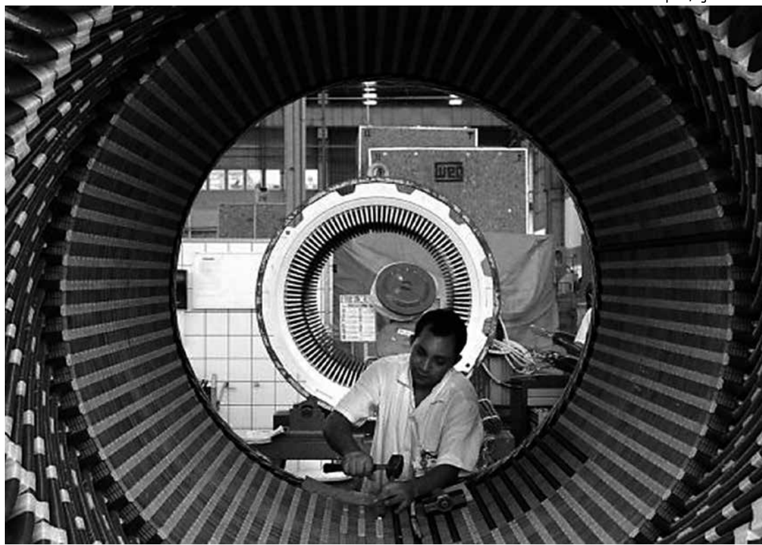
Indústria apresentou recuo de 1,1%, conforme aponta pesquisa do Indicador Serasa Experian

Pelo lado da demanda, o tombo mais intenso ao longo de 2015 se deu nos investimentos. A Formação Bruta de Capital Fixo (FBCF) teve queda de 14,9%. No ano passado, o consumo das famílias encolheu 3,8%, enquanto o do governo foi 0,4% menor que o de 2014. As únicas contribuições positivas para a atividade econômica em 2015 vêm do setor externo: as exportações cresceram 5,9% e as importações, que entram no cálculo com sinal invertido, caíram 14,3%. Nos resultados de dezembro de