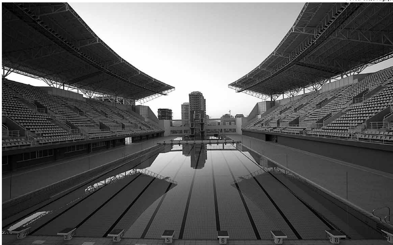
O Parque Maria Lenk está pronto para a Copa do Mundo de Saltos Ornamentais que será disputado de hoje até o próximo dia 24