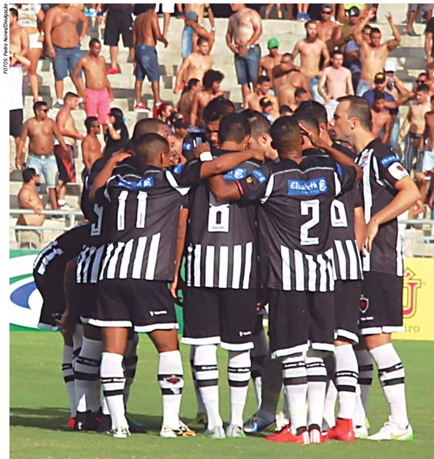
Depois de dois jogos na Copa do Nordeste quando perdeu para Sport e River, os jogadores do Bota voltam a encarar o Paraibano