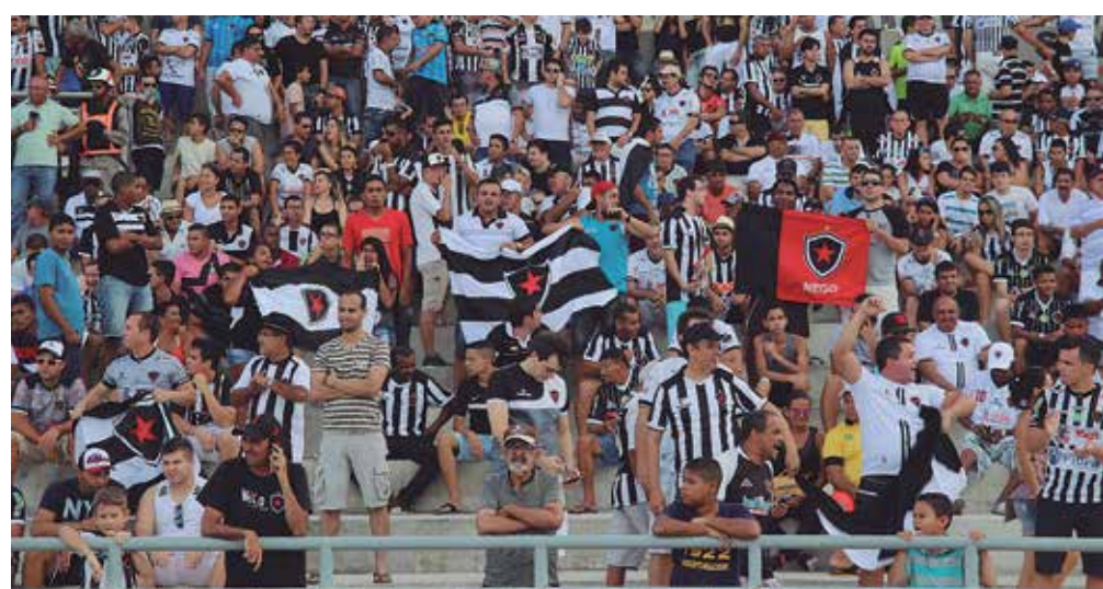
A torcida do Botafogo propiciou o melhor público da competição na segunda rodada

A boa notícia é que apenas dois dos dez clubes não têm média superior a mil pagantes. O lanterna Atlético Cajazeirense realizou um jogo em casa e arrastou 609 testemunhas. Já o Treze é a grande decepção com média de apenas 952 gatos pingados. O menor público do Estadual, porém, é do Santa Cruz ante o Atlético Cajazeirense (42).