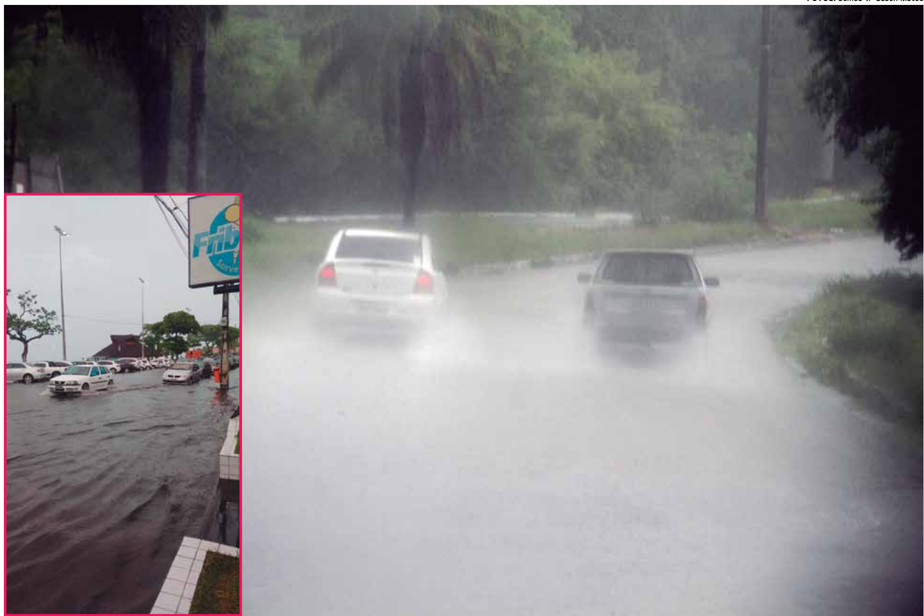
Em Manaíra, a chuva e um bueiro entupido alagaram a área entre as avenidas Ruy Carneiro e Almirante Tamandaré; o trânsito ficou lento nas principais áreas da cidade

A Defesa Civil atende a população através do número: 0800-285 9020 para possíveis ocorrências.