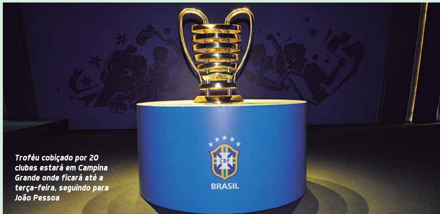
Troféu cobiçado por 20 clubes estará em Campina Grande onde ficará até a terça-feira, seguindo para João Pessoa

A "orelhuda", como está sendo chamada por torcedores nordestinos de clubes que disputam a competição, de Campina Grande, segue para a capital João Pessoa, onde permanecerá até a sexta-feira, dia 26, para apreciação da torcida botafoguense e de desportistas pessoenses.