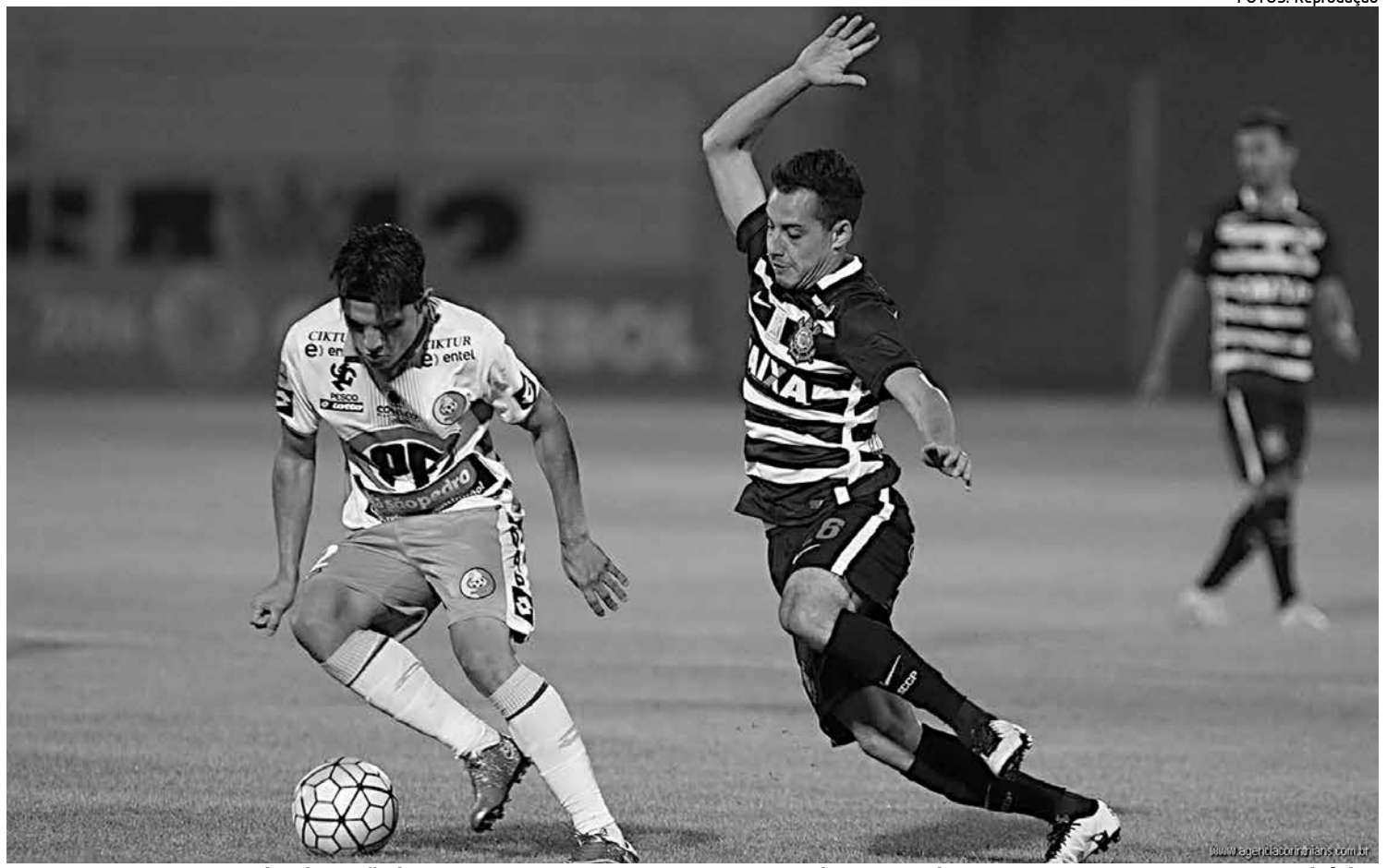
Contra o Cobresal, o Corinthians não jogou bem, mas contou com a sorte no final da partida quando um gol contra lhe deu a vitória

"Perder em casa contra um rival direto que é do único lugar do mundo onde você não joga bola normal (La Paz, na Bolívia), é complicado. Mas a gente tem condições de buscar esses três pontos", lamentou Lugano.