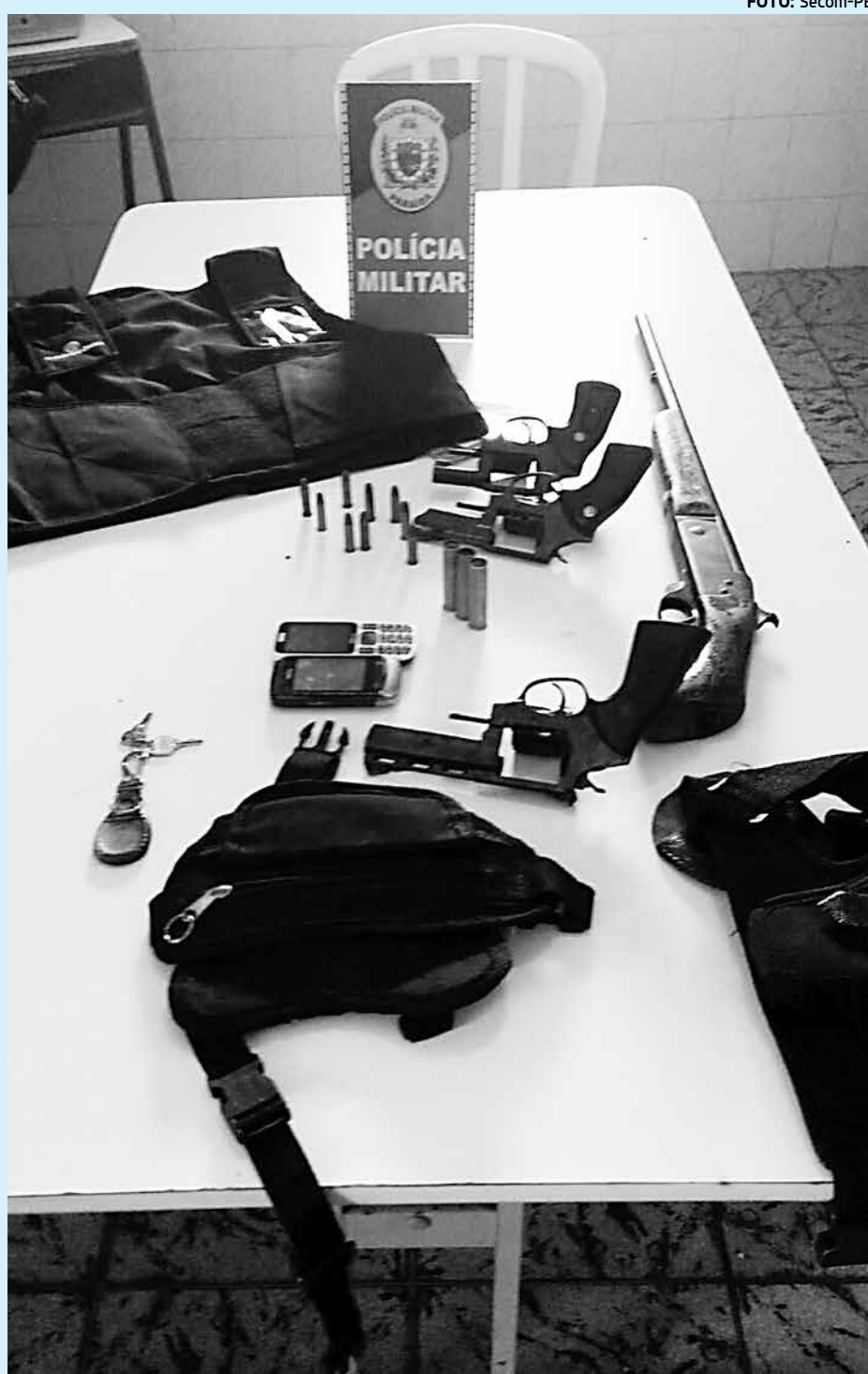
Revólveres, espingardas, munição, telefones celulares foram apreendidos na operação