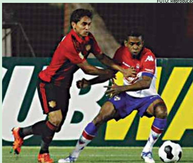
O Sport, que venceu o Fortaleza, joga com o River no dia 3 de março

A Confederação Brasileira de Futebol aprovou algumas alterações na tabela de jogos da quarta rodada da Copa do Nordeste. Os confrontos Coruipé x Estanciano, no dia 1º de março, e Imperatriz x ABC, no dia 3, passaram das 19h15 para as 19h.