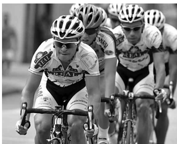
Ciclista entra para a história deste esporte na Paraíba

No ano passado, o atleta teve um bom desempenho no tour de San Luis, sendo o melhor brasileiro da competição e conseguiu ser o campeão da etapa mais difícil da competição.