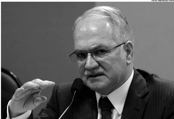
Para o ministro Edson Fachin, relator da ação, escolas não podem escolher os alunos que serão matriculados e nem segregar deficientes

A lei entrou em vigor em janeiro deste ano e proíbe escolas particulares de recusar matrículas e cobrar valores adicionais nas mensalidades de pessoas com deficiência