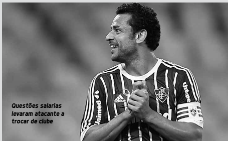
Questões salariais levaram atacante a trocar de clube

O camisa 9 não esteve presente. Ele seguiu para Belo Horizonte para realizar os exames médicos. A sua apresentação aos novos torcedores será no domingo, momentos antes do clássico na Arena Independência, diante do Cruzeiro.