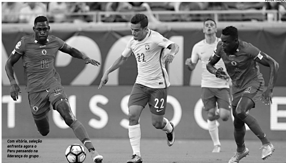
Com vitória, seleção enfrenta agora o Peru pensando na liderança do grupo

No primeiro tempo, aliás durante todo o jogo, o melhor foi observar o entusiasmo da torcida do Haiti. Os caribenhos deram um show nas arquibancadas. Vibraram com defesa do goleiro Patrice, com desarmes, com chutes