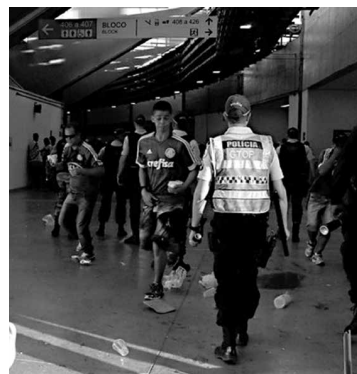
Confusão ocorreu no último domingo entre torcidas organizadas

Com o fim da era Fred, o Fluminense segue seu rumo. Tendo novo ponteiro, o atual oitavo colocado do Campeonato Brasileiro irá ao Raulino de Oliveira amanhã, às 18h30 (de Brasília), para encerrar, pela sétima rodada da competição, o Grêmio.