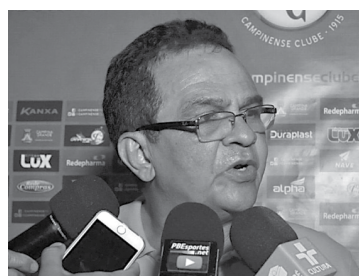
Treinador preferiu continuar por mais uma temporada no clube