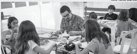
Crianças e facilitadores se misturam no colorido da Gibiteca Henfil do Espaço Cultural

O Espaço HQ deste mês encerra as atividades do curso, quando os alunos poderão vender o fanzine com os quadrinhos produzidos por eles próprios durante as aulas na Feira de Quadrinhos Infantis. O objetivo desta edição é fechar o ciclo, fornecendo uma experiência completa, da produção à venda para as crianças quadrinistas, bem como criar um ambiente para que as crianças de diferentes escolas troquem suas experiências. A ideia é