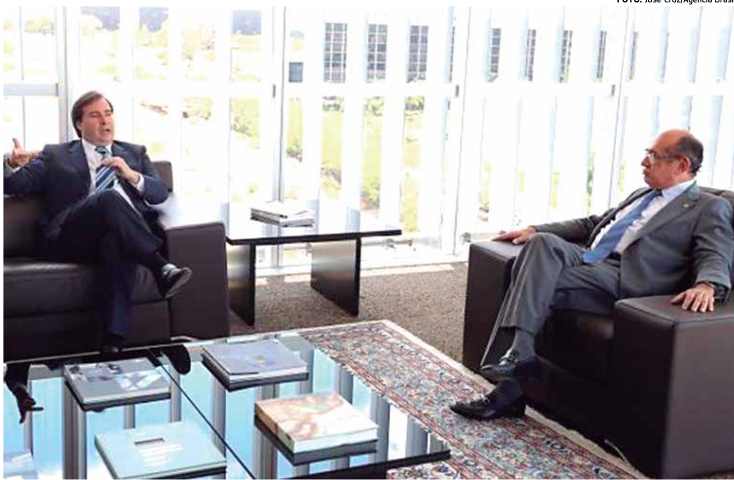
Presidente da Câmara, Rodrigo Maia se encontra com presidente do Tribunal Superior Eleitoral, ministro Gilmar Mendes, na sede do TSE

Segundo o presidente da Câmara, Rodrigo Maia (DEM-RJ), a expectativa é que o colegiado seja instalado o mais rápido possível