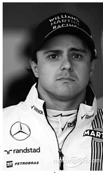
Massa bem atrás de Bottas

10 a 9, com menos de um décimo de diferença média entre os dois pilotos.