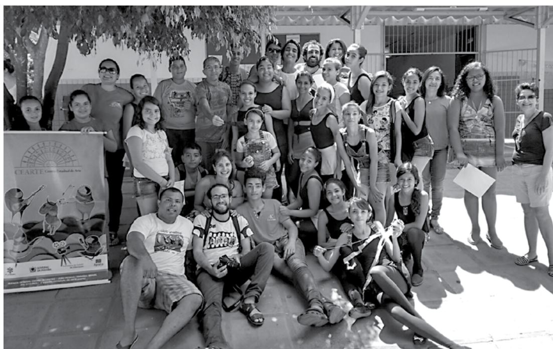
Em todas as edições do projeto, as turmas transformam-se em grupos artísticos

Algo interessante a se ressaltar é que o coordenador do projeto fez uma ressalva dizendo que a Paraíba é um local ao qual não pode faltar a troca de experiências e saberes artísticos e humanitários vindos da arte. “Não