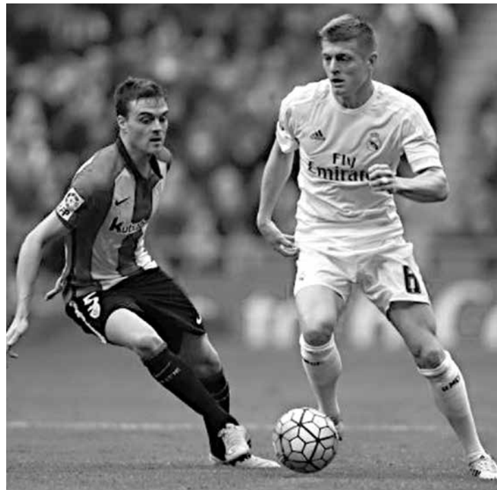
Toni Kroos, do Real, renovou contrato até 30 de junho de 2022

uma possível saída). Não disse nada porque estou muito feliz desde o primeiro dia. Por isso, rapidamente chegamos ao acordo. Sou feliz desde o primeiro dia e sempre tive certeza de que continuaria no Real Madrid.