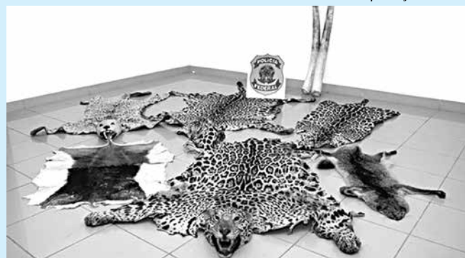
A onça-pintada está entre os preferidos por causa da pele