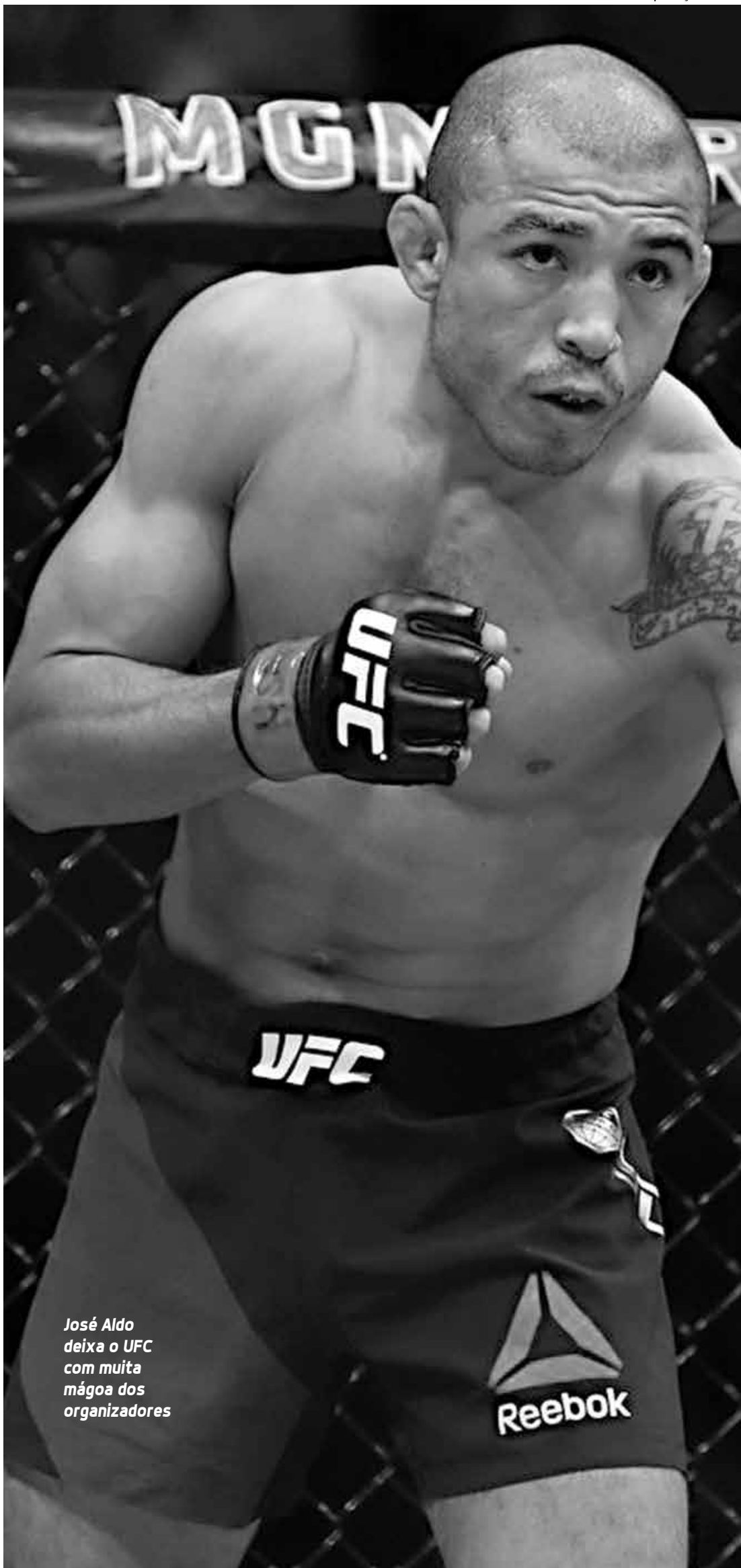
José Aldo deixa o UFC com muita mágoa dos organizadores

Aldo ainda reiterou que deseja parar de lutar e, mais uma vez, recusou a hipótese de competir em algum outro evento de artes marciais mistas. "Não vou sair do maior campeonato do mundo para jogar em uma Segunda Divisão. Sou um time grande, quero sempre estar no melhor lugar do mundo. Se não for para estar no UFC, não luto mais em lugar nenhum".