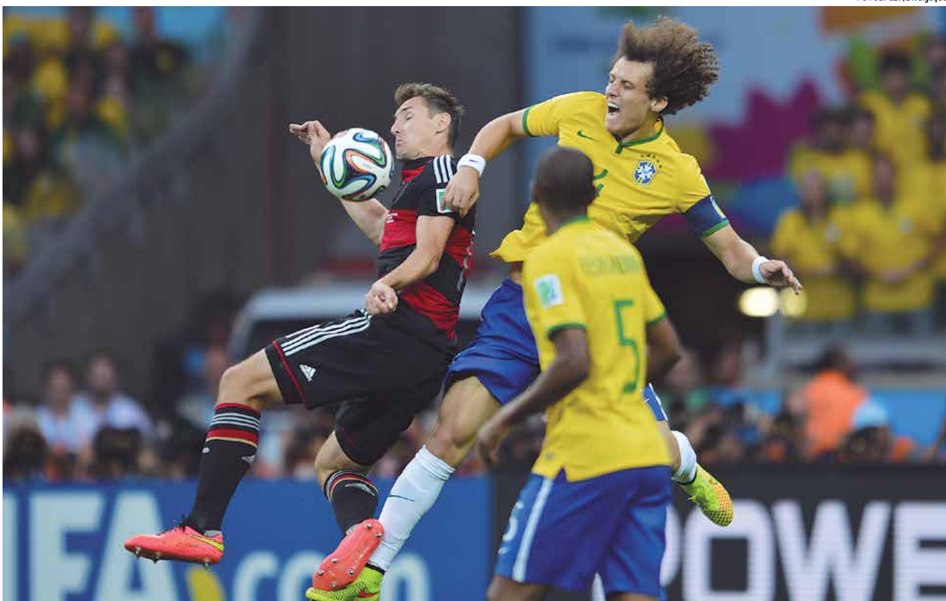
Na Copa do Mundo de 2014, o Brasil sofreu a sua maior humilhação da história quando perdeu de 7 a 1 para a Alemanha nas semifinais em jogo disputado no Mineirão

O calendário da Fifa, porém, é cruel com as pretensões brasileiras. Em 2017, haverá cinco períodos de 10 dias, reservados para jogos entre seleções: março, junho, fim de agosto e início de setembro, outubro e novembro. As eliminatórias europeias para o mundial de 2018 têm rodadas agendadas para quatro desses cinco períodos. A Alemanha, por exemplo, fará um jogo em março, um em junho, dois em setembro e mais dois em