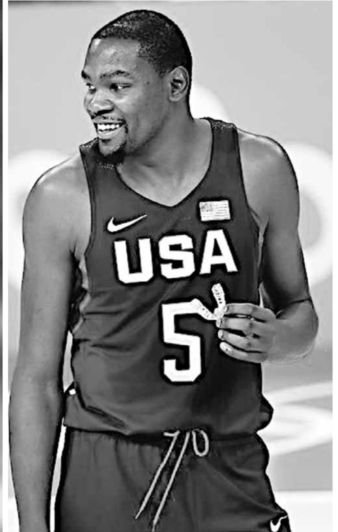
Craque do Barcelona segue soberano e Durant, do basquete norte-americano, aparece em segundo na lista dos mais ricos esportistas por ano