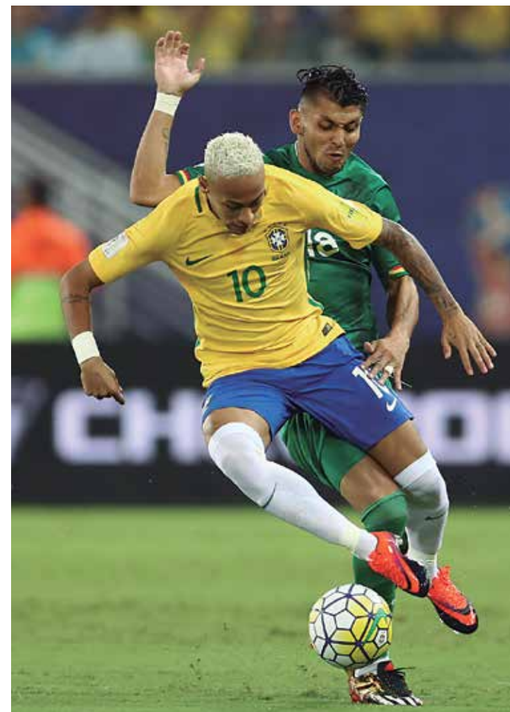
Maradona diz que Neymar vai pra cima mesmo levando pontapés

"Para mim a Bola de Ouro não é precisa. Por exemplo: eu não sou muito amigo dos goleiros, mas em 2014, com CR7, Messi e Neuer finalistas, deveria ganhar o alemão, não Ronaldo. Neuer havia vencido a Copa do Mundo. Mas, voltando à comparação, eu não posso dizer que Messi é mais do que