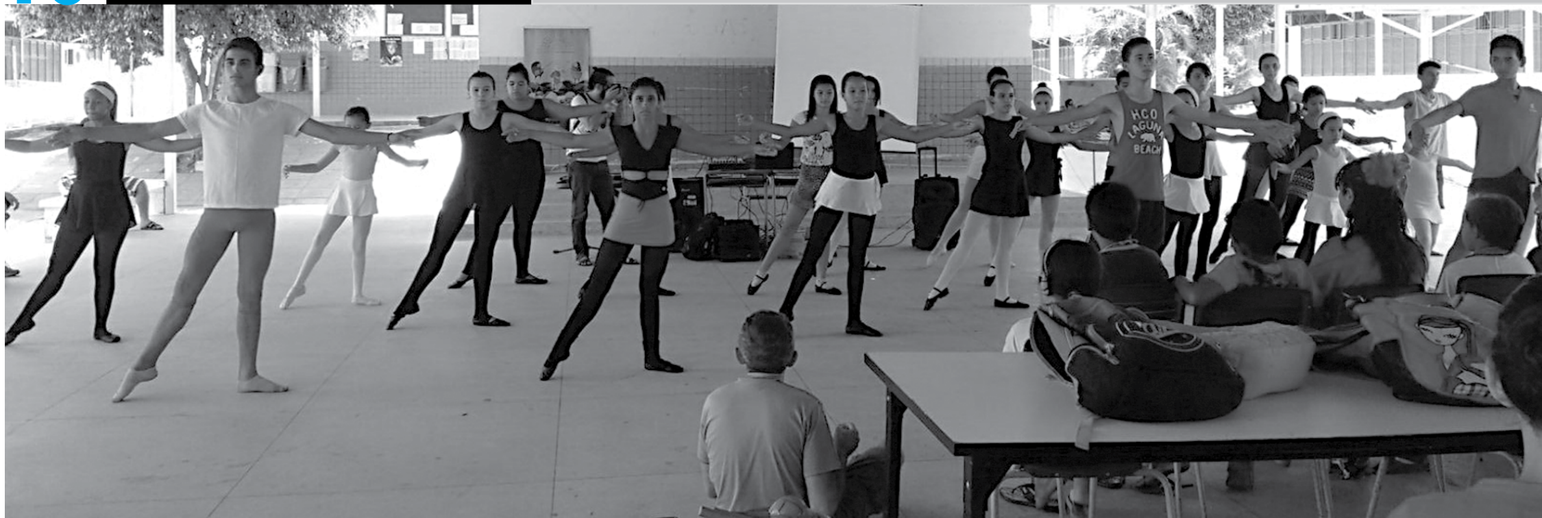
As atividades culturais realizadas pelo programa de extensão do Centro Estadual de Arte (Cearte) sempre atraem um significativo número de participantes