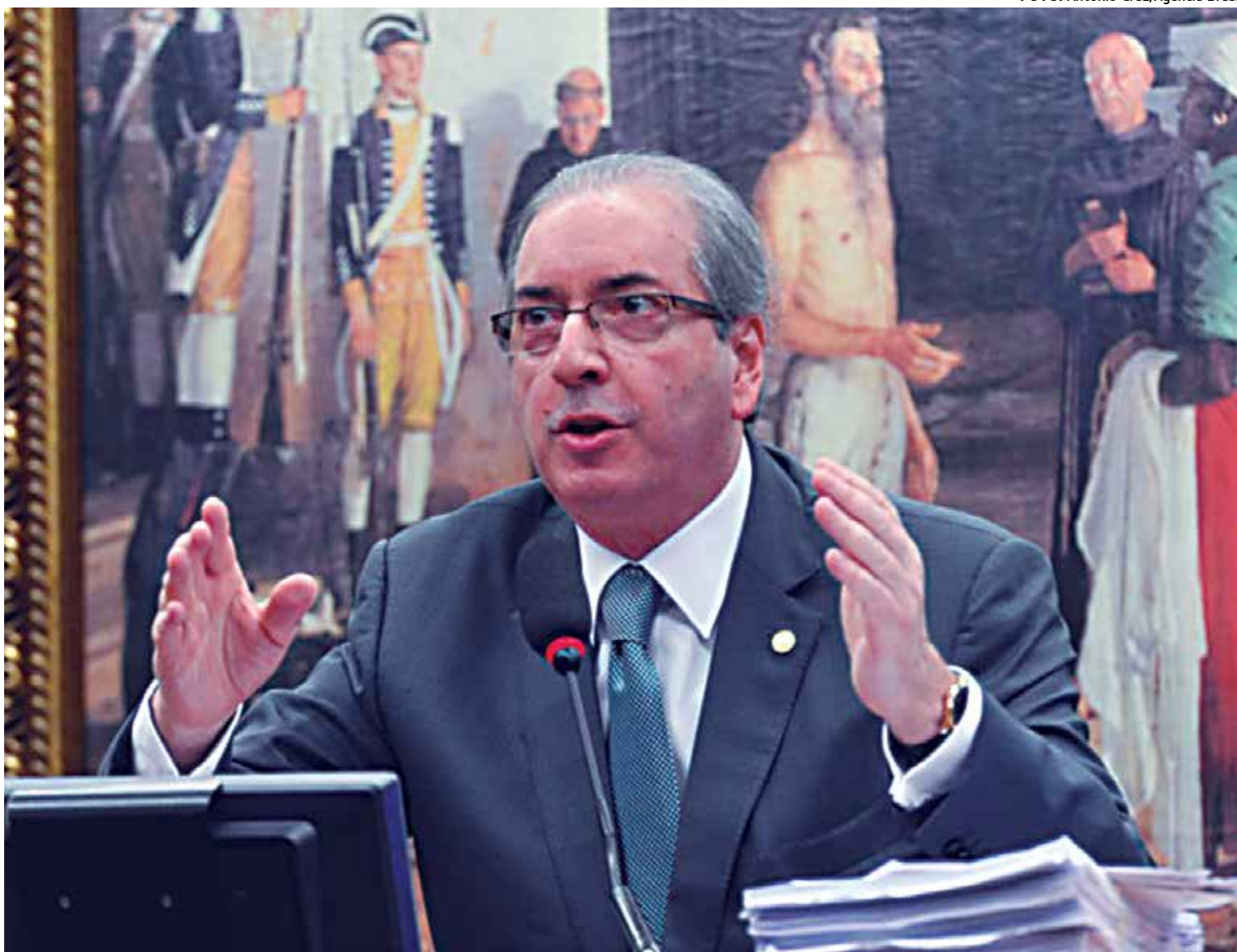
Eduardo Cunha é acusado pela PGR de receber R$ 5 milhões de propina nas contas de seu truste, com o objetivo de ocultar a origem dos valores

Na ação penal, Cunha é acusado pela Procuradoria-Geral da República (PGR) de receber R$ 5 milhões de propina nas contas de seu truste, com o objetivo de ocultar a origem dos valores. Para o relator do processo, mi-