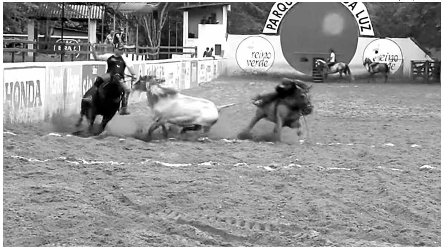
Evento do Parque Maria da Luz, em Campina Grande, é considerado tradicional pelos 'desportistas' e público afcionado