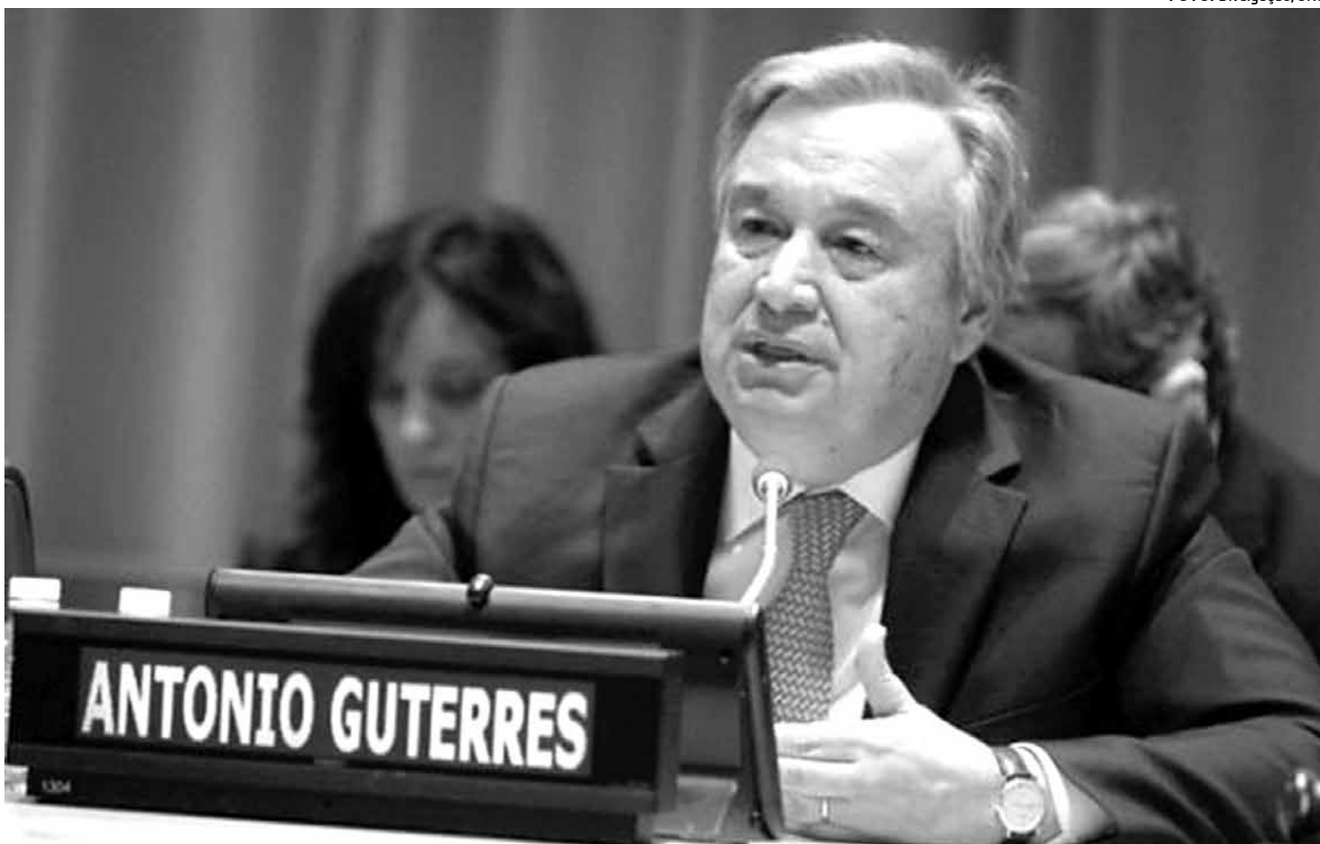
Ex-ministro dos Negócios Estrangeiros de Portugal, António Guterres, será o próximo secretário-geral das Nações Unidas

Ban Ki-moon disse, após a decisão da Assembleia, que Guterres é "bem conhecido por todos nós nos corredores". Mas, conforme acres-