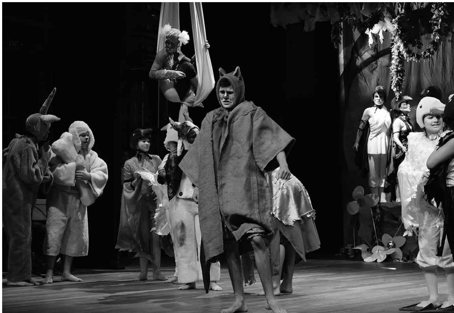
O espetáculo "O gato malhado e a andorinha sinhá" propõe reflexões sobre temas como preconceito e desigualdade social