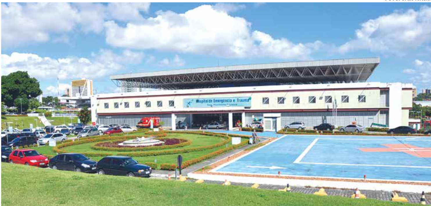
Média de atendimentos no Hospital de Emergência e Trauma de João Pessoa durante os fins de semana é em torno de 450 pessoas