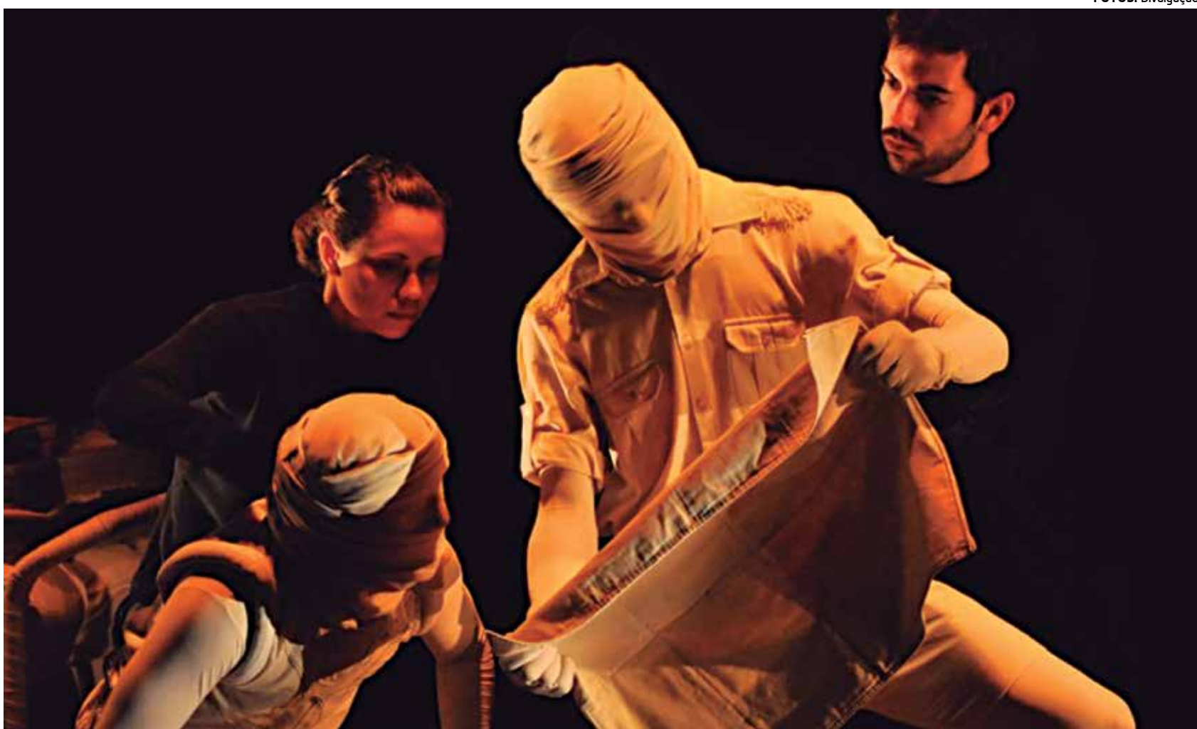
Espectáculo “O Cantil”, produzido pelo Grupo de Teatro Máquina, da cidade de Fortaleza, no Ceará

Tais práticas desenvolvidas nos anos 90 foram revistas e elaboradas novamente criando assim novos pro-