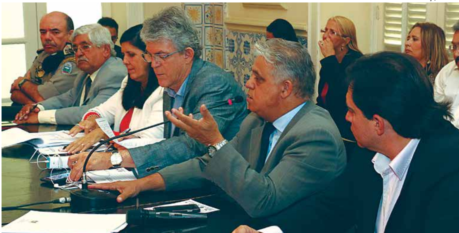
Ricardo pediu um esforço ainda maior por parte de todos da área da segurança para que seja alcançado um resultado cada vez melhor

Os números foram divulgados ontem, durante reunião de monitoramento dos dados da segurança pública, realizada no Palácio da Redenção, com a presença do governador Ricardo Coutinho. “Estamos trabalhando muito e colhendo os frutos desse trabalho constante que fazemos na área da segurança. Os bons resultados aparecem graças ao empenho e dedicação dos homens e mulheres que fazem a Segurança no Estado. Temos um efetivo superior à média nacional, somos o Governo que mais