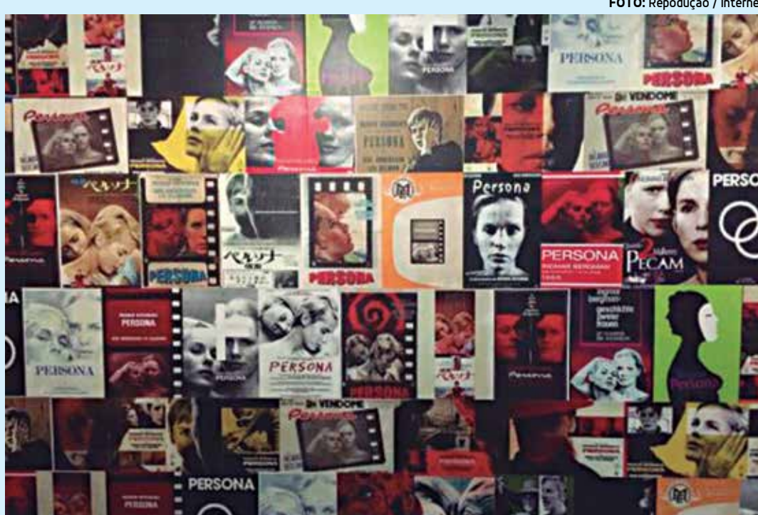
Mostra em São Paulo apresenta, pela primeira vez fora da Suécia, relíquias de Ingmar Bergman

A exposição é realizada em parceria com a 40ª Mostra Internacional de