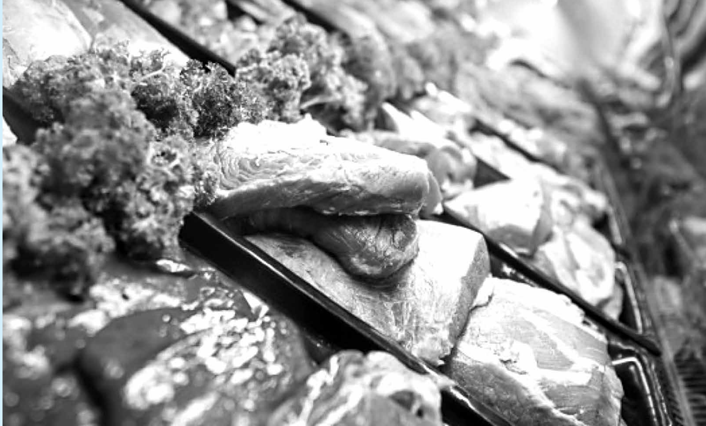
Filé bovino sem cordão, fraldinha, linguíça toscana, coxa e sobrecoxa de frango tiveram as maiores diferenças de preços