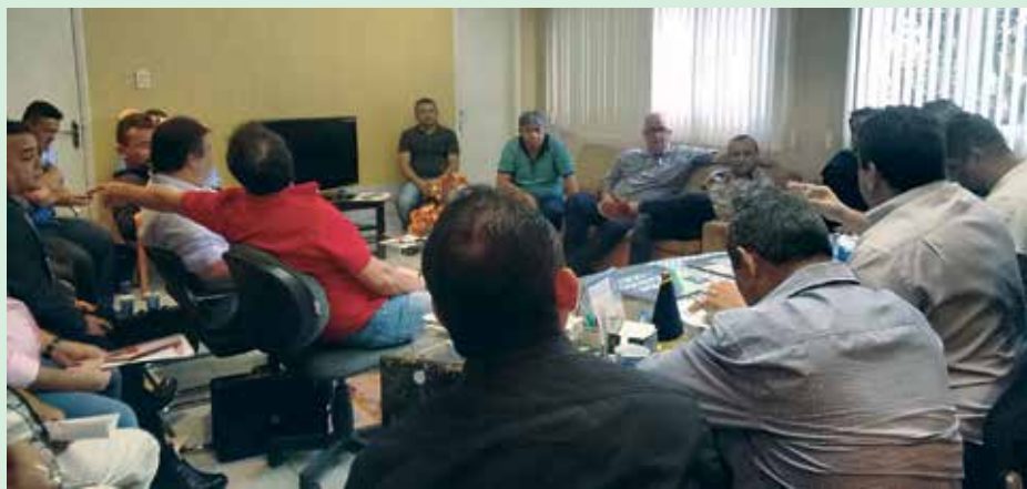
A reunião que definiu a nova forma de disputa aconteceu na última sexta-feira

Na ocasião, ficou definido que o campeonato terá início no dia 15 de janeiro. A competição vai ter uma primeira fase em que os 10 clubes vão jogar contra si em turno e retorno e depois os quatro primeiros colocados vão se enfrentar em semifinais e finais – também em jo-