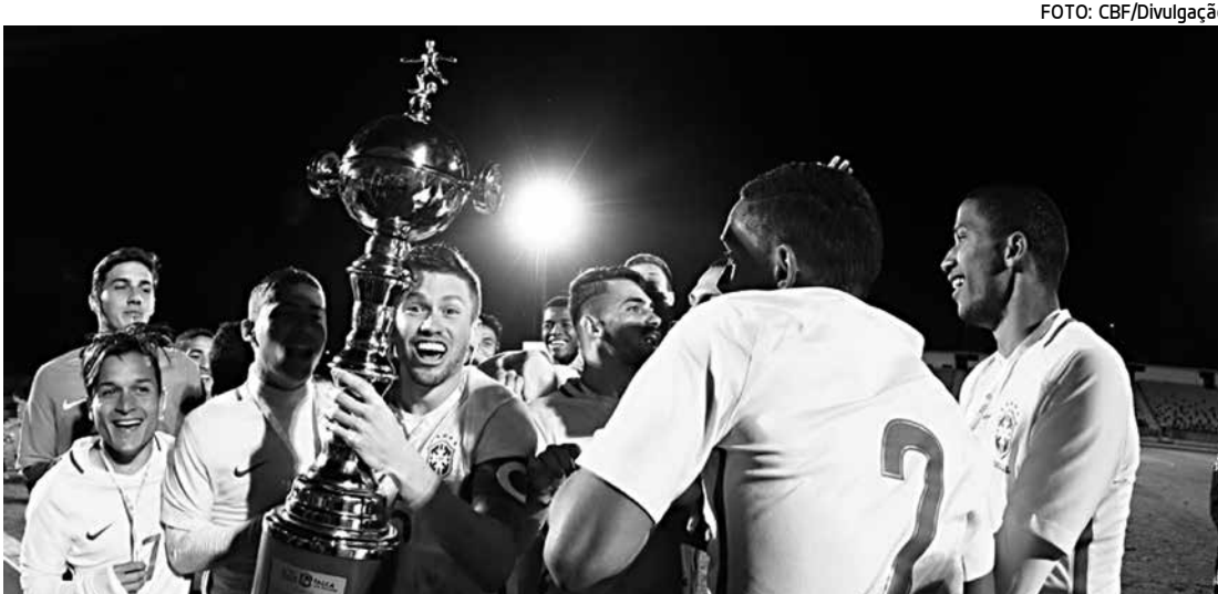
Jogadores da Seleção Brasileira Sub-20 comemoram mais uma conquista para o futebol nacional

"É importante ganhar títulos, a Seleção Brasileira sempre entra em competições para ganhar. Mas o que fica de legado é a experiência que pudemos proporcionar a estes atletas, muitos deles vestindo a amarelinha pela primeira vez, e também a observação deles em ação pela seleção. Será de fundamental importância para a disputa do Sul-Americano Sub-20 do Equador e o Sul-Americano