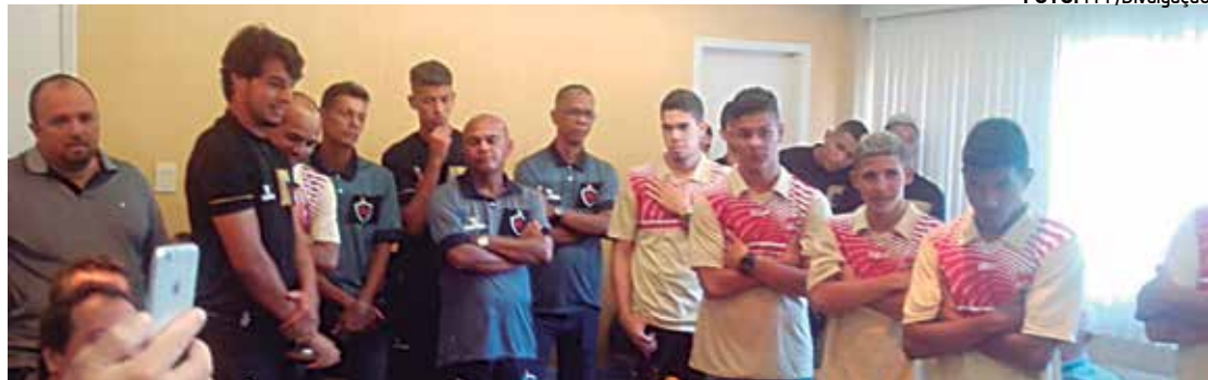
Jogadores e membros da comissão técnica de Auto e Botafogo estiveram na sede da Federação