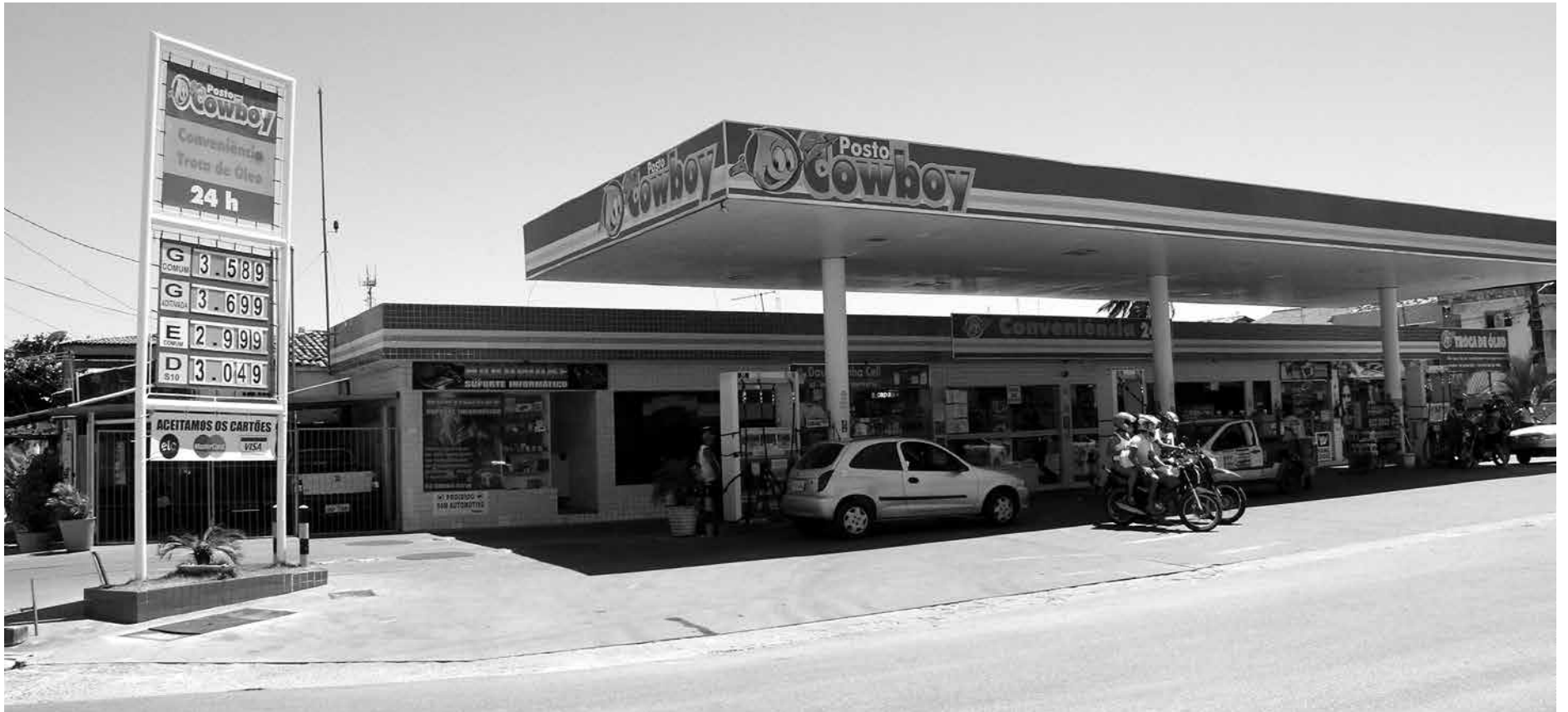
Nos postos de combustíveis da capital, a gasolina ainda está sendo vendida a preços que variam entre R$ 3,45 e R$ 3,58; valor deve ser reduzido em 3,2%

Para o Sindicato do Comércio Varejista de Combustíveis e Derivados de Petróleo (Sindipetro-PB), a redução nos preços da gasolina e do diesel ao consumidor final só poderá ser aferida após a manifestação das distribuidoras que comercializam os produtos junto ao comércio