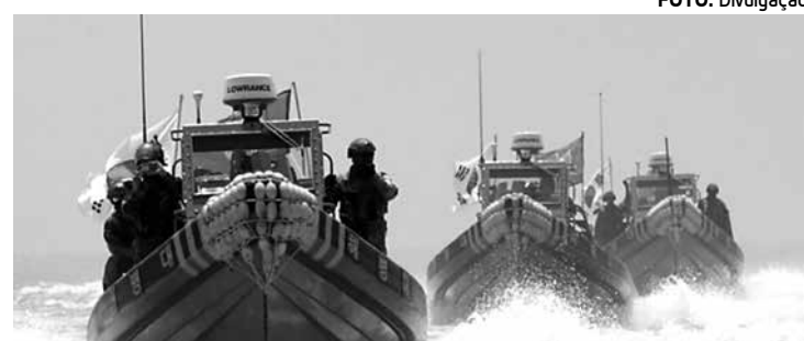
Embarcações japonesas numa fiscalização de área pesqueira

"A investigação está realizando verificações processuais em concordância com o Artigo 318 do Código Penal sobre o uso de violência contra as autoridades. Ainda não foi aberto qualquer processo criminal. Os