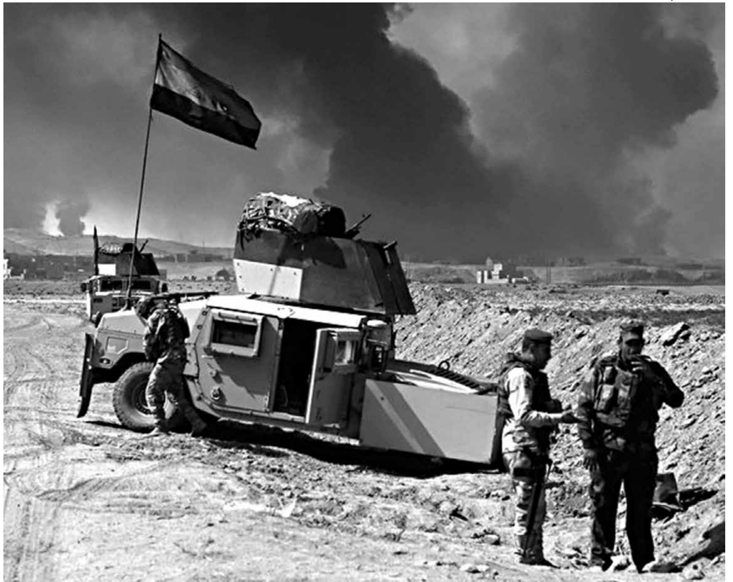
Soldados iraquianos são vistos perto da fronteira, em meio a fumaça que sobe de campos de petróleo incendiados pelo EI

Segundo o responsável da ONU pelas atividades humanitárias, Stephen O'Brien, a instituição teme que "milhares [de pessoas] poderão se encontrar sob o cerco" das tropas governamentais ou se transformar em "escudos humanos" nas mãos do Estado Islâmico.