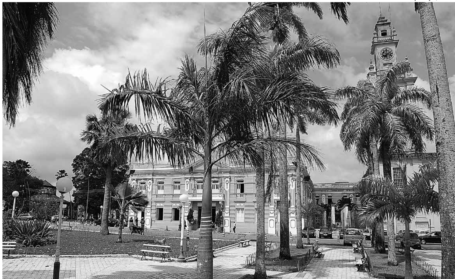
João Pessoa contou com a visita de 895.958 visitantes no período de janeiro a setembro, segundo levantamento da PBTur

Estado teve 140.124 visitantes em setembro; capital ficou com 98.634