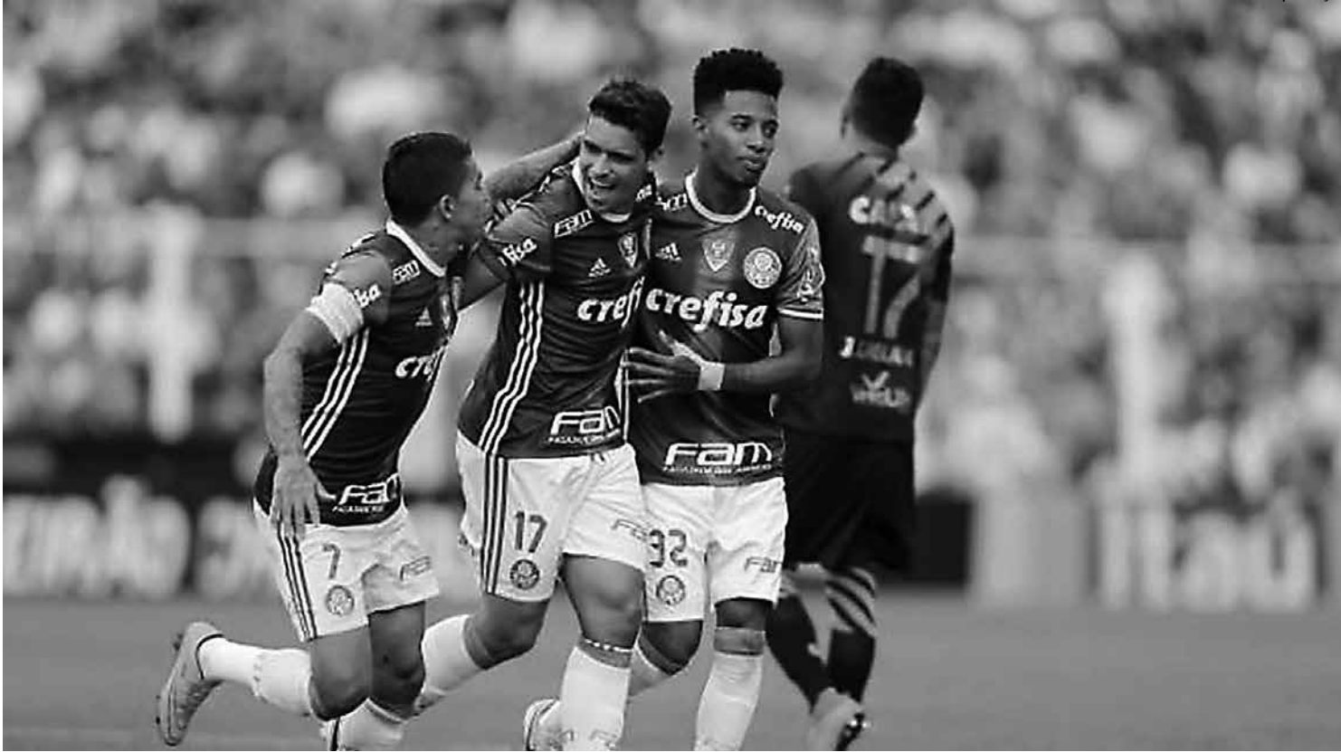
Depois de vencer o Figueirense e abrir quatro pontos de vantagem sobre o Flamengo, o técnico Cuca muda o time para jogo da Copa Brasil

Pelo jogo de ida das quartas de final, o Palmeiras perdeu por 2 a 1 para o clube gaúcho jogando em Porto