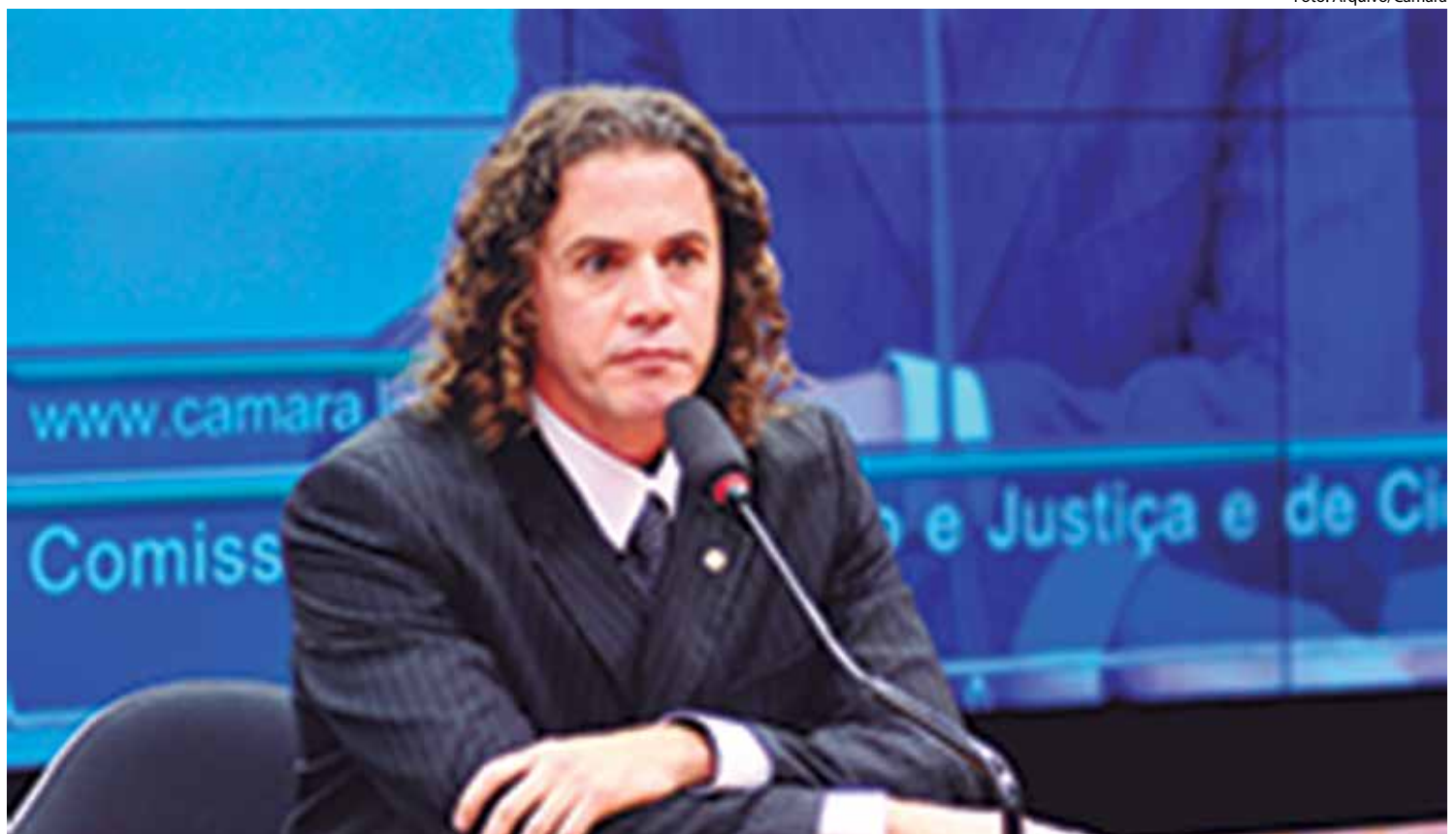
O deputado observa que a legislação exige transparência nos repasses de dinheiro do Fundo Nacional de Habitação de Interesse Social (FNHIS)

O deputado observa que a legislação exige transparência nos repasses de dinheiro do Fundo Nacional de Habitação de Interesse Social (FNHIS), mas não especifica metodologia para a seleção das famílias beneficiadas, além do cadastro feito pelo Ministério das Cidades.