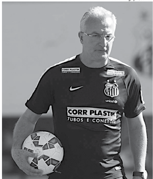
O técnico Dorival Júnior tem mais um teste de fogo no sábado