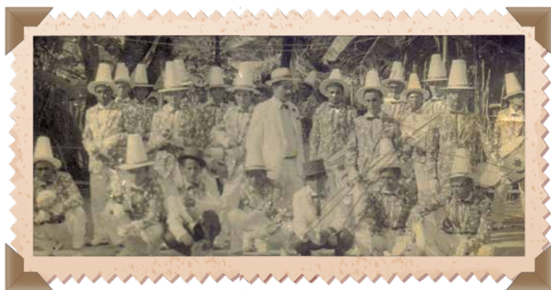
Agremiação do Carnaval Tradição de João Pessoa do ano de 1965, quando as cartolas faziam grande sucesso

meia-noite. E ninguém ligava para fato de ir a pé para casa, impulsionado por uns goles de bebida. O que importava, para a época, era esnobar porre de lança-perfume, o que agradava o público feminino. Quem portasse maior estoque de confete e serpentina garantia 50% de um pretenso namoro, pois tinha pretexto para aproximar-se da beldade a fim de desculpar-se. Na maioria das vezes, o conquistador era contemplado com um beijo. Se a moça já tivesse compromisso, certamente surgiria um "príncipe" enciumado, para iniciar um bate-boca.