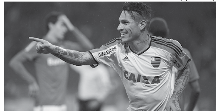
Paolo Guerrero faz uma boa temporada e marcou no último Fla-Flu