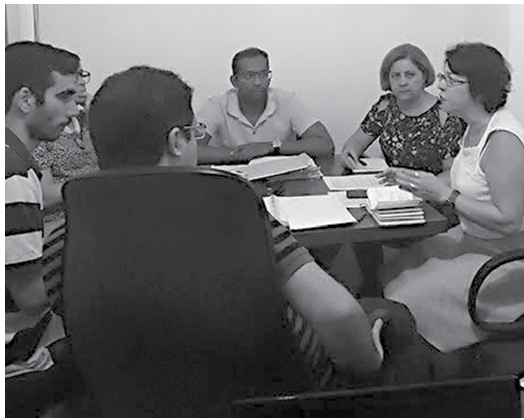
Prefeita se reuniu com secretários nesta segunda-feira de Carnaval e anunciou as medidas