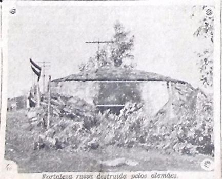
Fortalezã russa destruída pelos alemães.

bem como os aparelhos de combate, foram enviados no primeiro semestre deste mês de guerra de 1941. Disse ainda que nesse período foram fornecidos à Grã Bretanha mais aviões do que ela recebe em defesa das Ilhas Britânicas, de acordo com as listas que possuem. Os dados foram mantidos em segredo a pedido de Churchill mas, o total de 284 milhões de dolares é suficiente para a aquisição de 3.000 aparelhos de caça de primeira linha ou aproximadamente 2.600 bombardeiros de longo raio de ação.