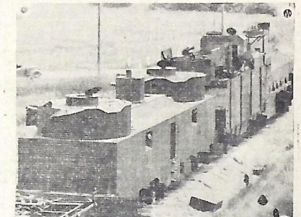
Trem blindado soviético capturado pelos alemães.

Os comunicados do Alto Comando são extremamente lacônicos e não exprimem, na realidade, o que atualmente se está passando nas diversas frentes de batalha.